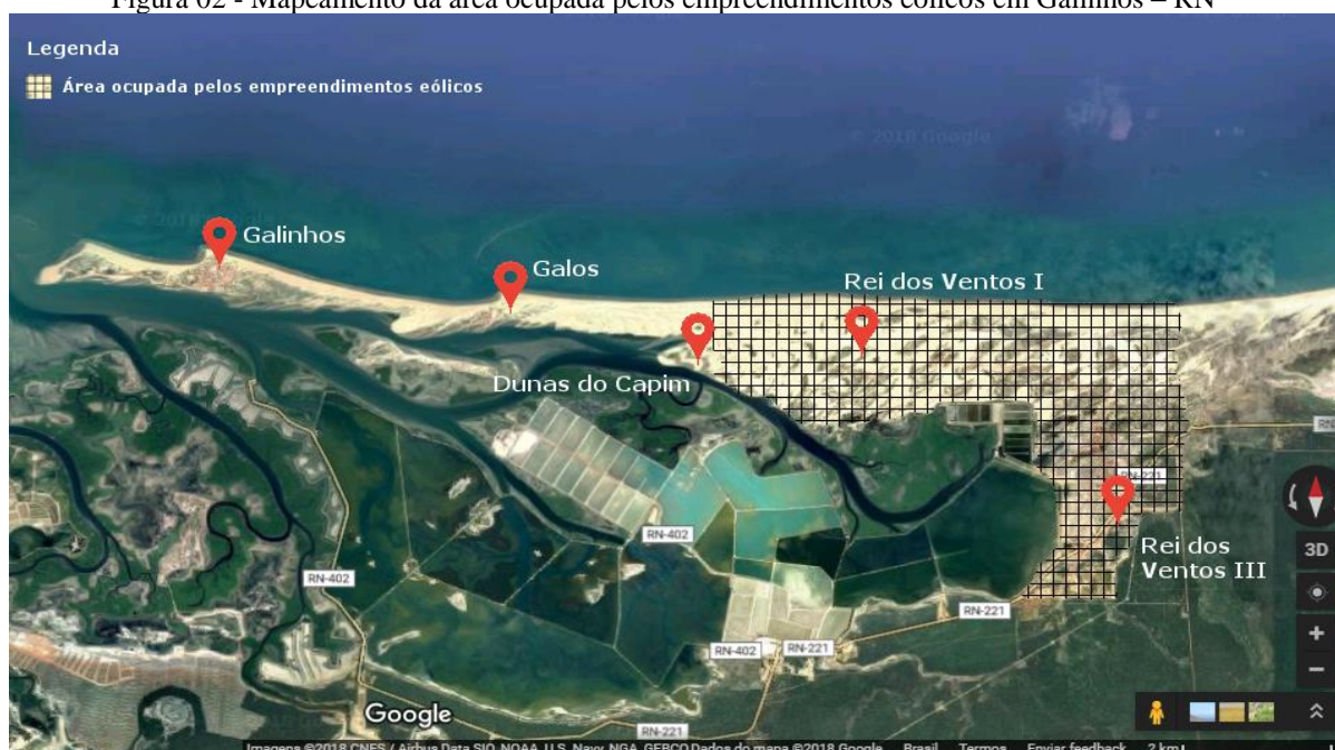
Figura 02 - Mapeamento da área ocupada pelos empreendimentos eólicos em Galinhos – RN

A inserção dos empreendimentos eólicos em Galinhos se iniciou em 2009, quando o Consórcio da Brasventos ganhou o leilão da ANEEL que autorizava a implementação de dois parques eólicos no município. Segundo o Sujeito 7, colocaram uma torre de medição previamente, mas só quatro ou cinco meses antes de início das obras é que a população teve conhecimento que seriam instalados os parques eólicos. Em 2012, com o início das obras, houve uma mobilização da população contra alguns condicionantes da implementação da energia eólica que discutiremos a seguir. Atualmente, Galinhos conta com os parques eólicos Rio dos Ventos 1 com 35 torres eólicas e 36 torres no parque Rio dos Ventos 3, totalizando 71 torres eólicas em funcionamento, autorizados a entrar em operação em maio de 2014 pela ANEEL. Veja figura 7 com a situação atual dos empreendimentos.