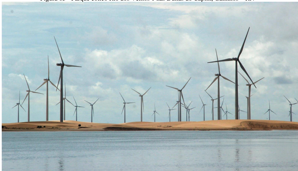
Figura 03 - Parque eólico Rio dos Ventos 1 nas Dunas do Capim, Galinhos – RN

A primeira audiência pública foi realizada no dia 29 de novembro de 2011, com o fim de apresentar os empreendimentos eólicos à população, contudo, diante dos questionamentos da população, observou-se a necessidade de se marcar uma segunda audiência, realizada no dia 12 de Dezembro de 2011 (Portal do Ministério Público do Rio Grande do Norte, 2011), marcando, assim, o início do diálogo entre a população e os empreendimentos eólicos. Segundo o Entrevistado 7, a população só teve conhecimento faltando quatro a cinco meses para as obras iniciarem, revelando assim que esse conhecimento tardio também foi um dos motivos para a mobilização.