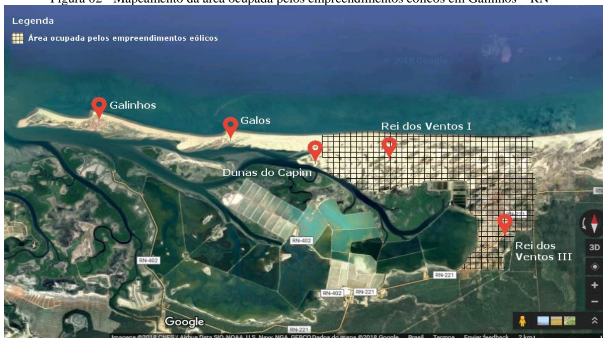
Figura 02 - Mapeamento da área ocupada pelos empreendimentos eólicos em Galinhos – RN

A inserção dos empreendimentos eólicos em Galinhos se iniciou em 2009, quando o Consórcio da Brasventos ganhou o leilão da ANEEL que autorizava a implementação de dois parques eólicos no município. Segundo o Sujeito 7, colocaram uma torre de medição previamente, mas só quatro ou cinco meses antes de início das obras é que a população teve conhecimento que seriam instalados os parques eólicos. Em 2012, com o início das obras, houve uma mobilização da população contra alguns condicionantes da implementação da energia eólica que discutiremos a seguir. Atualmente, Galinhos conta com os parques eólicos Rio dos Ventos 1 com 35 torres eólicas e 36 torres no parque Rio dos Ventos 3, totalizando 71 torres eólicas em funcionamento, autorizados a entrar em operação em maio de 2014 pela ANEEL. Veja figura 7 com a situação atual dos empreendimentos.