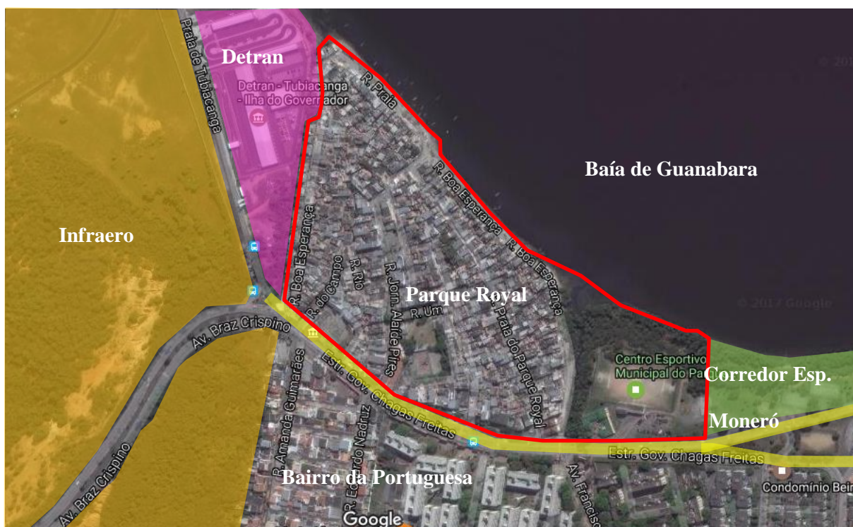
Figura 3: Mapa de localização do PR. O PR está caracterizado pelo polígono em vermelho. Seus limites são: a Estrada do Governador Chagas Freitas (antiga Tubiacanga - Canárias) (linha em amarelo); no limite oeste está um terreno vazio da Infraero (mancha laranja) e o DETRAN da Ilha do Governador (mancha em rosa); no limite leste está o Centro Esportivo Municipal Parque Royal, construído pelo PFB e o Corredor Esportivo do Moneró (mancha em verde); e por fim, a baía de Guanabara.

Fonte: Google Maps, em 03/02/2017; Edição da imagem: KROFF, 2017.