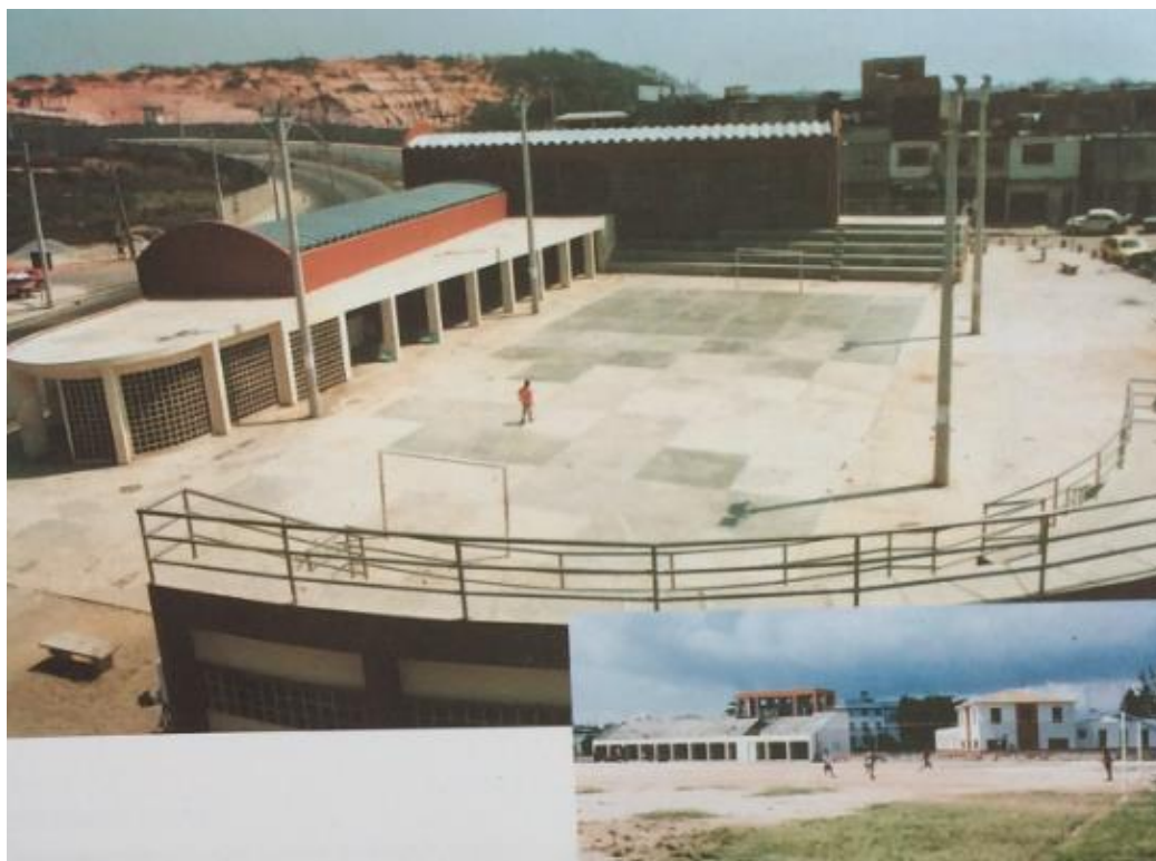
Figura 5: Área de esportes com o Centro Profissionalizante. Na imagem acima, depois das obras do PFB, e foto abaixo, antes das obras.

Os equipamentos comunitários implantados foram: uma creche (8), o centro profissionalizante (1) e serviços de assistência social (Figura 5), o centro esportivo (9), o centro polivalente (3). Foi também construído um edifício misto (residencial multifamiliar com lojas no térreo), destinado ao reassentamento dos moradores das palafitas (2). Do mesmo modo, lojas comerciais e de serviços já existentes – borracheiro, ferro velho, cabeleireiro, manicure, venda de bebidas, de rações, de material de construção, farmácia, lanchonetes, igrejas, lan house, entre outros -, nessa interface da favela com o bairro vizinho, contribuía para a consolidação desses “pontos de contato” (KROFF, 2017).