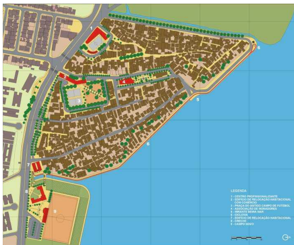
Figura 4: Planta geral do projeto de urbanização do escritório Archi 5 Arquitetos Associados.

A partir da diretriz principal do PFB de integrar a favela ao bairro do entorno, o projeto de urbanização do Parque Royal previa a implantação de “pontos de contato” (Figura 4), que levassem os moradores de ambas as áreas a compartilharem os mesmos equipamentos públicos, localizados junto à Estrada Governador Chagas Freitas (KROFF, 2017).