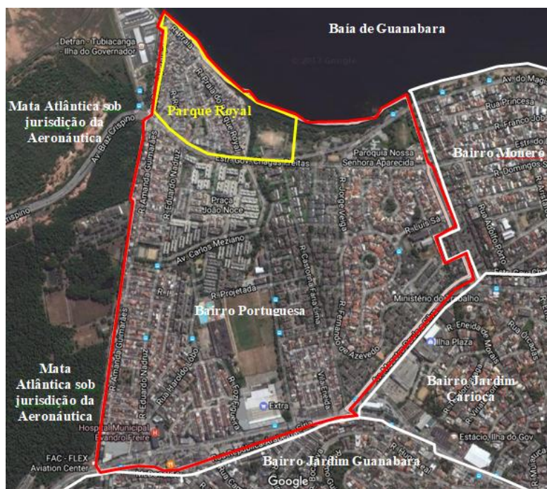
Figura 1: Mapa de localização do estudo de caso, o Parque Royal (PR), em relação à Ilha do Governador e a cidade do Rio de Janeiro.