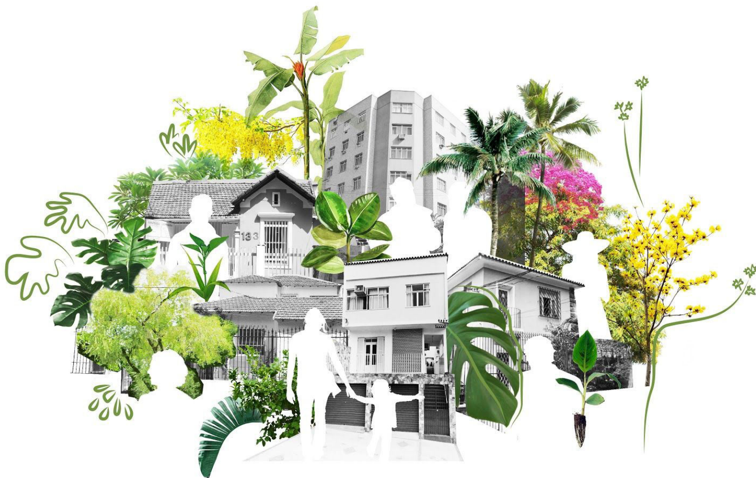
Figura 2 - Ilustração conceitual sobre a Dimensão Simbólica.