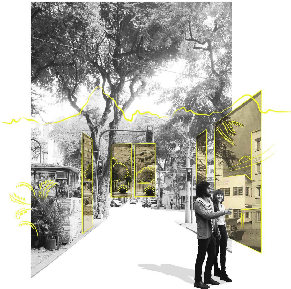
Figura 3 - Ilustração conceitual sobre a Dimensão Memorial

Posto isto, a dimensão memorial revela a sua importância pela participação na construção de identidade e reconhecimento de uma nação, pela capacidade de valorização de uma paisagem, a partir da imaginação pelo usuário das condições precedentemente existentes, das suas marcas e das semelhanças com paisagens conhecidas anteriormente e pela associação de eventos a sentimentos.