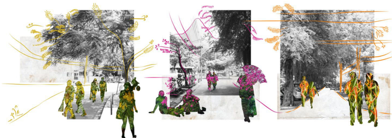
Figura 4 - Ilustração conceitual sobre a Dimensão do Ambiente

A terceira ilustração conceitual (Figura 4) tem como intenção, explorar, majoritariamente, as diversas ambiências que constroem a paisagem urbana. Adota a compreensão da vegetação como elemento desencadeador do genius loci do espaço. De que as sensações e os sentimentos proporcionados pela vegetação incorporam as particularidades e especificidades que compõem o caráter do espaço, bem como percorre as cenas do cotidiano no espaço urbano e o relacionamento entre os seus usuários e a vegetação durante o cotidiano numa busca por retorno à essência das coisas.