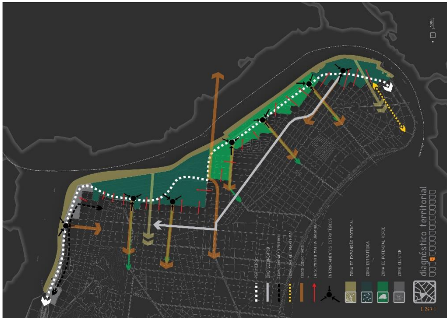
Figura 5: Diagrama do diagnóstico territorial frente ao Porto de Santos.