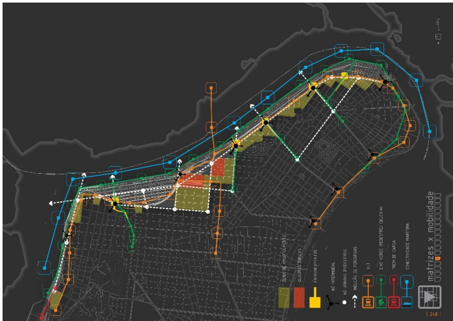
Figura 4: Diagrama conceitual de matrizes e mobilidade do Porto de Santos.