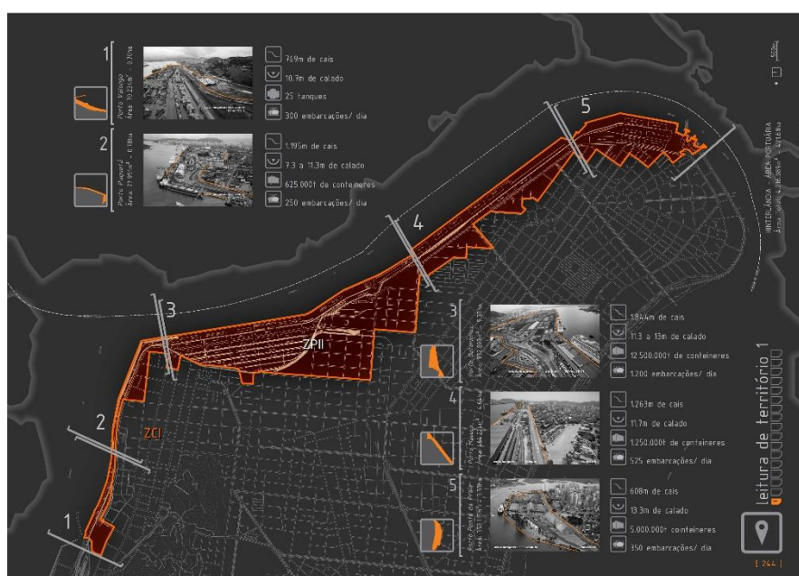
Figura 1: Zonas Portuárias do Porto de Santos

A leitura do território portuário é fundamental para a compreensão da área de estudo, que compõe a margem direita do Porto de Santos, formado pelas Zonas Portuárias ZPI, ZPII e ZCI 1 definindo a hinterlândia 2 , que é composta pelo setor ferroviário, eixo perimetral de veículos e os armazéns de estocagem que estão localizados ao longo da conformação da série de portos interconectados denominados de Valongo, Paquetá, Outeirinhos, Macuco e Ponta da Praia (figura 1).