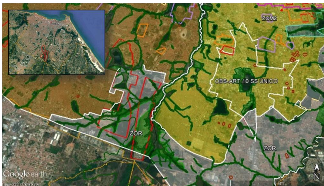
Figura 02 – Limites do Cidade Jardim e zoneamento do PDPFor 2009.

A aquisição do terreno deu-se pela forma permuta financeira, em que foi feito um contrato de aquisição por quadras e lotes, no qual o incorporador do empreendimento (a LM incorporadora), através da Sociedade de propósito específica (SPE) “Cidade Jardim Urbanismo”, pagará apenas quando (e se) o empreendimento for sendo efetivado. Assim, o pagamento do terreno é realizado apenas quando o incorporador do loteamento receber os recursos de outra incorporadora ou do governo, visto que a proposta da incorporadora (a LM) é comercializar o “pacote” das “glebas” 3 e quadras para outras empresas ou empreendedores e não pretendia comercializar diretamente com os futuros clientes das unidades habitacionais.