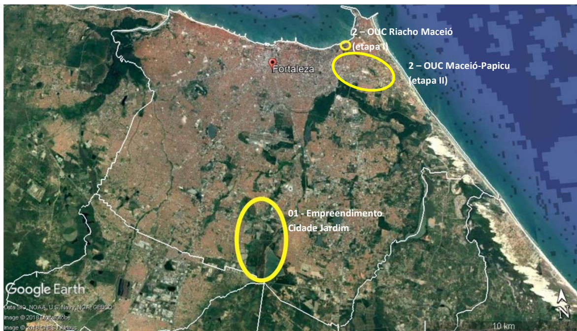
Figura 01 – Localização estudos de caso.

Para tanto, as análises dos estudos de casos foram realizadas a partir de entrevistas aos incorporadores dos empreendimentos, a moradores e a representante do MTST (no caso do empreendimento Cidade Jardim), apoiado por notícias em matéria de jornal. As considerações feitas sobre a nova OUC que incide sobre o riacho Maceió (OUC Maceió-Papicu) foram feitas com base nos relatório e proposta de minuta de lei realizada desta operação.