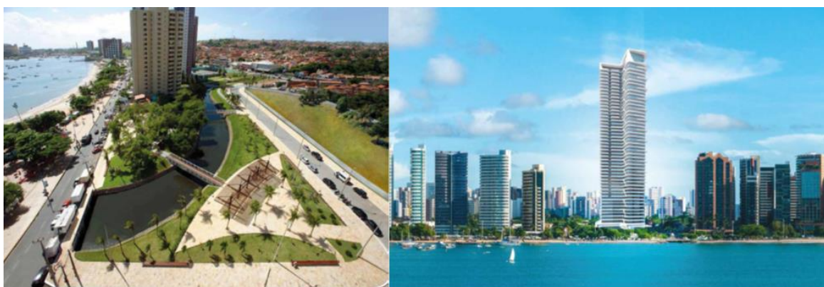
Figura 04 – Vista do parque executado pela OUC do Riacho Maceió e do terreno onde será implantado a torre. Maquete da proposta de edifício da OUC Riacho Maceió.

A outra grande flexibilização imposta pela lei de criação dessa OUC foi a liberação do Índice de Aproveitamento (I.A.) [...] o Índice de Aproveitamento ao qual se permitiu chegar no terreno foi de 5.42, lembrando que esta área era destinada a proteção ambiental e preservação ambiental, cujos I.A. eram 0,6 e 0 respectivamente. (HOLANDA E ROSA, 2017, p. 20, grifo nosso)