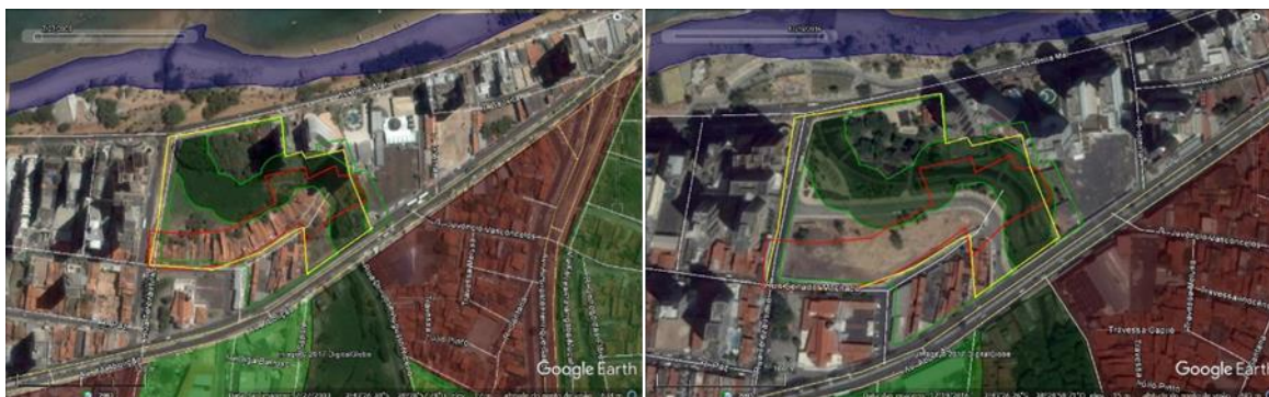
Figura 03 – Área da OUC do Riacho Maceió, antes e depois da implantação do parque e com as casas da ocupação do Maceió removidas. Fonte: Google Earth; Fortaleza/PDP(2009). Elaboração: autora.

Holanda e Rosa (2017) observam que o primeiro ponto de flexibilização que a lei da OUC do Riacho Maceió trouxe foi a alteração do zoneamento, reduzindo a área de preservação permanente do Riacho que corta o referido terreno. Ainda segundo verificaram esses autores: