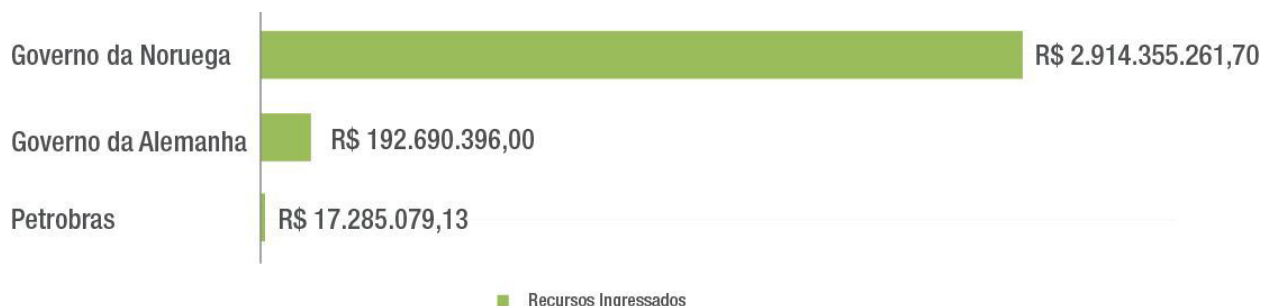
Figura 2: Gráfico de recursos ingressados no FA.