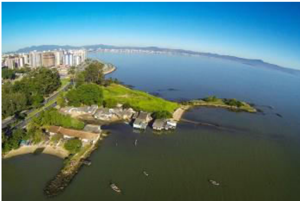
Figura 3: A Ponta do Coral como um território em disputa