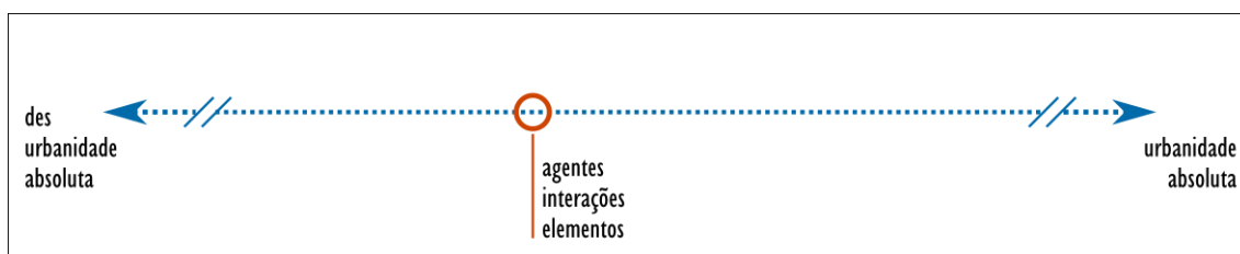
Figura 1: O Continuum da Urbanidade.

A condição de urbanidade emerge da interação entre os agentes locais em face aos elementos presentes em cada contexto urbano na presença, ou ausência, de eventos efêmeros ou cotidianos. Urbanidade é um valor sempre positivo? Como efeito de lugar, a urbanidade possui nuances qualitativas, mas não gradações passíveis de serem medidas por algum meio sensível. Para ilustrar esse fato, imaginemos um diagrama composto por um segmento, não graduado, no qual seja possível identificar no intervalo entre suas extremidades uma condição de urbanidade direita e esquerda, contêm, respectivamente, a urbanidade absoluta e a desurbanidade absoluta. Este segmento é interrompido, próximo a cada extremidade, de modo que não é possível em nenhum momento se alcançar os valores absolutos, por mais próximo que estejam os índices das variáveis de urbanidade. A figura 1 é a representação gráfica deste diagrama.