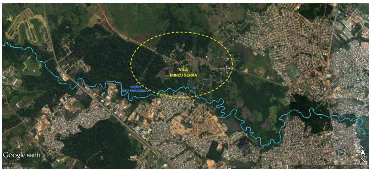
Figura 1: Alto Santo e Vila Irineu Serra – localização em relação à mancha urbana de Rio Branco (Norte)

Após 100 anos de origem e 70 anos nesse lugar, a vida comunitária e a paisagem resultante de seu cotidiano enfrentam severas ameaças pelos movimentos de empreendedorismo urbano e da urbanização corporativa, a despeito dos mecanismos instituídos para proteção do lugar como a Área de Proteção Ambiental Raimundo Irineu Serra e os decretos de Patrimônio Histórico e Cultural do município de Rio Branco e do estado do Acre.