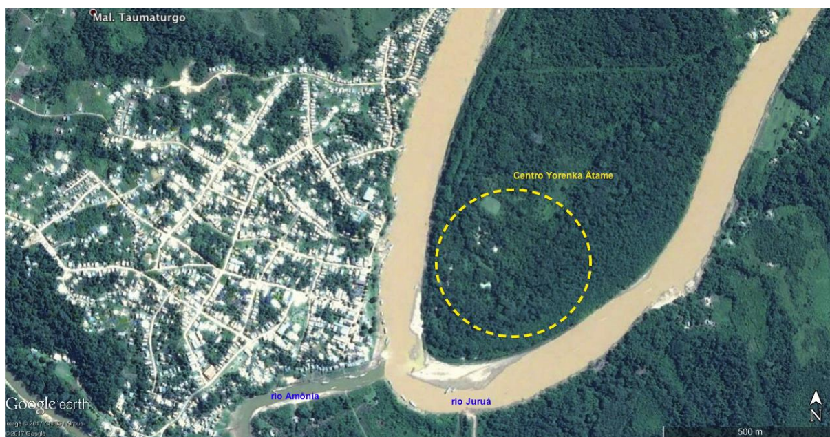
Figura 3: Centro Yorenka Ātame: implantação

Casos assim evidenciam o discreto expansionismo cultural que lentamente vem se interpondo ao fluxo aparentemente dominante de movimentos hegemônicos. Evidenciam o propagar de pactuações e o modo como opera a inteligência social local, construída a partir da base da organização comunitária que vincula alianças e diálogo, o que demonstra como dificilmente alguma alternativa se desenha que não pelo exercício ético da política.