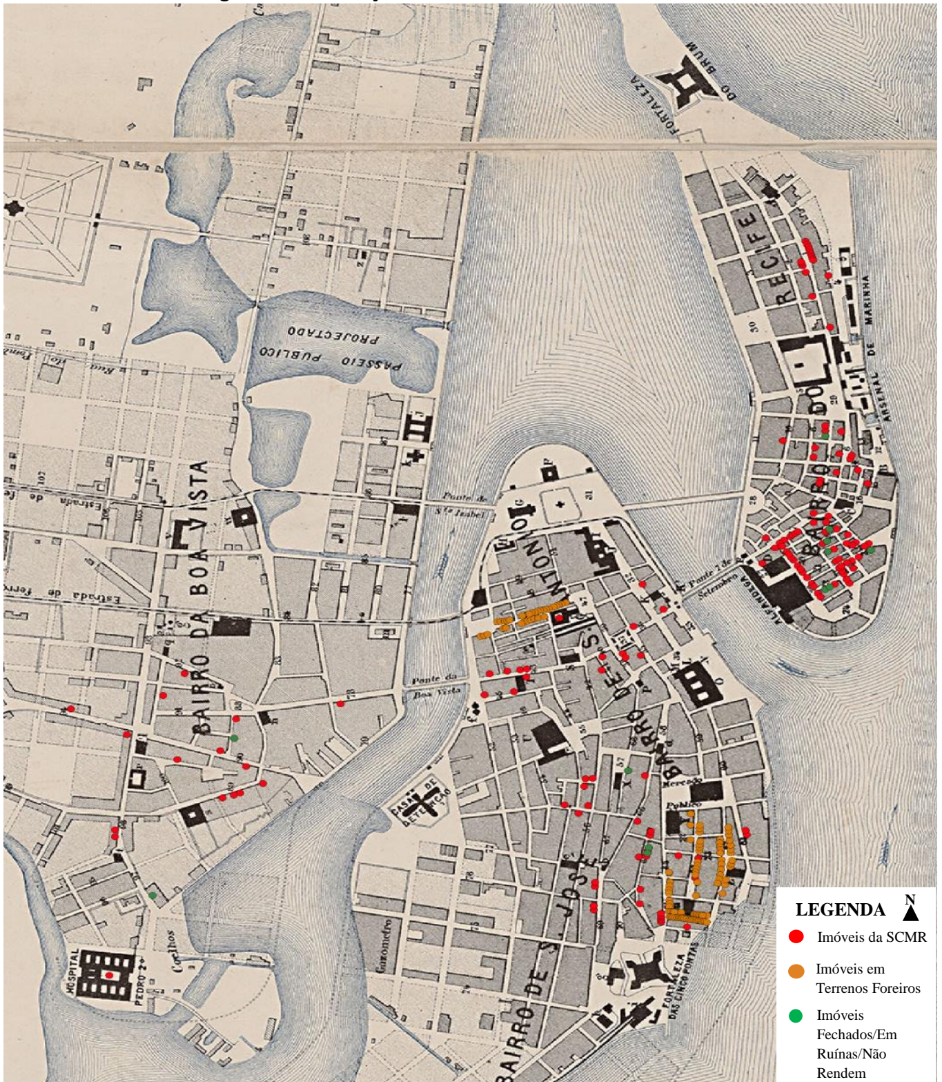
Figura 1 – Localização dos Imóveis da SCMR no CHR - 1878