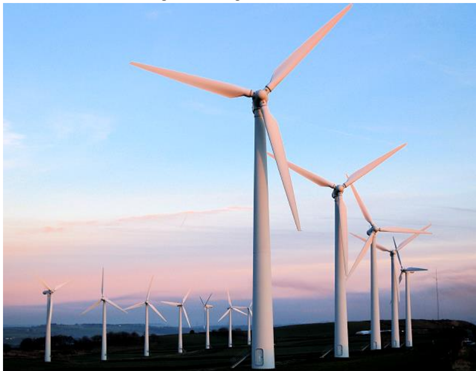
Figura 5 – Aerogerador de eixo horizontal.