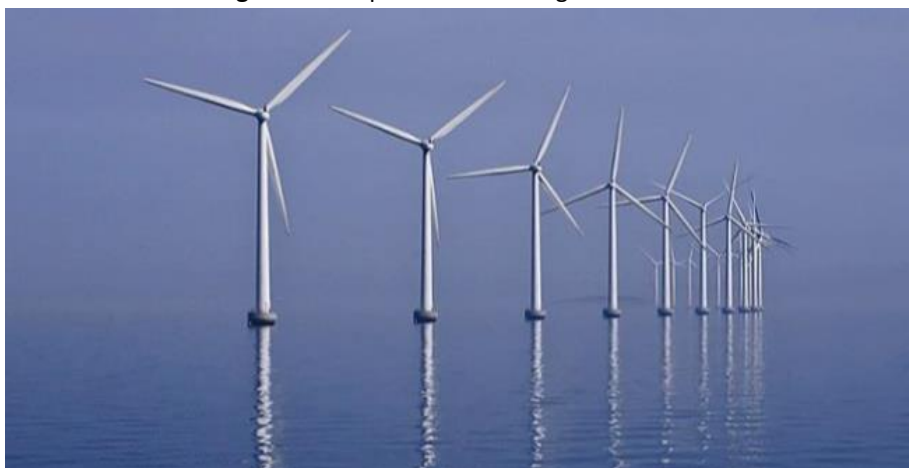
Figura 2 - Parque Eólico Middelgrunden na Dinamarca

Os aerogeradores quanto à sua localização podem ser classificados como “onshore” e “offshore” (Figuras 2 e 3), caso se localizem em terra ou na água, respectivamente. As principais diferenças entre os dois tipos têm a ver com o tipo de fundação usada e a interligação com a rede elétrica, além dessa subdivisão, os aerogeradores podem possuir dois tipos de eixo, o vertical e horizontal (SIMÕES, 2015).