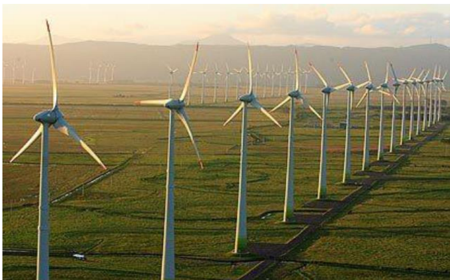
Figura 3 - Parque Eólico Osório no Brasil