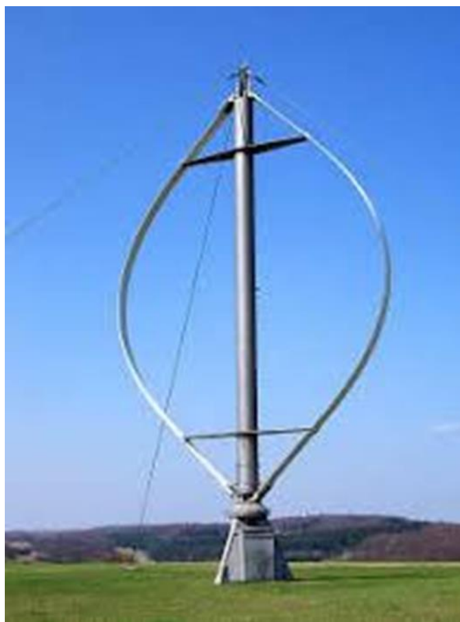
Figura 4 – Aerogerador de eixo vertical.