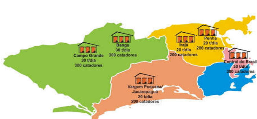
Figura 1 – Futuras Centrais de Triagem a serem criadas

A prefeitura do Rio almeja ampliar a coleta seletiva via o Programa de Ampliação da Coleta Seletiva da Cidade, cuja meta é estender os serviços a todos os 160 bairros da cidade, “promovendo a inclusão social e produtiva de até 1.500 catadores de materiais recicláveis e garantindo o reaproveitamento de 5% dos materiais potencialmente recicláveis presentes no lixo domiciliar”. Foi assinado um contrato, em dezembro de 2010, entre a Prefeitura do Rio de Janeiro e o Banco Nacional para o Desenvolvimento Econômico e Social (BNDES) envolvendo recursos da ordem R$52 milhões. A coleta dos materiais recicláveis das residências “será realizada duas vezes por semana, ‘in door’ , de forma a impedir o acesso da população de rua aos materiais segregados pela população”. O Programa envolve a construção de ao todo seis Centrais de Triagem, “três com capacidade de processar 30 t/dia, absorvendo a mão de obra de até 300 catadores, localizadas nos bairros do Centro, Bangu e Campo Grande. As três restantes serão 33 implantadas nos bairros da Penha, Irajá e Vargem Pequena e processarão 20 t/dia, atendendo cada uma até 200 catadores” (RIO DE JANEIRO, 2012, p. 33-34). Veja na figura a seguir a proposta de instalação dos Centrais de Triagem.