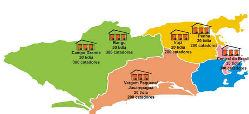
Figura 1 – Futuras Centrais de Triagem a serem criadas

A prefeitura do Rio almeja ampliar a coleta seletiva via o Programa de Ampliação da Coleta Seletiva da Cidade, cuja meta é estender os serviços a todos os 160 bairros da cidade, “promovendo a inclusão social e produtiva de até 1.500 catadores de materiais recicláveis e garantindo o reaproveitamento de 5% dos materiais potencialmente recicláveis presentes no lixo domiciliar”. Foi assinado um contrato, em dezembro de 2010, entre a Prefeitura do Rio de Janeiro e o Banco Nacional para o Desenvolvimento Econômico e Social (BNDES) envolvendo recursos da ordem R$52 milhões. A coleta dos materiais recicláveis das residências “será realizada duas vezes por semana, ‘in door’ , de forma a impedir o acesso da população de rua aos materiais segregados pela população”. O Programa envolve a construção de ao todo seis Centrais de Triagem, “três com capacidade de processar 30 t/dia, absorvendo a mão de obra de até 300 catadores, localizadas nos bairros do Centro, Bangu e Campo Grande. As três restantes serão 33 implantadas nos bairros da Penha, Irajá e Vargem Pequena e processarão 20 t/dia, atendendo cada uma até 200 catadores” (RIO DE JANEIRO, 2012, p. 33-34). Veja na figura a seguir a proposta de instalação dos Centrais de Triagem.