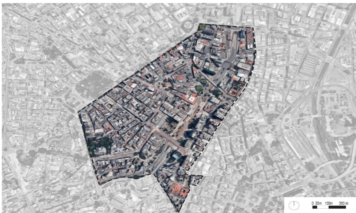
Figura 1.1 - Perímetro da Operação Urbana Anhangabaú. Modificações da autora sobre base Mapa Digital da Cidade.

Porém, antes de serem implantadas as Operações Interligadas, havia sido proposto na gestão Mário Covas (1982-1985) um instrumento urbanístico, baseado em estudos realizados anteriormente pelo GEGAN, cujo objetivo era minimizar os gastos públicos com obras de infraestrutura urbana e habitação social por meio de parceria público-privada 15 , a Operação Urbana (OU). Esta foi concebida como forma de acelerar as transformações urbanísticas tanto nos bairros periféricos quanto nas áreas centrais do município de São Paulo. A OU foi apareceu pela primeira vez na Lei nº 10.676/1988, que instituiu o Plano Diretor da cidade, junto com as Operações Interligadas, ambas propondo a parceria público-privada como alternativa diante da falta de recursos públicos para realizar as obras e equipamentos necessários para a cidade. Contudo, a sua implementação ocorreu de fato em 1989 na Operação Urbana Anhangabaú, formulada com objetivo de conceder benefícios urbanísticos em troca de contrapartida financeira, buscando atrair o interesse de investidores privados na área central da cidade e realizar um conjunto de obras proposto (SEMPA, 1985; MONTANDON, 2009; SÃO PAULO, 1991).