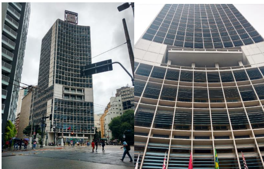
Figura 1.4 - Hotel Jaraguá vista da Rua Coronel Xavier de Toledo (imagem à esquerda) e, fachada principal do Hotel Jaraguá com seus brises (imagem à direita).

Ostentando brises móveis, volumetria imponente, painéis de artistas consagrados e um grande relógio no topo, o edifício foi tombado pelo Conselho Municipal de Preservação do Patrimônio Histórico, Cultural e Ambiental da Cidade de São Paulo (CONPRESP) através da Resolução 37/1992 – que versa sobre o tombamento do Vale do Anhangabaú. Inaugurado em 1954, tendo conhecido seu auge como um dos melhores hotéis da cidade entre 1950 e 1960, entrou em declínio nos anos de 1970, quando novos hotéis do mesmo porte foram inaugurados na região central, para, em 1998 ser desativado (ALVAREZ; CAMPOS, 2007; CONPRESP, 1992).