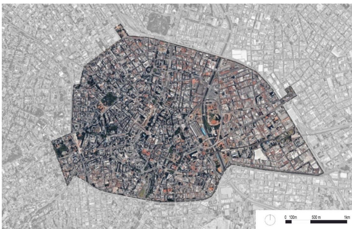
Figura 3.4 – Perímetro da Operação Urbana Centro. Elaboração da autora. Fonte: Mapa Digital da Cidade com camadas obtidas a partir do GEOSAMPA, 2017.

Assim, em 1997, a Operação Urbana Centro 17 foi aprovada, tendo como objetivo focal a implementação de condições que reforçassem a importância da área central para a metrópole de São Paulo, “tornando-a atraente para investimentos imobiliários, turísticos e culturais e preparando-a para o papel de cidade mundial” (EMURB, 1997, p. 1). Abrangendo uma extensão de aproximadamente 662,9 hectares, alcança as áreas do Glicério, Brás, Bexiga, Vila Buarque e Santa Efigênia, cujo perímetro é composto por uma heterogeneidade de usos e densidades. Esperando promover transformações através da concessão de incentivos urbanísticos a Operação Urbana Centro tem como diretrizes: o estímulo ao remembramento de lotes; a ampliação e recuperação de espaços públicos; o incentivo à construção de habitações; a intensificação do uso do solo; a conservação e restauro dos edifícios de interesse histórico bem como sua valorização através da (re)composição de faces (SÃO PAULO, 1997; MONTANDON, 2009).