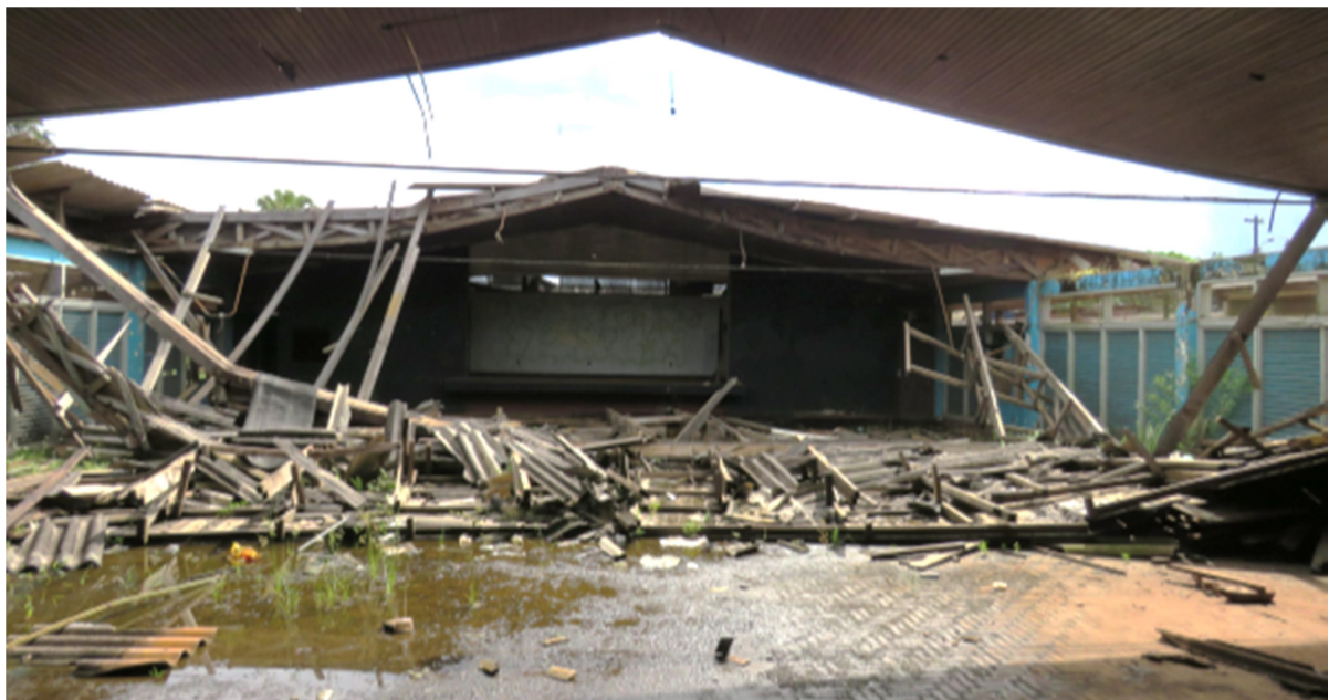
Fig. 8 – Desabamento da cobertura do Clube de Serra do Navio (AP), o tempo agindo contra o patrimônio.

Tanto é que essa cidade empresarial exemplar do modernismo, digna de atenção pela habilidade como seu plano foi conduzido pelas mãos de seu projetista, está tombada pelo Instituto do Patrimônio Histórico e Artístico Nacional (IPHAN) como Patrimônio Cultural do Brasil desde abril de 2010, após ser objeto de estudos por dez anos, com levantamentos fotográficos e arquitetônicos referentes a sua implantação, instalações e edificações. Contudo, pesquisas e imagens recentes identificam o seu alto grau de depauperação e arruinamento (Fig. 8), sobretudo dos edifícios públicos, por falta de manutenção e investimentos.