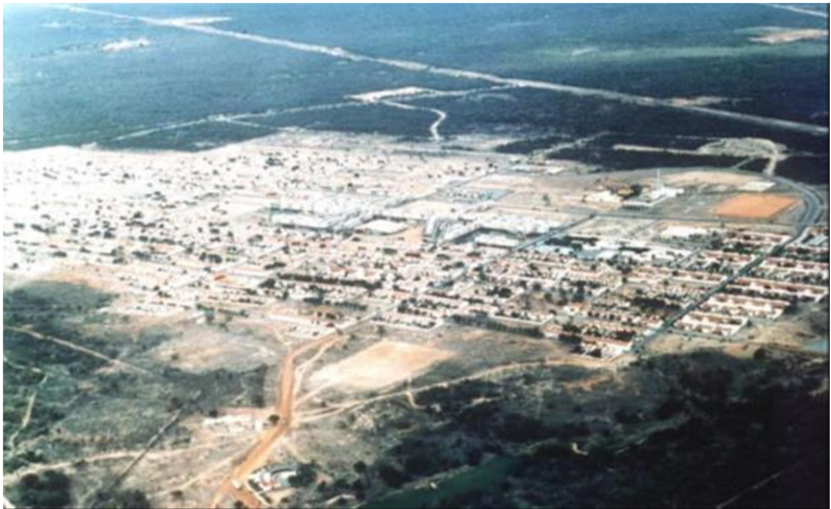
Fig. 10 – Vista aérea de Caraíba (BA), com destaque para edifícios públicos na paisagem urbana.