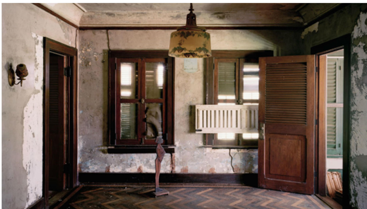
Fig. 5 – Casa abandonada em Fordlândia (Pará), vestígios de um tempo passado e estagnado.

Fato é que Fordlândia nasceu fadada a não vingar. Alheia à realidade local, com projeto importado na íntegra, a cidade passou a ser apenas um espectro do sonho idealizado por Ford – o qual nunca veio ao Brasil por receio de contrair alguma doença tropical. Com um investimento de cem milhões de dólares aplicados na sua construção e na da vizinha Belterra (1934), após entrosques culturais, percalços produtivos e queda no preço internacional da borracha devido ao incremento na produção da Malásia e à substituição pela borracha sintética, a Ford Co. deixou a região, repassando a responsabilidade de governança e manutenção para o Estado do Pará. Hoje, os moradores desses dois assentamentos subsistem da pesca e de atividades agrícolas, restando nas ruínas dos edifícios originais as pegadas, os vestígios, as memórias de uma epopeia malfadada (Fig. 5).