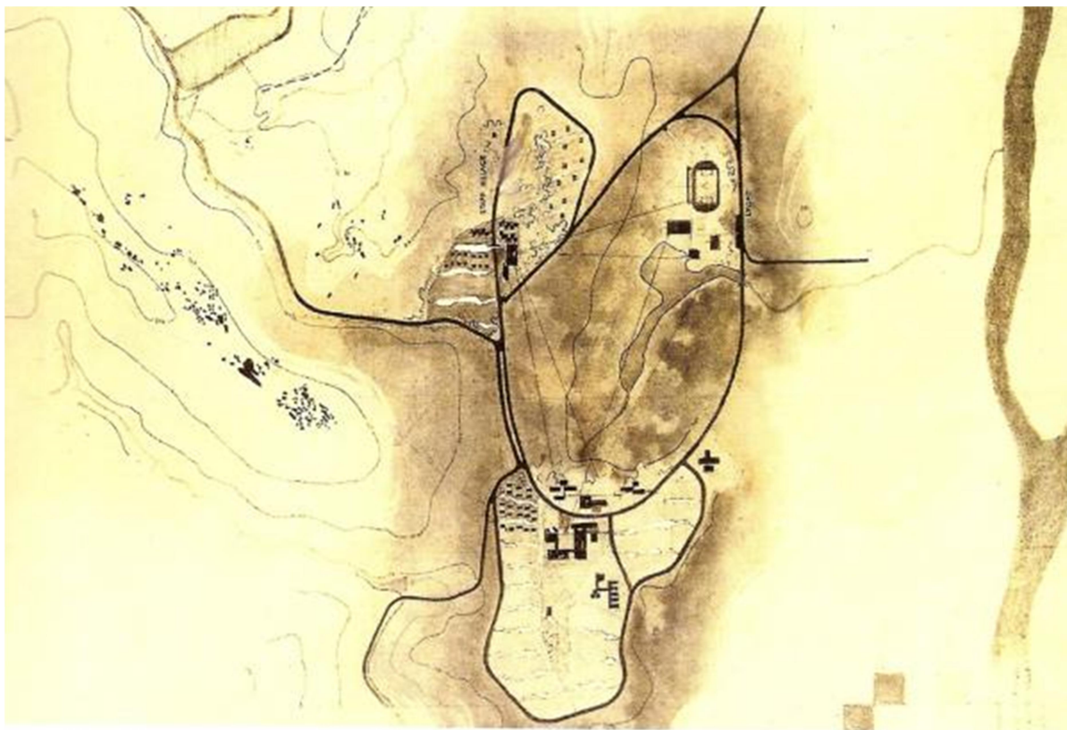
Fig. 6 – Plano urbanístico de Serra do Navio (Amapá).

orçado a cada etapa de execução, de modo a garantir completa independência e autossuficiência para Serra do Navio (SEGAWA; DOURADO, 1997) (Fig. 6).