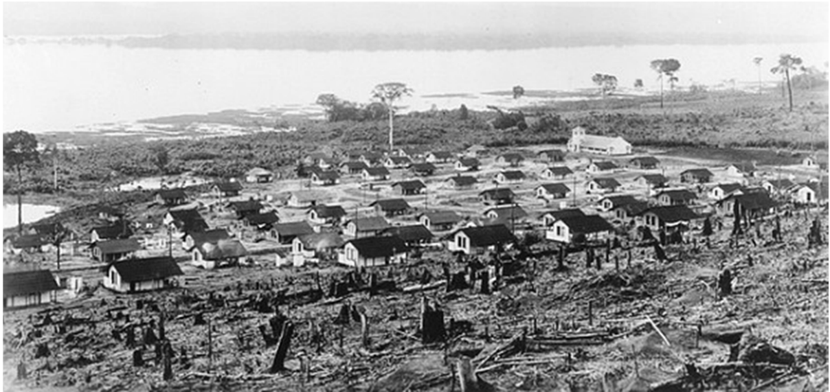
Fig. 4 – Vista do núcleo residencial de Fordlândia (Pará), com devastação da flora do entorno.

bem como as unidades habitacionais – importadas integralmente dos EUA e transportadas até o local por navios –, foram dispostos rigorosamente em seus lugares por guindastes. O projeto, conduzido sob o olhar atento de Ford, era algo muito maior que um simples acampamento operário; previu-se uma cidade para abrigar até 5 mil habitantes (SENA, 2008).