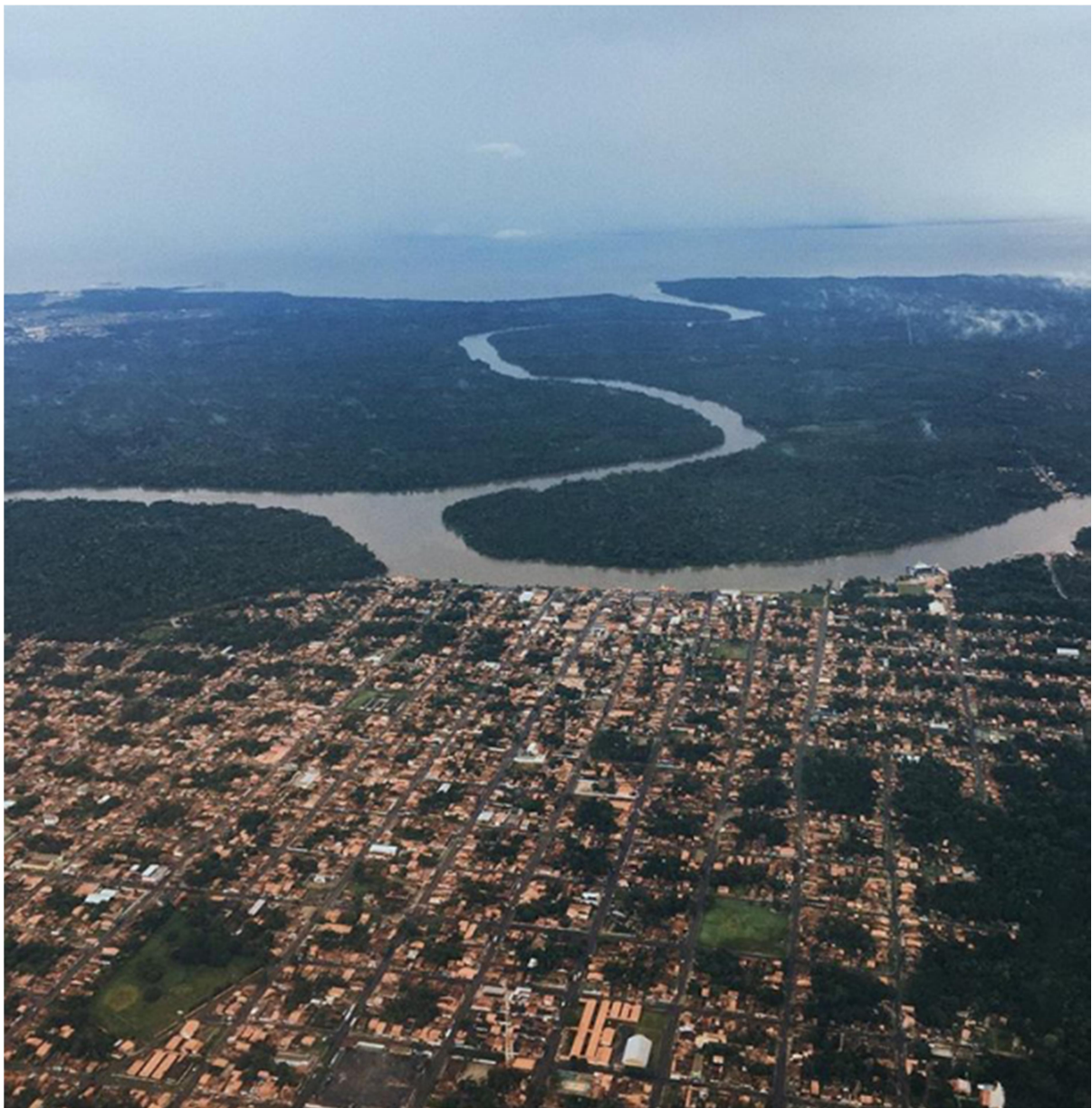
Fig. 2 – Vista atual da cidade empresarial de Barcarena (Pará), com a contraposição entre malha ortogonal e rio sinuoso.

“(...) o desenho urbano imitando a natureza poderia redundar num projeto confuso, de difícil orientação espacial. Passou-se então à investigação do disciplinado e do discreto. O resultado foi um traçado racional, com a forma quadrada pura justificada pela baixa declividade.” (AU, 1987, p.66)