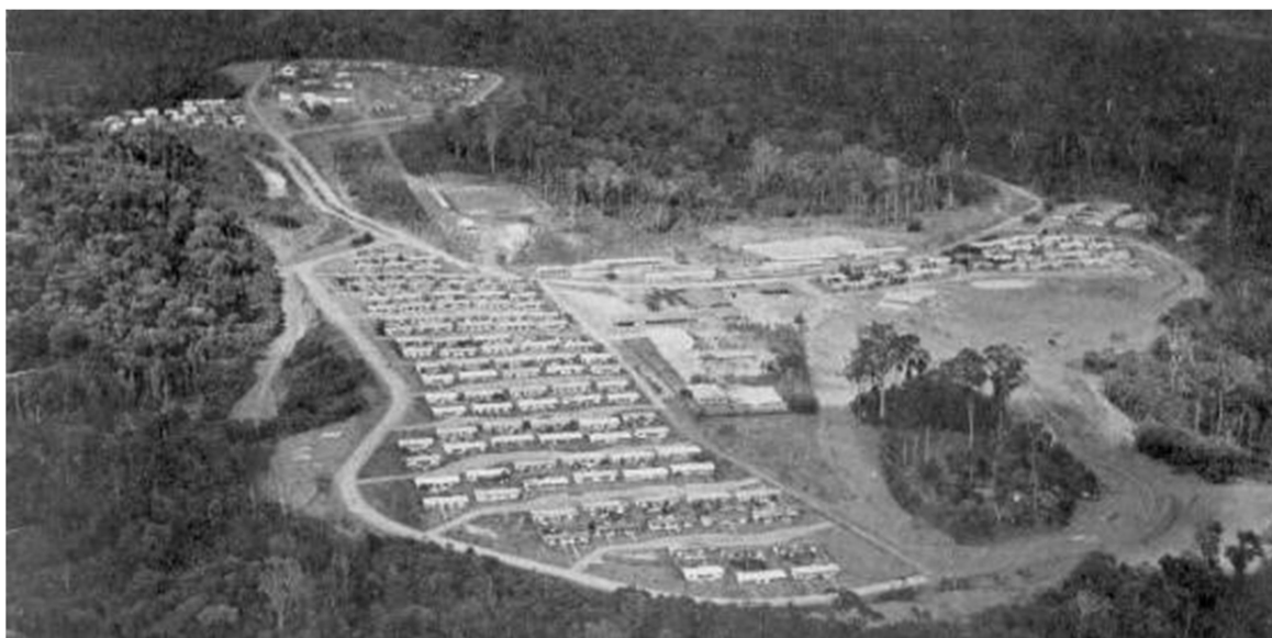
Fig. 7 – Vista aérea de Serra do Navio (Amapá), circundada pela Floresta Amazônica.

Com forte preocupação ecológica e oferecendo condições de qualidade a seus moradores, o plano para Serra do Navio herdou o viés modernista de Bratke, sendo organizado em dois polos interligados por um eixo principal no qual foram dispostos os principais equipamentos da cidade (centro cívico, hotel, hospital, escolas, centro esportivo e clube) (AU, 1987). Um polo foi destinado aos operários (o mais adensado, com moradias para famílias e alojamentos para solteiros) e o outro aos funcionários (com moradias diferenciadas para funcionários de nível médio e de nível superior). O assentamento teve seus limites estabelecidos a uma distância de vinte e cinco metros da floresta para evitar acidentes com a queda de árvores (Fig. 7). Além disso, o plano contava com um “paisagismo exótico”, feito por um jardineiro alemão (SEGAWA; DOURADO, 1997).