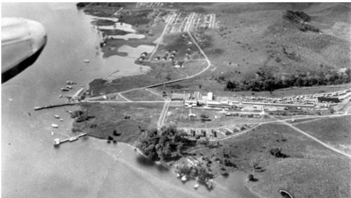
Fig. 3 – Vista aérea do complexo fabril de Fordlândia (Pará).

Em agosto de 1923, uma missão da empresa visitou o Estado do Pará, apresentando ao final laudo favorável ao seu departamento comercial, inclusive graças à maior proximidade geográfica com os EUA, comparado à longínqua Ásia. O parecer atestava a viabilidade da região, forrada pela floresta, para o cultivo de seringueiras. Ademais, inúmeros rios da bacia amazônica desembocam no Oceano Atlântico, o que iria permitir deslocamentos fluviais e marítimos, facilitando a logística de escoamento da produção. Em 1927 é delimitada uma área de cerca de quinze mil quilômetros quadrados para o empreendimento, localizada às margens do rio Tapajós, importante afluente do rio Amazonas, a oitocentos quilômetros de Belém (SENA, 2008), na expectativa de se criar um polo mundial de produção de borracha.