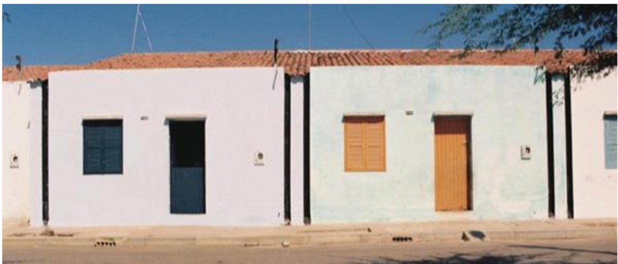
Fig. 11 – Habitações operárias em Caraíba (BA), arquitetura em correspondência ao savoir-faire vernacular local (antigo ou novo?).

Contudo, em um segundo momento as casas foram vendidas a preços simbólicos aos funcionários e, naquele momento, a cidade passou a ficar sujeita a alterações de suas características mais marcantes. Lotes foram divididos, recuos previstos foram invadidos, terrenos com pilotis tomados por construções. As modificações são mais evidentes nas áreas deixadas para livre ocupação, enquanto as edificações que seguiram a proposta original estão mais preservadas.