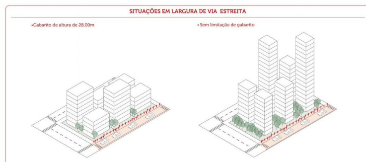
Diagrama 5 - Situações em largura de via estreita. Elaboração: SMUL, 2017