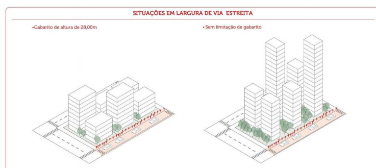
Diagrama 5 - Situações em largura de via estreita. Elaboração: SMUL, 2017