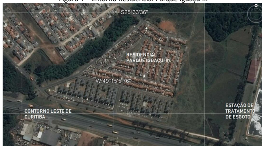
Figura 4 – Entorno Residencial Parque Iguazu III