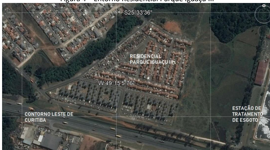
Figura 4 – Entorno Residencial Parque Iguazu III