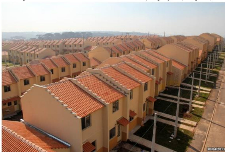
Figura 2 – Casas e sobrados do Residencial Parque Iguazu III (fotografia)

Efetivamente, o reassentamento teve início em setembro de 2013 e além do Residencial Parque Iguazu III (Figura 1), outros nove conjuntos foram construídos para famílias reassentadas e famílias da fila da Cohab-CT, com 2.572 unidades concentradas em 257,5 mil metros quadrados, considerada Setor Especial de Habitação de Interesse Social (SEHIS) pelo zoneamento. O Residencial Parque Iguazu III tem uma ocupação mesclada com famílias da fila (faixa 1) e reassentados de área de risco, ou seja, com renda de zero a R$1600,00 reais.