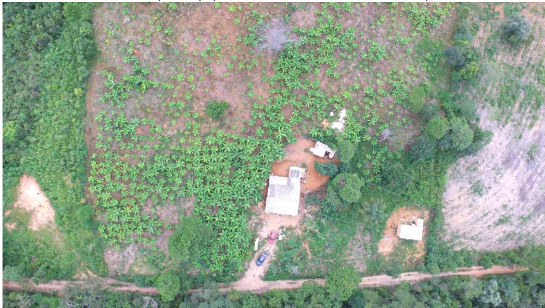
Figura 5 – Levantamento fotográfico aéreo do terreno e produção de um assentado realizado pela equipe com uso da drone Salvadora Daqui 11 .