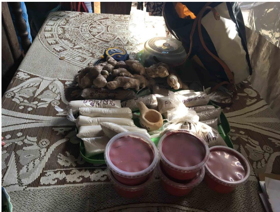
Figura 4 – Cosméticos naturais e temperos são exemplos de produtos produzidos e comercializados pelos assentados.