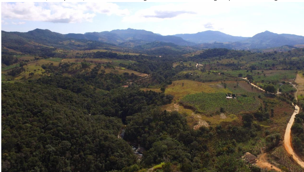
Figura 2 – Vista geral de parte do assentamento: à direita, a estrada de terra principal de acesso aos lotes; à esquerda, área de Reserva Legal e um dos cursos d'água que cortam a região.