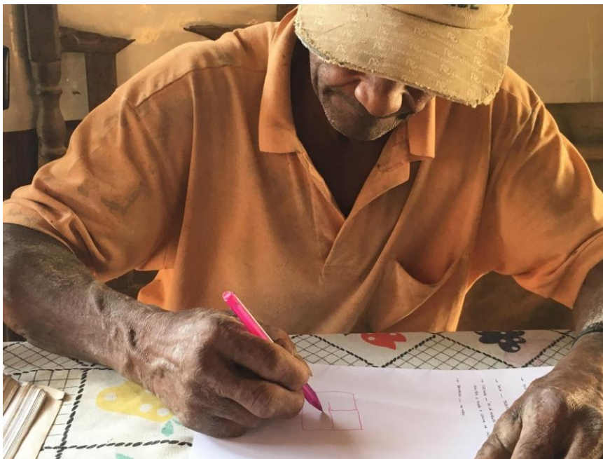
Figura 7 – Morador desenhando sua casa durante o processo de assessoria para elaboração dos projetos.