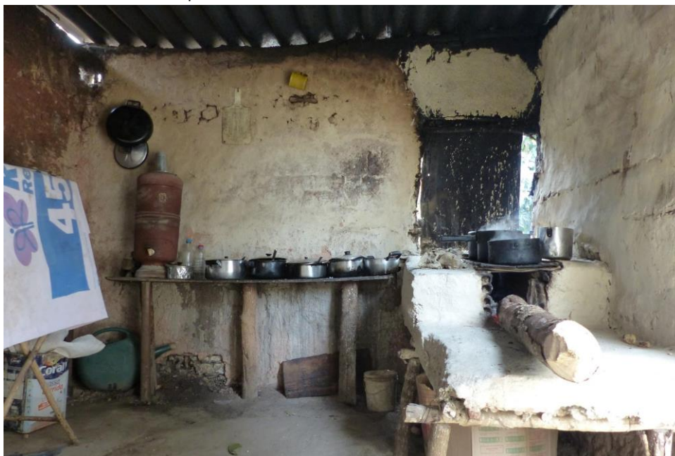
Figura 9 – O uso do fogão à lenha faz parte do costume das famílias e estava presente em todas as casas visitadas.