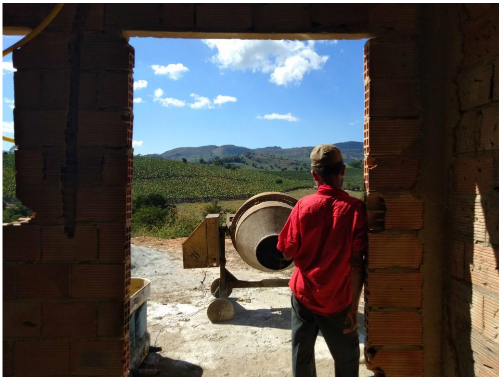
Figura 1 – Com dificuldade de acesso aos recursos e programas governamentais, assentados buscam por conta própria consolidar suas vidas no campo.