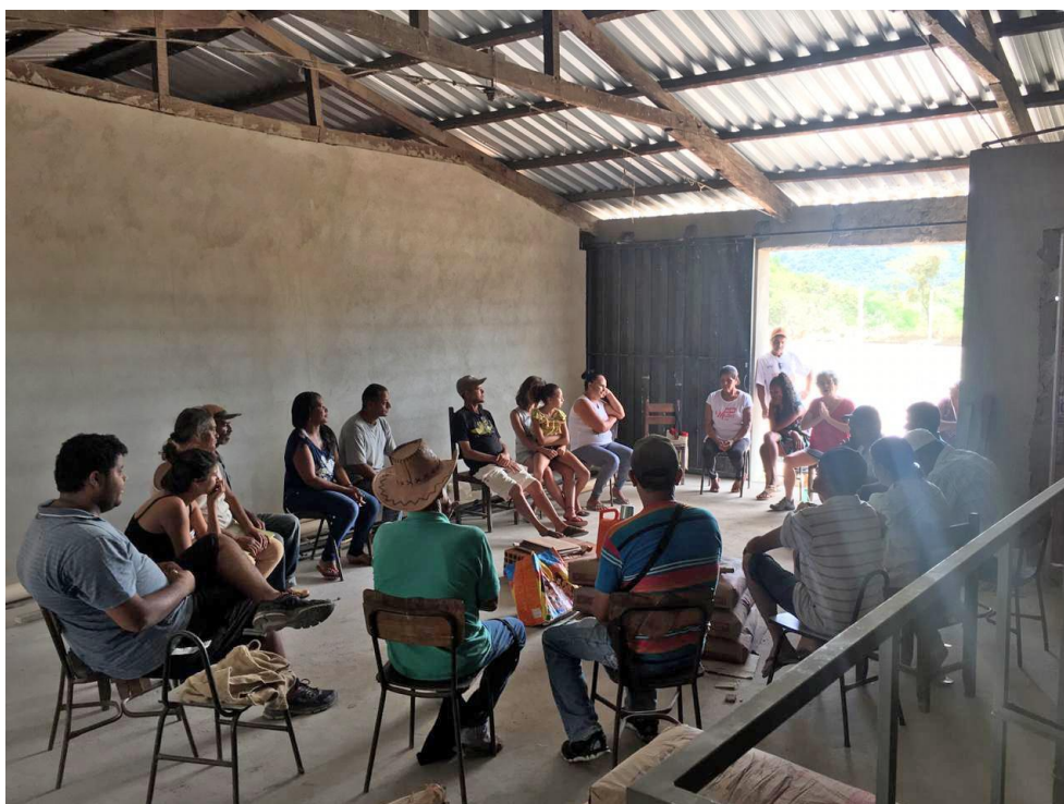
Figura 8 – Reunião para a entrega do material produzido pelos estudantes no Assentamento Ho Chi Minh.