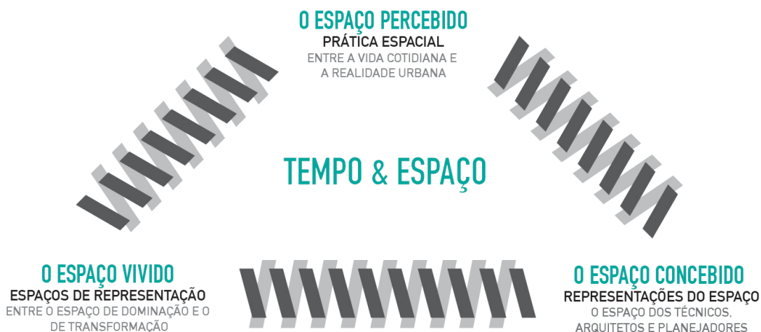
FIGURA 2 – TRÍADE DA PRODUÇÃO DO ESPAÇO BASEADA EM LEFEBVRE ([1974]1991)

A prática espacial (o espaço percebido) é o processo dialético no qual sociedade e espaço se relacionam, por um lado a sociedade propõe o espaço e, por outro, o pressupõe, ou seja, o produz paulatinamente na medida em que o compreende e apropria. Lefebvre ([1974]1991, p. 38) questiona como é a prática social na sociedade neocapitalista. E responde: “a prática espacial é composta por uma associação muito próxima entre o espaço percebido, entre a realidade do dia-a-dia e a realidade urbana (as rotas e redes que conectam os lugares fora do trabalho, do lazer e da vida privada)”. A representação do espaço (o espaço