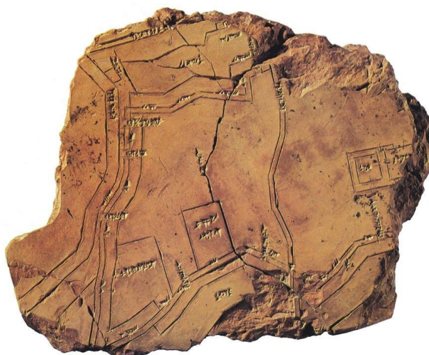
Figura 2 – Tabuleta de argila, Mesopotâmia, fragmento da cidade sumeriana de Nippur.

Fonte: https://www.reddit.com/r/MapPorn/comments/1cy0pu/sumerian_city_of_nippur_the_oldest_known_city_map/