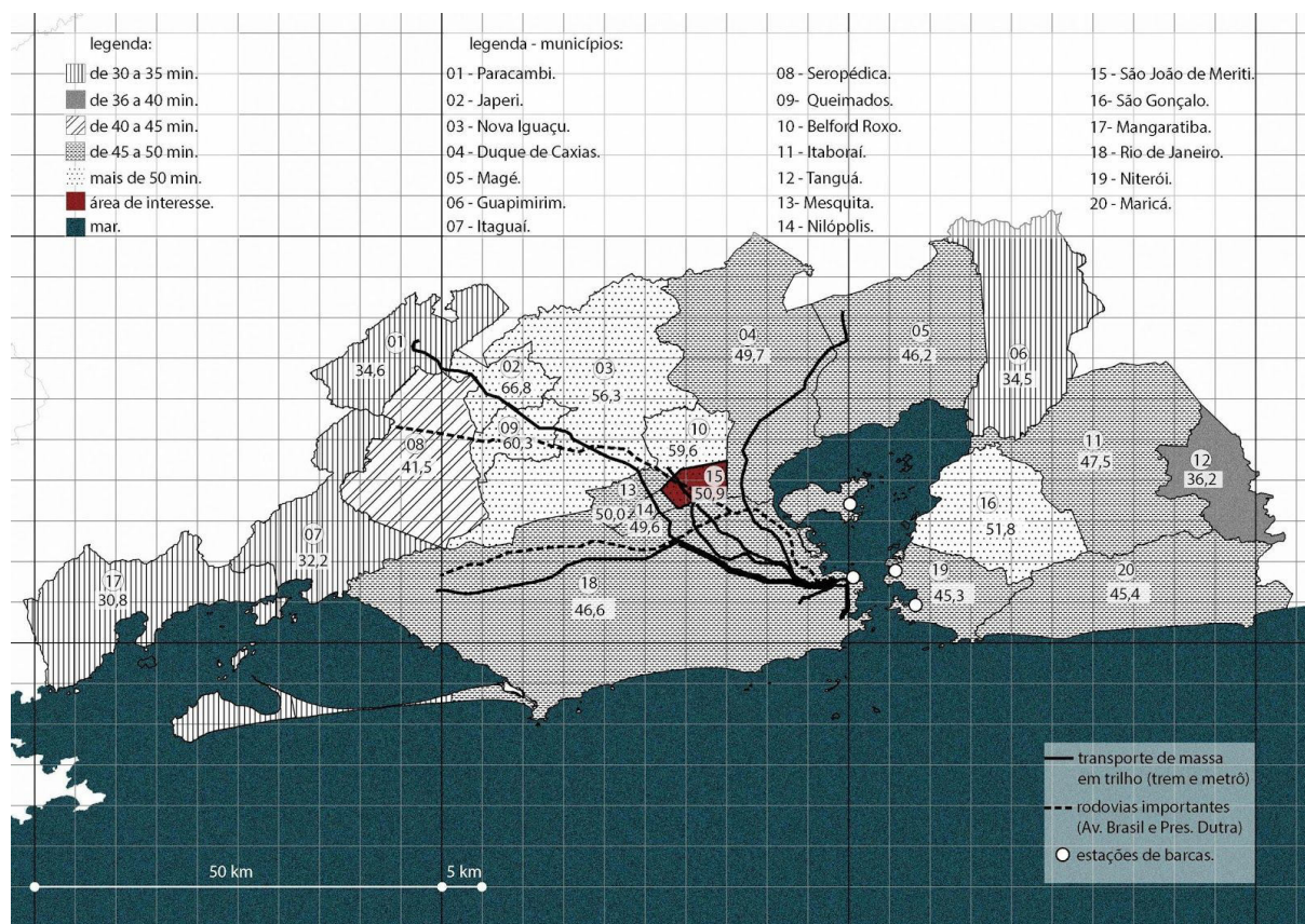
Figura 1: Mapa com o tempo médio de deslocamento nos municípios da Região metropolitana - 2010 (em minutos).

Ao sobrepor no mapa da região metropolitana o tempo de deslocamento e as infraestruturas de transporte (Fig.1), é possível perceber que os municípios da borda mais isolada da região metropolitana apresentam menor tempo de deslocamento (por exemplo, Guapimirim). Isso porque na ausência das grandes infraestruturas de transporte, o trânsito é feito numa escala municipal. Esse trânsito é feito menos num sentido de atravessamento e mais em uma transversalidade, fazendo com que os habitantes resolvam suas carências por serviços, lazer, instituições, etc. – o que demonstra certa independência desses municípios isolados em relação ao domínio das regiões centrais metropolitanas. O oposto pode ser observado na maioria dos municípios da baixada fluminense que fazem fronteira com a cidade do Rio de Janeiro. Nesse caso é possível perceber uma maior concentração das linhas de transporte de massa e para onde essa população é diariamente encaminhada. Configuram, assim, num retrato da manutenção de dependência econômica, cultural e política metropolitana.