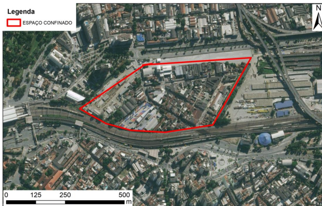
Figura 2 – Mapa do Espaço Confinado.

A rua Ceará é uma rua “principal” com grande fluxo de veículos que foi aberta em 2014, gerando assim mais permeabilidade neste tecido urbano, que conta com mais três ruas locais, dentre elas a Sotero dos Reis (rua da zona de prostituição). Tal configuração urbana mesmo segregando seus agentes, é favorável em termos de segurança e preservação das prostitutas que dizem se sentirem resguardadas em relação às pessoas de “fora”, ou seja, protegidas da cidade.