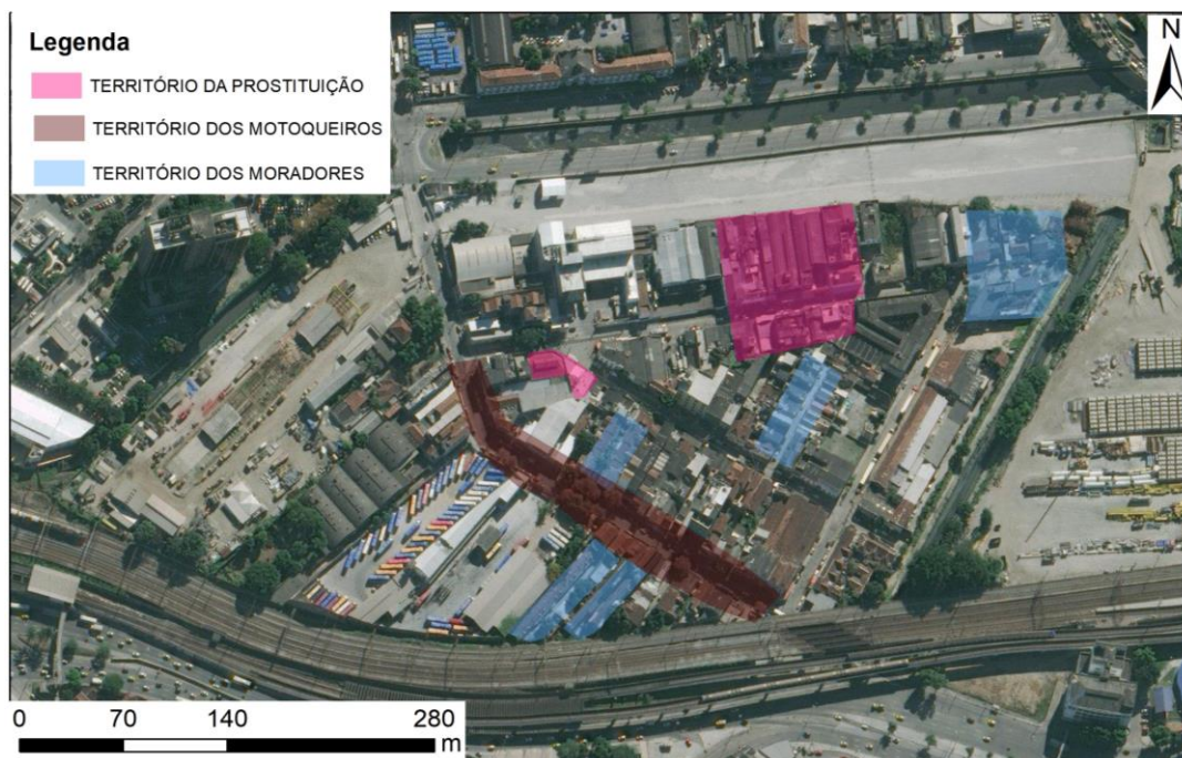
Figura 4 – Mapa de Territórios.

Há alguns espaços subutilizados e deteriorados, alguns com a potencialidade de serem reaproveitados. O maior deles é o terreno da antiga linha de trem da Leopoldina, que não está abandonada, mas sim sem uso. Os demais terrenos são usados como estacionamentos, já os edifícios, alguns estão ocupados como forma de moradia e outros estão totalmente inutilizados, restando apenas as fachadas para o uso de intervenções artísticas como o grafite (Figura 5).