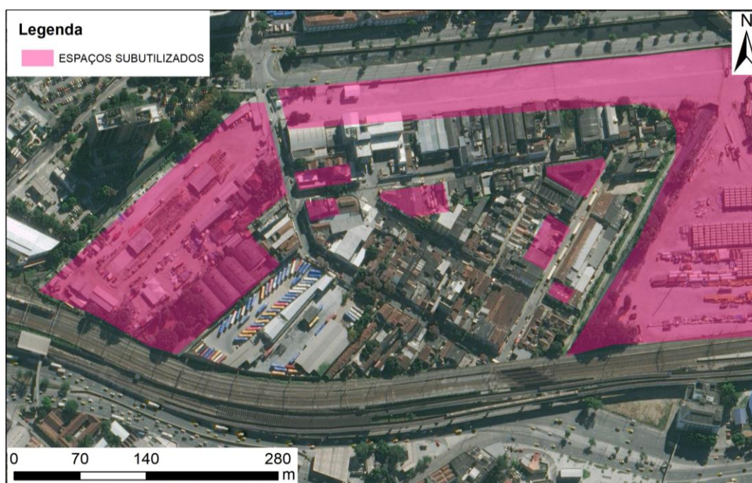
Figura 5 – Mapa de Espaços Subutilizados.

Há alguns espaços subutilizados e deteriorados, alguns com a potencialidade de serem reaproveitados. O maior deles é o terreno da antiga linha de trem da Leopoldina, que não está abandonada, mas sim sem uso. Os demais terrenos são usados como estacionamentos, já os edifícios, alguns estão ocupados como forma de moradia e outros estão totalmente inutilizados, restando apenas as fachadas para o uso de intervenções artísticas como o grafite (Figura 5).