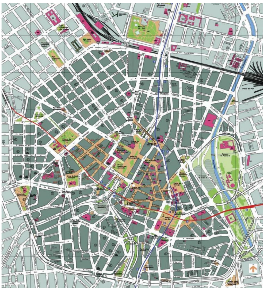
Mapa do centro de São Paulo: intervenções de requalificação Urbana.

Esta etapa consistia do restauro de edifícios (como o da Escola Municipal de Educação Infantil Patrícia Galvão), o alargamento de passeios públicos (junto as Ruas Martins Fontes, Nestor Pestana, Martinho Prado, Gravataí e João Guimarães Rosa), abertura de visuais junto ao acesso do estacionamento (em direção a Rua Rego Freitas) e do Instituto Clemente Ferreira (em direção ao Elevado Costa e Silva), requalificação das calçadas da envolvente através de nova iluminação, paisagismo e pavimentação, recuperação de edifícios e criação de novas circulações (como o caso da Escola de Artes Teatrais e da Rua Nestor Pestana), integração do Instituto Clemente Ferreira. Por fim, a esta segunda etapa somou-se um estudo sobre a situação existente dos cortiços, onde foram lançadas propostas que tinham como objetivo a criação de novas moradias multifamiliares com condições adequadas de habitabilidade, conversão dos cômodos existentes para unidades autônomas quando possível, promovendo, através de uma abordagem em larga escala. (PMSP-EMURB, 2009)