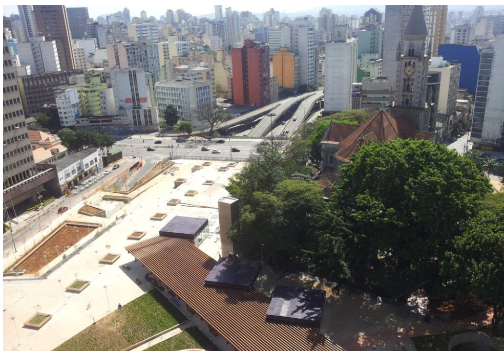
Imagem aérea da Praça Roosevelt após a realização das intervenções. Fonte: Disponível em https://www.borellimerigo.com.br/urbanismo/praca-roosevelt . Acessado em 21/11/2018.

Mapa de localização da Praça Roosevelt e seu entorno imediato. Fonte: Disponível em https://www.borellimerigo.com.br/urbanismo/praca-roosevelt . Acessado em 21/11/2018.