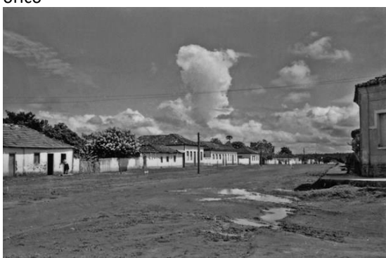
Figura 8: Vista da cidade de Planaltina em 1957.

Segundo o censo de 1950 a população presente da região do futuro Distrito Federal somava um montante de 50.267 pessoas, sendo 7.335 em Planaltina, 19.657 em Luziânia e 23.273 em Formosa. Valor muito parecido com os das maiores cidades do estado na época: Anápolis com o total de 50.338 de população presente e a capital goiana registrando 53.389. Contudo vale ressaltar que a zona de Anápolis, constituída de 9 cidades, dentre elas Luziânia e Pirenópolis, esta com 22.430 de população presente, somava o montante de 159.085 e a Zona de Goiânia 247.924.