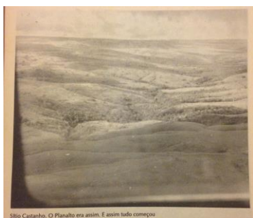
Figura 1: Imagem do Planalto central contida no livro "História de Brasília" de Ernesto Silva, destaca-se a legenda "Sítio Castanho. O Planalto era assim. E assim tudo começou" Fonte: SILVA, 1999:13.

"(...) no dia dois de outubro de 1956, à grande planície vazia, onde só encontramos, como sinal de presença de homem civilizado, um cruzeiro que a Comissão Demarcadora de Fronteiras mandara erguer em sinal de sua passagem. Brasília começou nesse momento a delinear-se em nossos espíritos." (JK, 1960 apud PINTO, 2010:49)