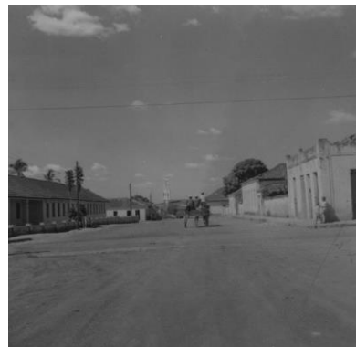
Figura 7: Vista da cidade de Formosa em 1957.