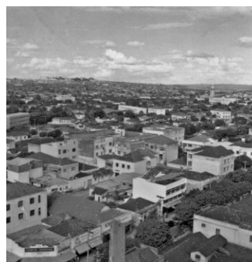
Figura 5: Vista da cidade de Goiânia, inaugurada em 1935, de 1957.