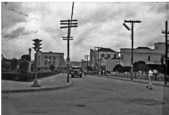
Figura 6: Cidade de Anápolis em 1957.