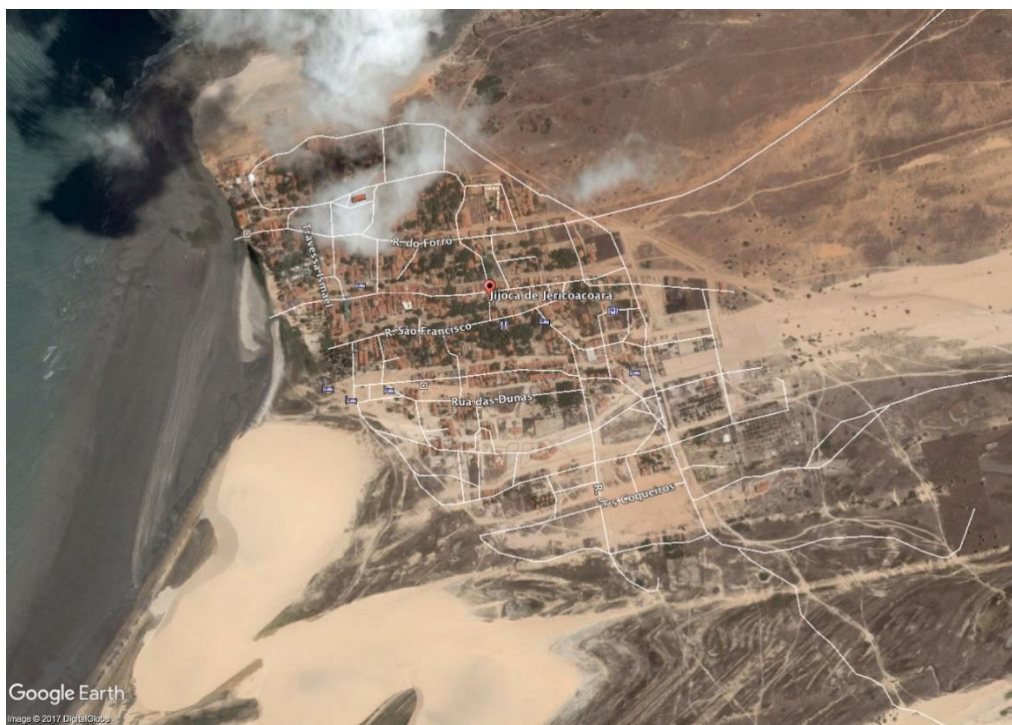
Figura 5 - Imagem de Satélite da Vila de Jericoacoara em 2004