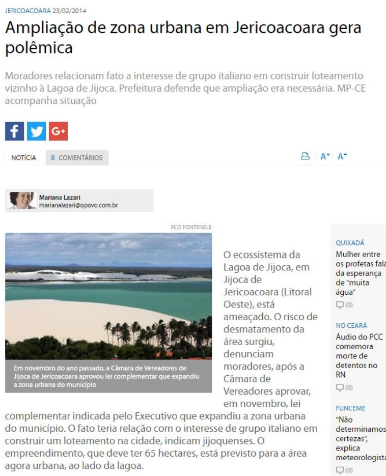
Figura 3 - Matéria do Jornal O Povo sobre Ampliação da Zona Urbana de Jijoca

Fonte: Jornal O Povo de 23 de fevereiro de 2014 24