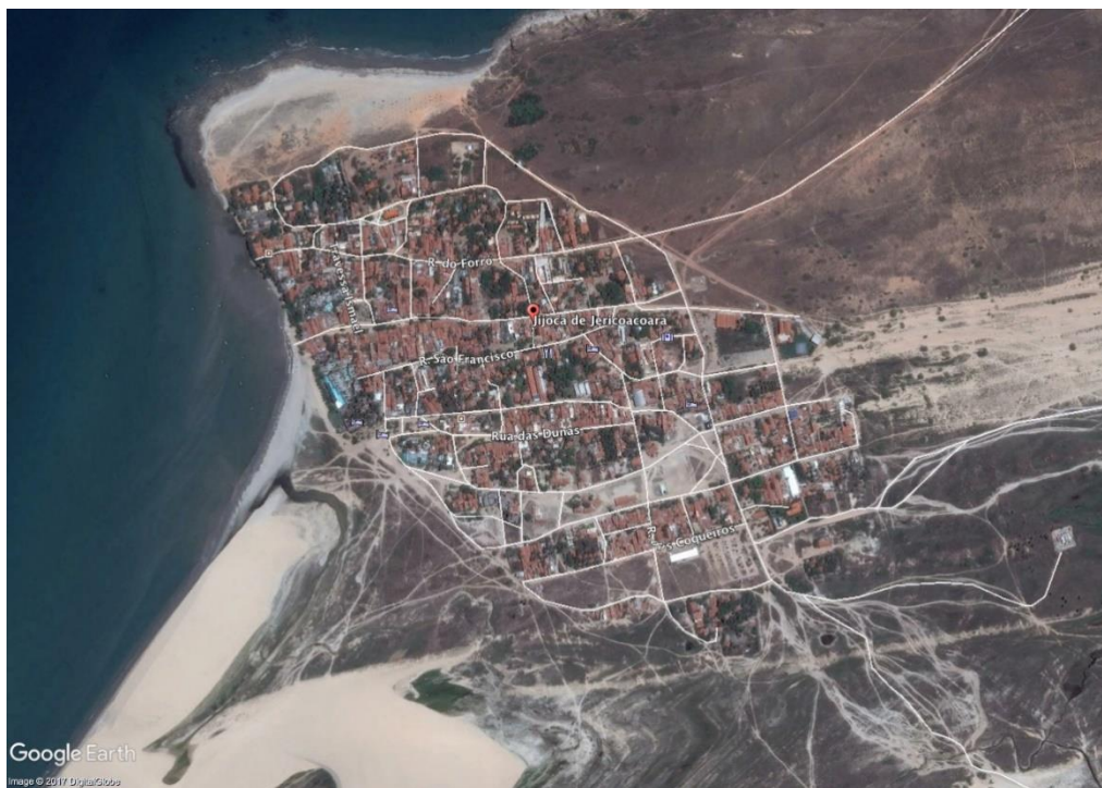
Figura 6 - Imagem de Satélite da Vila de Jericoacoara em 2017