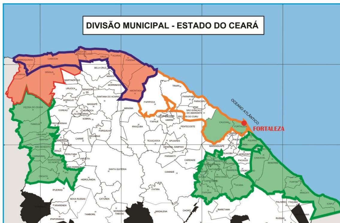
Figura 2 - Especialização de Projetos com Financiamento Multilateral para o Turismo