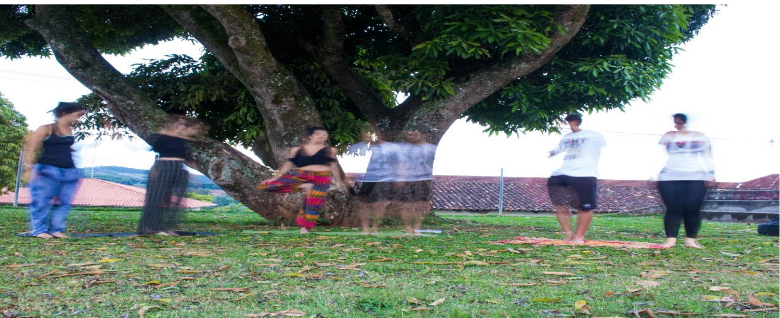
Fig. 3: Foto(poética)grafia.