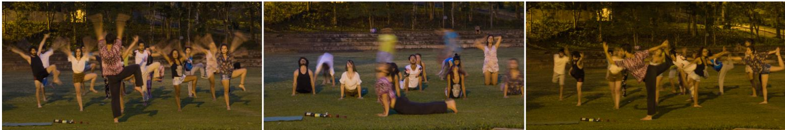
Fig. 2: Compilação de fotografias.

A foto(poética)grafia registra vestígios da imagem-potência numa relação dinâmica, corpoespaçotempo. O olhar humano não registra o movimento da mesma forma como a longa exposição da câmera, registrando vultos corporais como se fosse possível visualizar a essência e a aura. Por meio da iconografia - registro do momento presente, a instantaneidade e a efemeridade - materializa-se o corpoespaçotempo yogin.