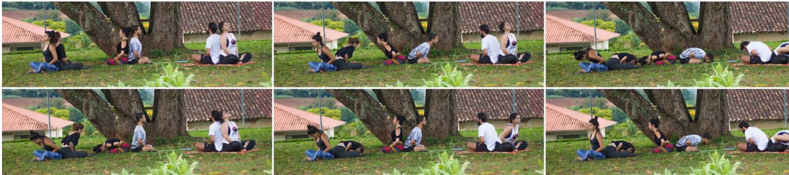
Fig. 1: Compilação de fotografias.

O corpo lento voluntário propicia através de respirações e movimentos realizados com consciência, a apreensão da lentidão do tempo, quase como se fosse possível “parar o tempo”, perceber o espaço pelos sons da natureza, dos pássaros, do vento e o movimento dos insetos.