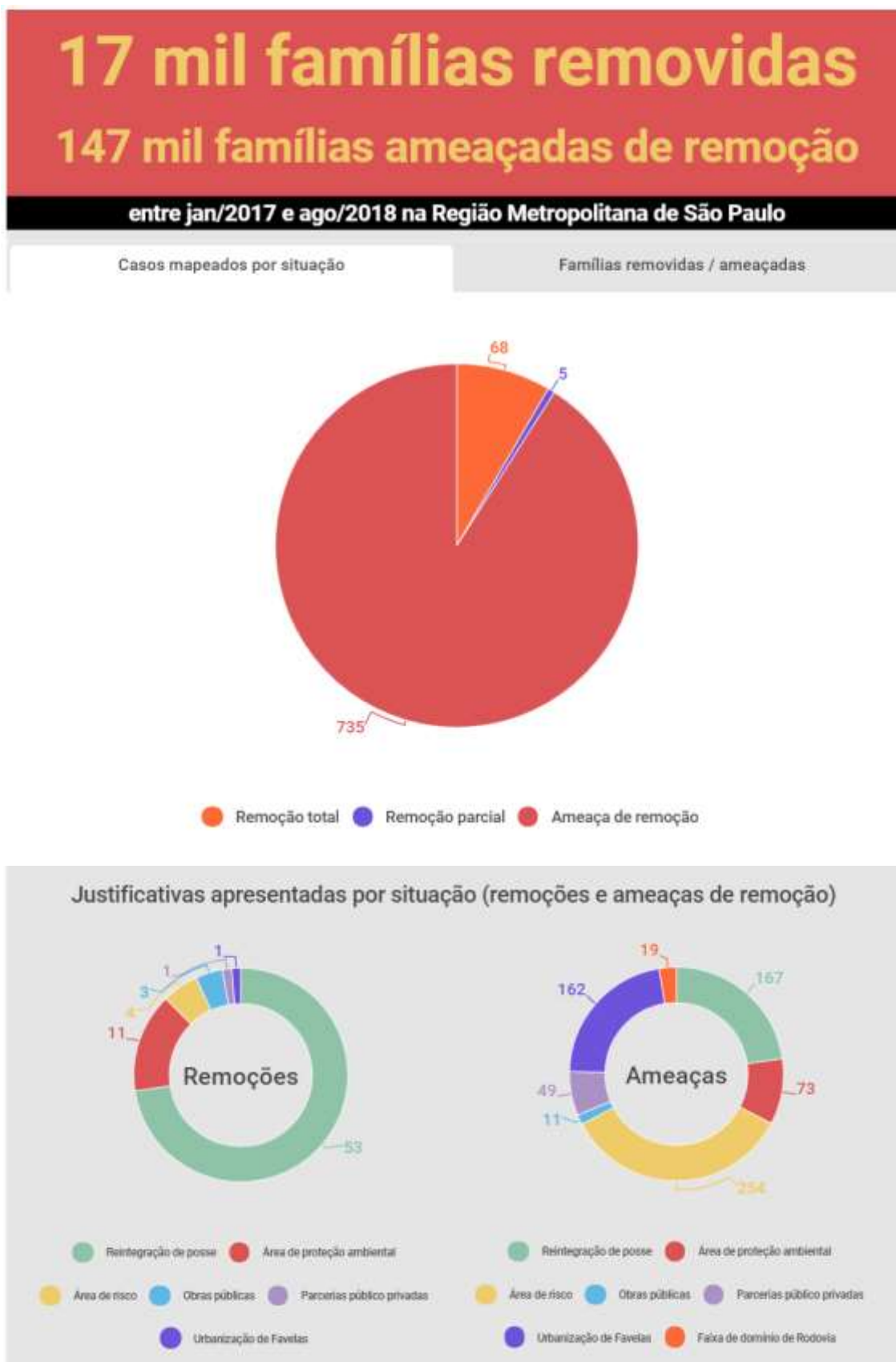
Figura 1. Infográficos do Mapeamento das Remoções (2017-2018)