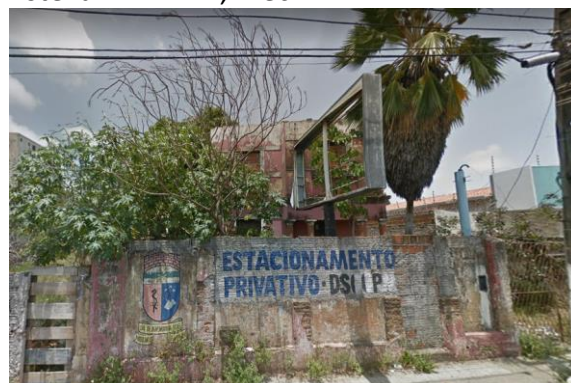
Figura 02 - Prédio BANDERN-Antiga COEPIRN, localizado na Av. Coronel Estevam nº1172, Alecrim.