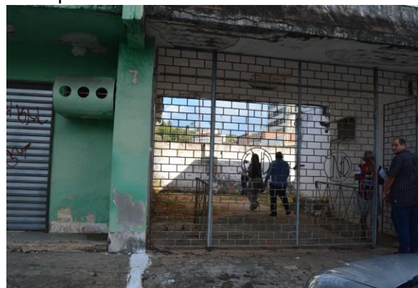
Figura 08 - Estádio Juvenal Lamartine, localizado na Av. Hermes da Fonseca, Petrópolis.