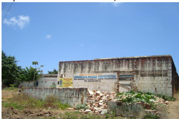
Figura 03 - Associação de Empreendedores Sociais – SEMEAR, localizada na Rua Napoleão Laureano nº 3380, Bom Pastor.