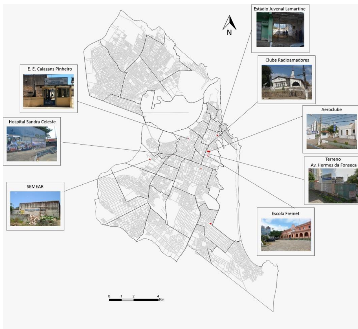
Mapa 01 – Alguns imóveis cedidos e passíveis de alienação localizados em Natal.

Vale ressaltar, contudo, que parte deste patrimônio não está suscetível à alienação, uma vez que compõe o Fundo Garantidor do Arena das Dunas (Lei nº 9.395/2010), e outros penhorados em ações trabalhistas. Dez dos maiores foram dados como garantia pelo Estado para avaliar o empréstimo da construtora OAS com o BNDES para construção do Estádio Arena das Dunas, tais como o parque Aristófares Fernandes e o próprio Aeroclube. Como exemplo, o Mapa 01 ilustra alguns imóveis públicos que estão sendo objeto dessa avaliação para análise de possível alienação.