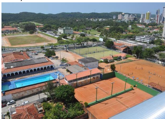
Figura 07 – Aero Clube – Natal, localizado na Av. Hermes da Fonseca n° 1296, Tirol.

estado tem que reaver a posse, retomando um patrimônio que foi cedido em determinado contexto histórico, mas que não conta com a atualização da respectiva legislação. Sobre o critério para a concessão, a legislação destaca que deve ser preservado o interesse público, devendo este ser dimensionado ao momento histórico da permissão.