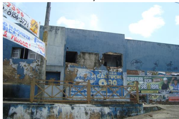
Figura 04 - Antigo Hospital Sandra Celeste, localizado na Av. Bernardo Vieira nº 1320/ Av. Coronel Estevam S/N.