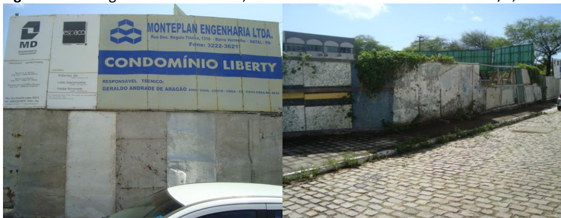
Figura 09 – Antigo Centro de Velório, localizado na Av. Hermes da Fonseca s/n, Tirol