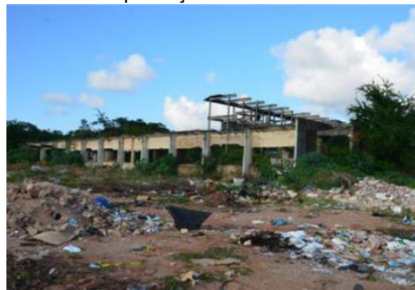
Figura 06 - Hospital Terciário de Natal, localizado na Av. Capitão Mor Gouveia S/N Cidade da Esperança.