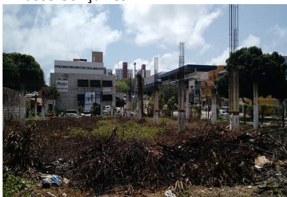
Figura 01 - Antigo Prédio da CIDA, localizado na Av. Antônio Basílio nº 1281 / Dr. José Gonçalves.

Observando o quantitativo de imóveis identificados como “desativado”, “desocupado”, “obsoleto”, “ocioso” e “vago sem destinação”, verifica-se um total de 98 terrenos e imóveis, distribuídos em 33 municípios, sendo a maioria (31 imóveis) localizada no município de Natal. A seguir apresenta-se figuras de parte deste patrimônio que se encontra subutilizada e sem cumprir a sua função social.