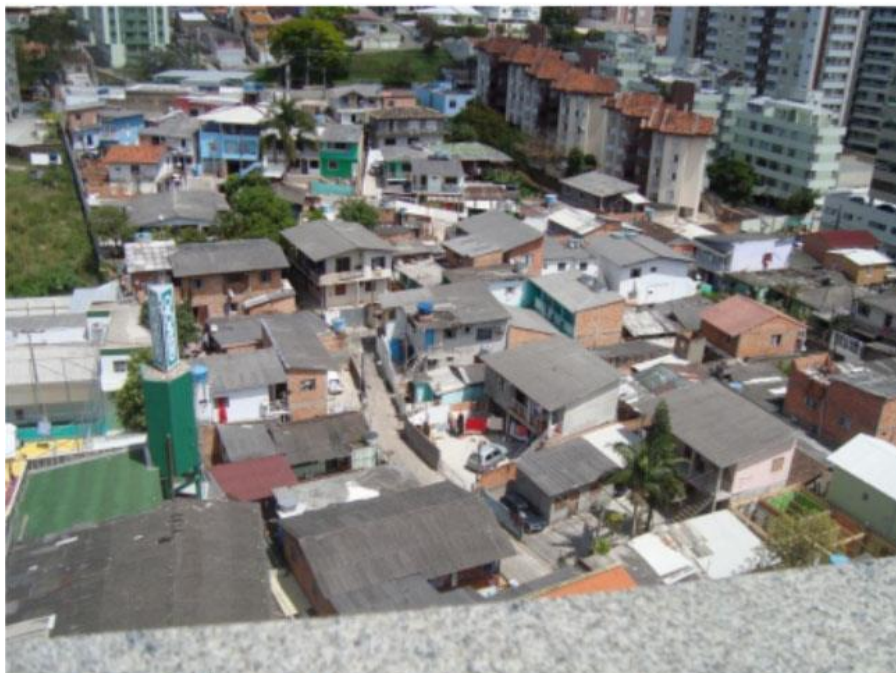
Figura 5- Vista Vila Santa Rosa