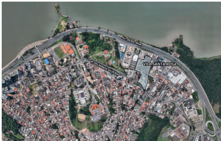
Figura 3 - Localização do assentamento Vila Santa Rosa.