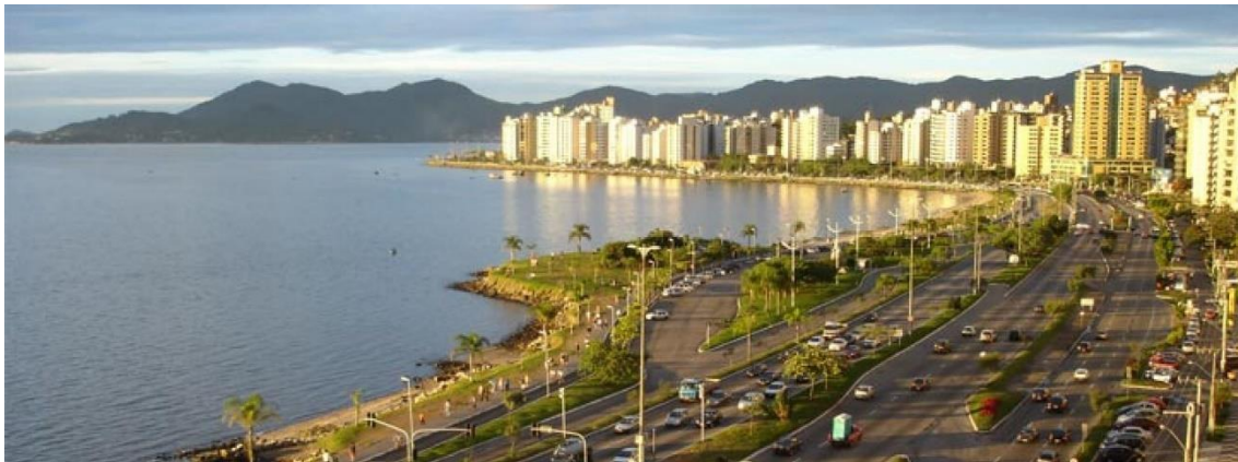
Figura 4- Avenida Beira Mar, Florianópolis