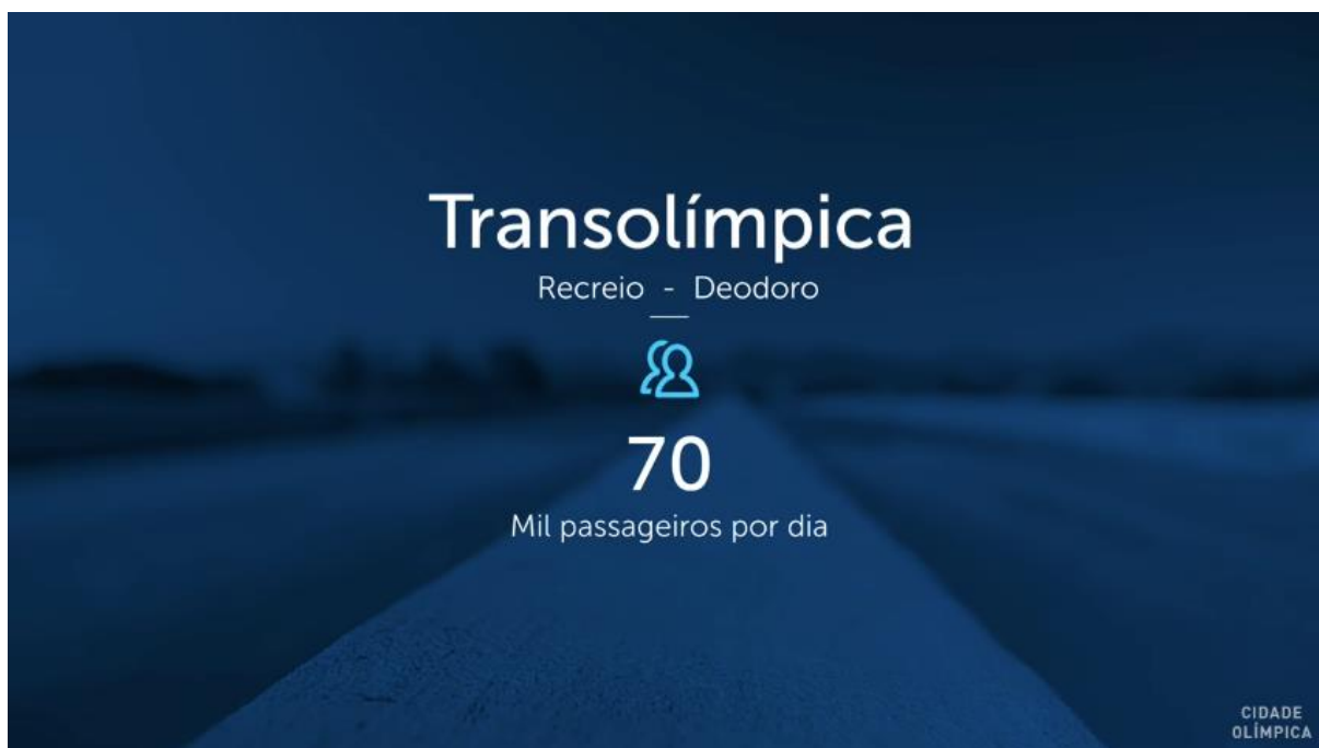
Figura 3 - RioCidadeOlimpica, 2016, em Youtube

Por fim, o material de divulgação do governo exalta a implantação de saneamento na zona oeste com a construção de 200 km de rede coletora de esgoto, de 1 estação de tratamento e a construção/modernização de 7 estações elevatórias, as quais beneficiaram os bairros Deodoro, Vila Militar, Magalhães Bastos, Realengo, Padre Miguel, Bangu e Senador Camará (RIOCIDADEOLIMPICA, 2015a).