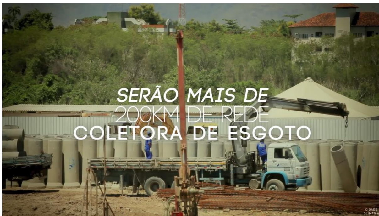
Figura 4 - RioCidadeOlimpica, 2015a, em Youtube

Por fim, o material de divulgação do governo exalta a implantação de saneamento na zona oeste com a construção de 200 km de rede coletora de esgoto, de 1 estação de tratamento e a construção/modernização de 7 estações elevatórias, as quais beneficiaram os bairros Deodoro, Vila Militar, Magalhães Bastos, Realengo, Padre Miguel, Bangu e Senador Camará (RIOCIDADEOLIMPICA, 2015a).