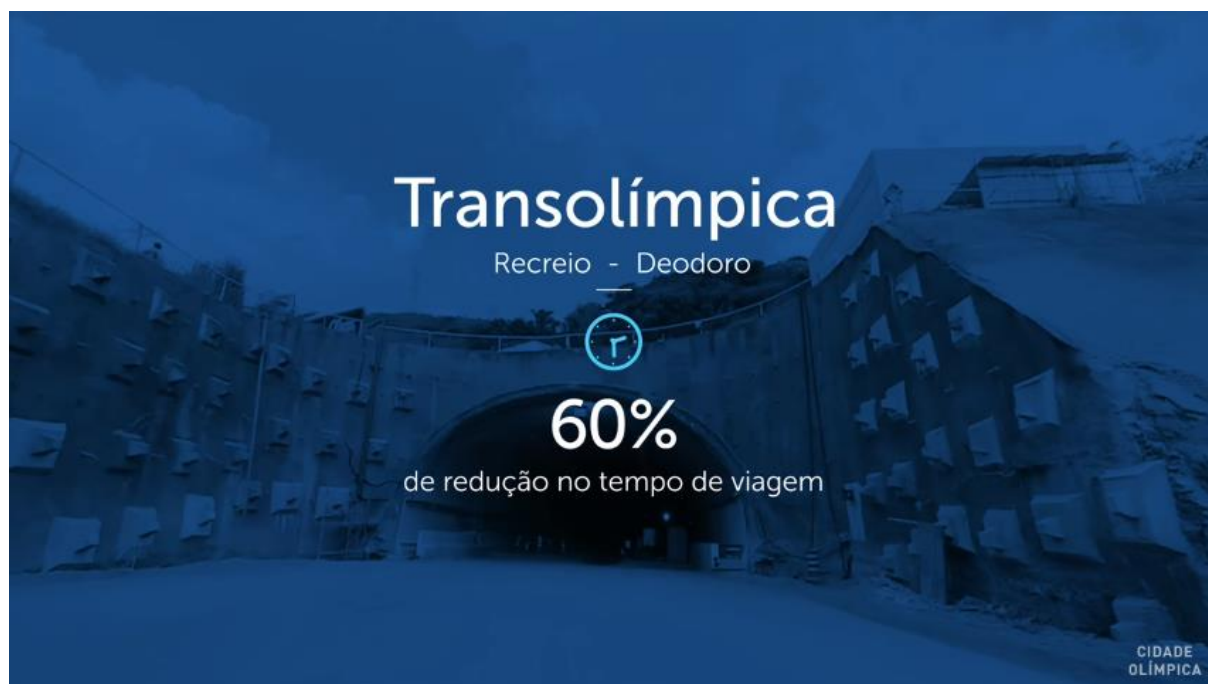
Figura 2 - RioCidadeOlimpica, 2016, em Youtube

A mobilidade urbana é também outro assunto muito abordado nos materiais de divulgação com relação ao legado dos jogos Olímpicos em Deodoro. A implantação do sistema BRT é tratado como o modal que facilita e agiliza a vida do carioca. A linha Transolímpica é apresentada como “a linha que reduziu 60% do tempo das viagens entre a Vila Militar e o Recreio dos Bandeirantes”. (RIOCIDADEOLIMPICA, 2016).