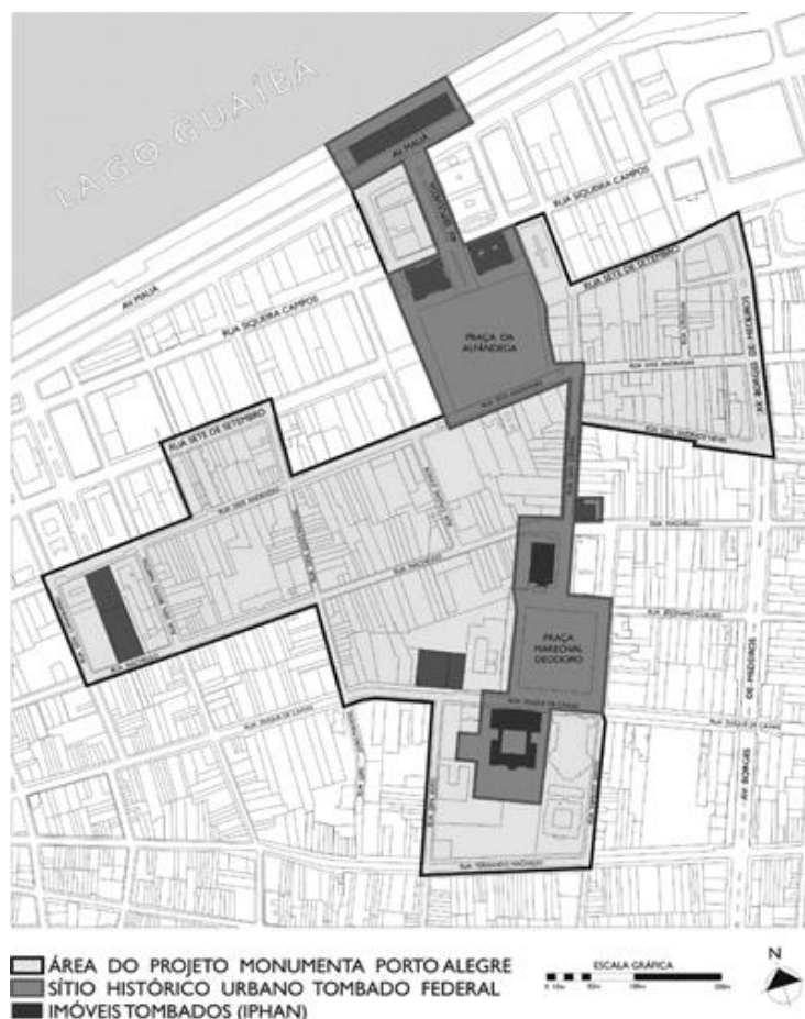
Figura 3. Área do Projeto Monumenta.

O próprio IPHAN na descrição da área escolhida pelo programa ressalta muitos pontos que já foram citados e mostrados no trabalho como pontos importantes no percurso de Naziazeno, comprovando o quanto o centro está presente no imaginário social e na consciência de patrimônio do habitante da capital gaúcha: