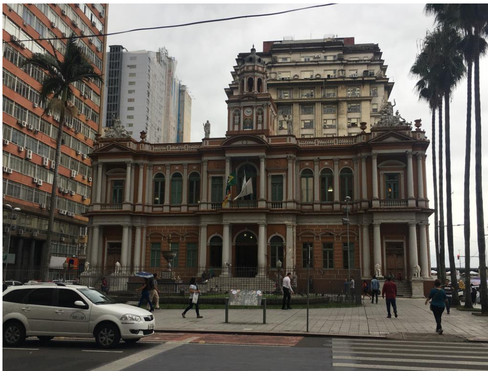
Figura 2. Prefeitura de Porto Alegre.

povo gaúcho pela monumentalidade. A edificação nos anos de 1927 a 1947 abrigava em suas salas térreas a Contadoria-Geral do Município, Receita Municipal, Tesouraria e Procuradoria, porém com o aumento da população e a especialização dos serviços da prefeitura esses espaços acabaram sendo transferidos para outros prédios.