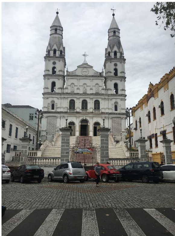
Figura 1. Igreja das Dores.

Da mesma forma como os percursos até a repartição eram balizados pela luzinha da Igreja das Dores, este ponto de referência pode descrever o deslocamento no sentido leste-oeste do personagem. Quanto aos retornos ao centro, estes tinham como foco principal o relógio da Prefeitura.