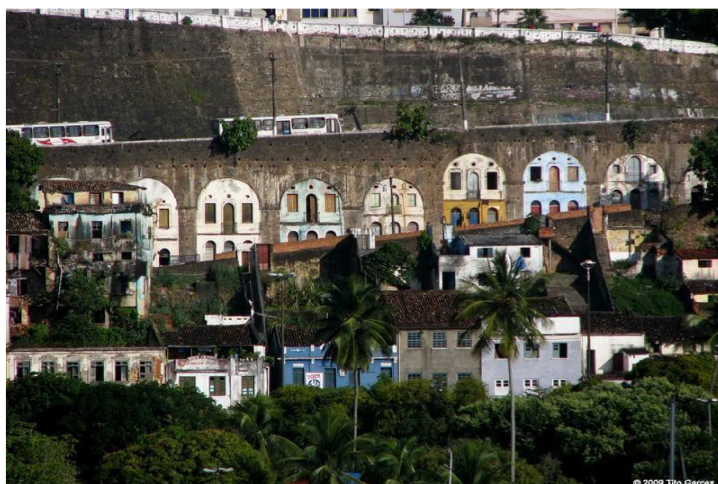
Figuras 5 e 6: Ladeira da Conceição da Praia – arcos e artífices

sentido de espetáculo. Ao mesmo tempo que a lógica da conservação patrimonial o eterniza no skyline da cidade, ele é atravessado pelas transformações cotidianas reveladas pelas práticas invisibilizadas, mas que pulsam no próprio fazer da cidade: vivências sociais, agentes, resistências e acontecimentos, como o trabalho desenvolvido pelos artífices nos arcos da Ladeira da Conceição da Praia, vista em fotografias recentemente capturadas (Fig. 5 e 6)