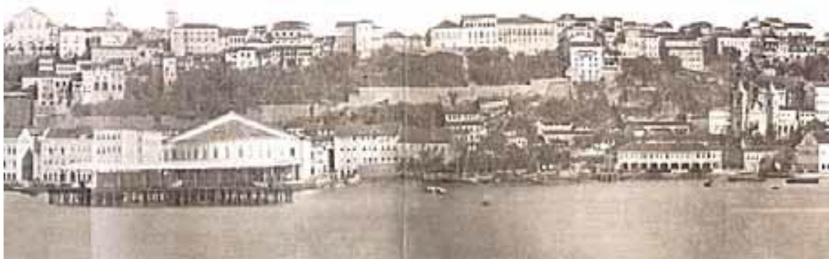
Figura 3: Vista da Cidade de Salvador – fotografia, 1860