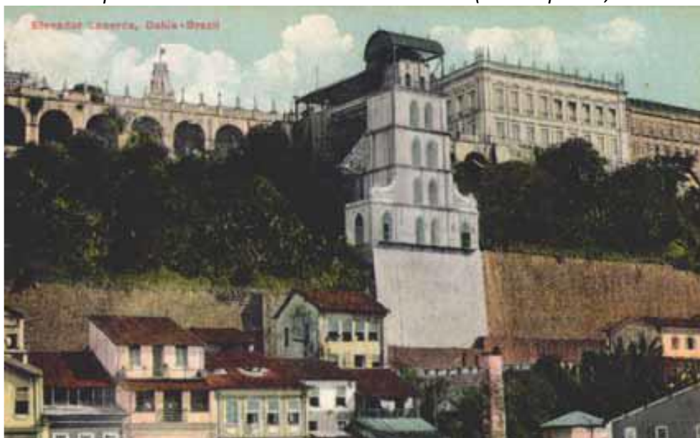
Figura 4: Vista panorâmica da Baía de Todos os Santos (cartão-postal, anos de 1900)