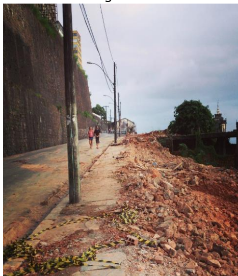
Figuras 7 e 8: Ladeira da Montanha – após a demolição de 2015

Percebe-se que algumas ações pretendem criar cenários históricos de um patrimônio mundial para o turismo, sobre resíduos de um patrimônio urbano e arquitetônico em decadência física e socioeconômica (Fig. 7 e 8), ampliando a dependência de um modelo de intervenção que tem contribuído para a descaracterização da sua constituição histórica, com estetização de vias, passeios e cenários. Em suma, aniquila-se a vida, a dinâmica urbana nessas localidades; uma perda irreparável provocada primeiro pelo abandono e descaso e, posteriormente, pela espetacularização dos espaços, principalmente quando se tratam de espaços historicamente significantes. Essa plástica citadina acaba por impor uma feição pretensamente moderna, contemporânea e atemporal, mas que se revela disforme, inarmônica e fictícia.