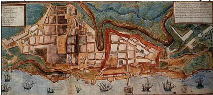
Figura 1: Pranta, da Cidade D. Salvador/ Na Bahia de Todos os Santos (cartografia manuscrita)

Oferecido pela geografia, conforme cita Simas Filho (1982; 1998), o frontispício natural que divide a cidade em dois níveis denominados Cidade Alta e Cidade Baixa, foi amplamente explorado pela sua representatividade, desde os primeiros mapas cartográficos da cidade de Salvador. Na Figura 1, observa-se a mais antiga iconografia da cidade, no atlas do Livro que Dá Razão ao Estado do Brazil . Segundo Santos (2001) e Câmara (1989), esta teria sido a primeira “cartografia original de Salvador”, utilizada como ponto de partida para demonstrar a evolução física do espaço.