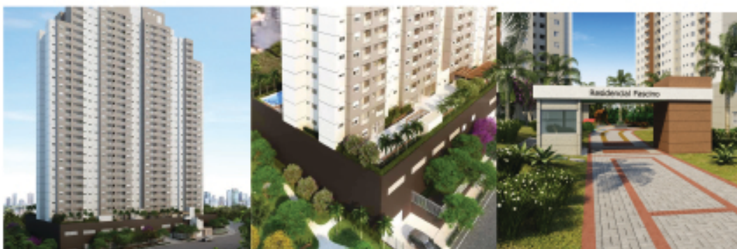
Via Araucária - Jd. Umarizal