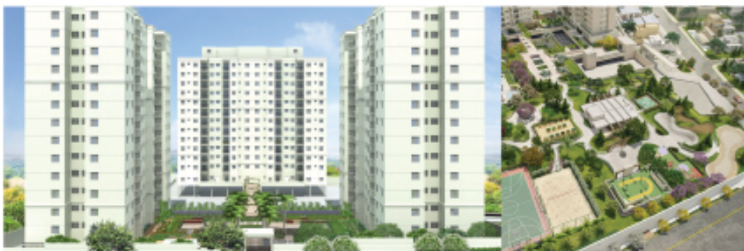
Fatto - Diadema