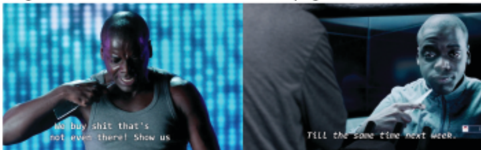
O ponto de ruptura emocional do protagonista, e sua repetição em um programa semanal.