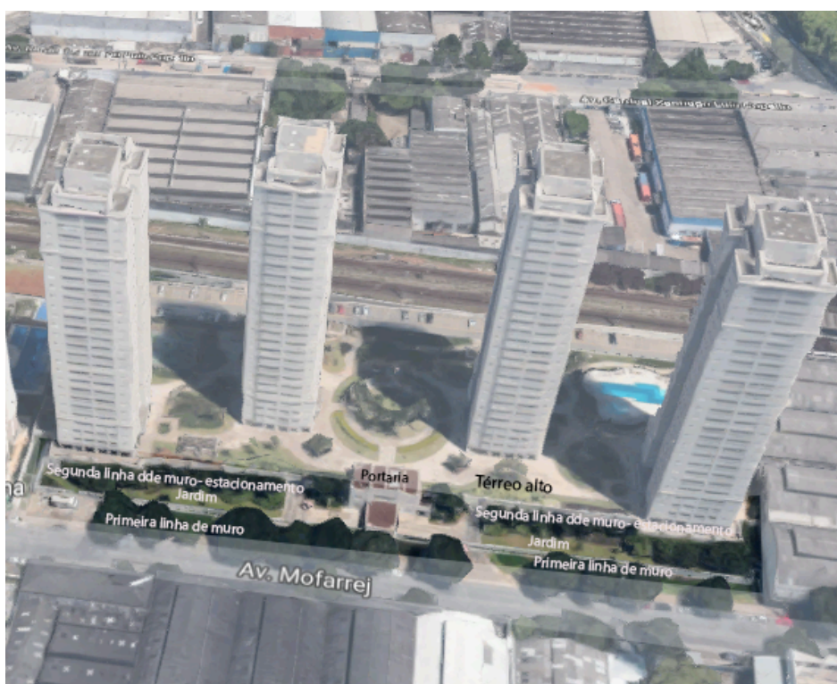
Figura 03- Térreo dos empreendimentos década de 10.

Todos os grandes enclaves flutuam: o nível térreo indicado nos elevadores é na realidade o primeiro ou segundo pavimento onde se encontram as áreas comuns. O térreo verdadeiro é composto por linhas paralelas de muros com vazio entre eles; no máximo duas entradas: uma destinada aos moradores que chegam de carro e outras aos visitantes que passam por sistema de engaiolamento (dois portões acionados em tempos diferentes). A figura a seguir mostra a demarcação entre a rua e o térreo alto do condomínio Living Club Refuge, empreendimento de 2008 na avenida Mofarrej, que ocupa uma área de 16.000 m 2 .