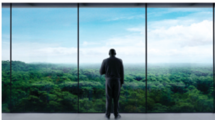
O prêmio pela ascensão social é ver a paisagem