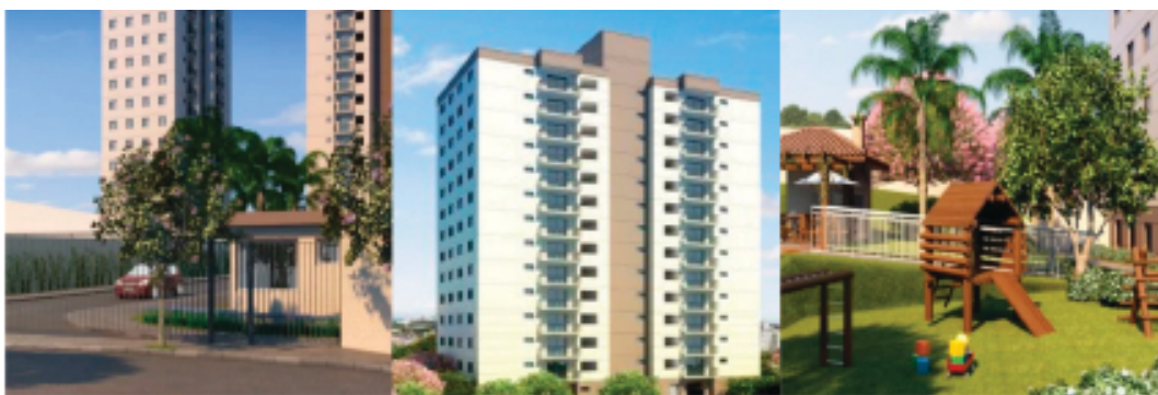
Space Residence - Campo Limpo