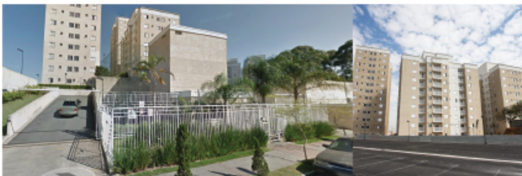
Residencial Panorama I - Cidade Líder