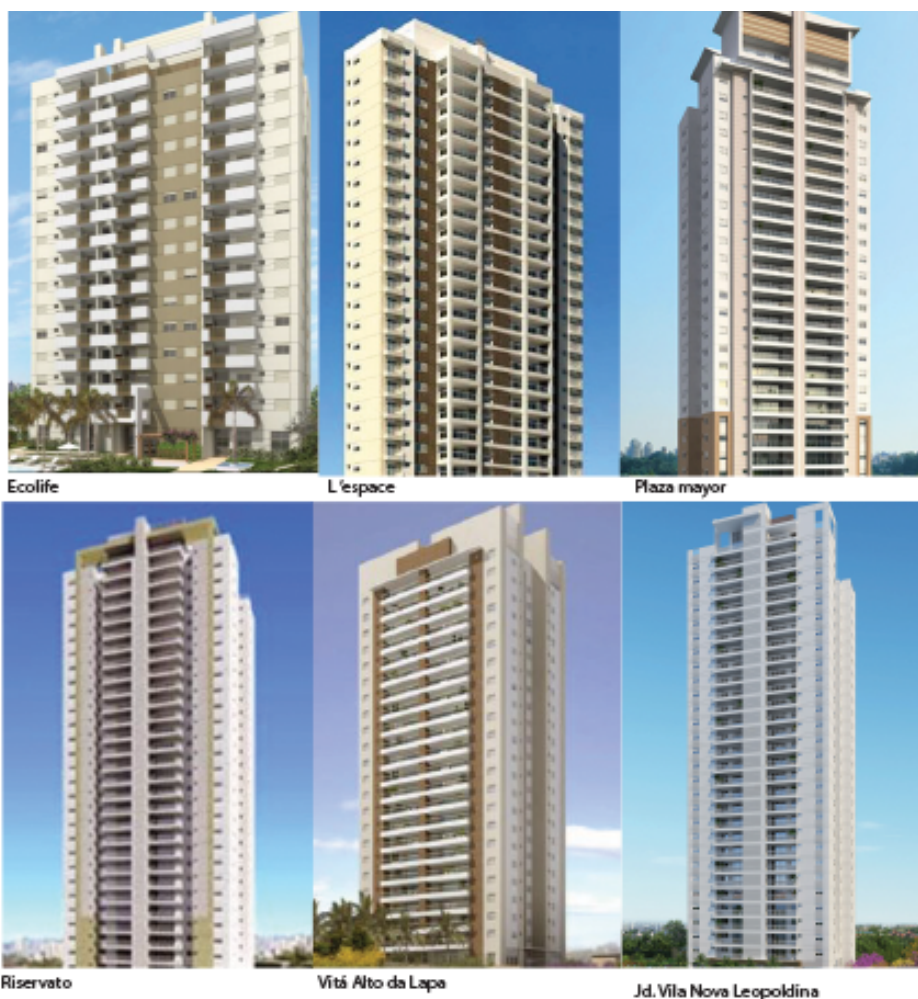
Figura 04- Ilustrações das fachadas dos empreendimentos. .

A sua relação com entorno é a da paisagem. As ilustrações publicitárias mostram edifícios altos implantados em lugares genéricos; os equipamentos são ilustrações descontextualizadas. O importante é a paisagem, a vista distante; a separação do solo, onde a realidade acontece.