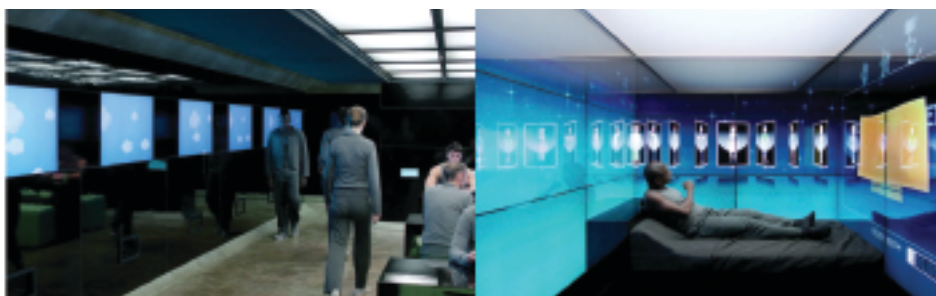
O trabalho e a casa no mesmo ambiente padronizado e controlado através da tecnologia.