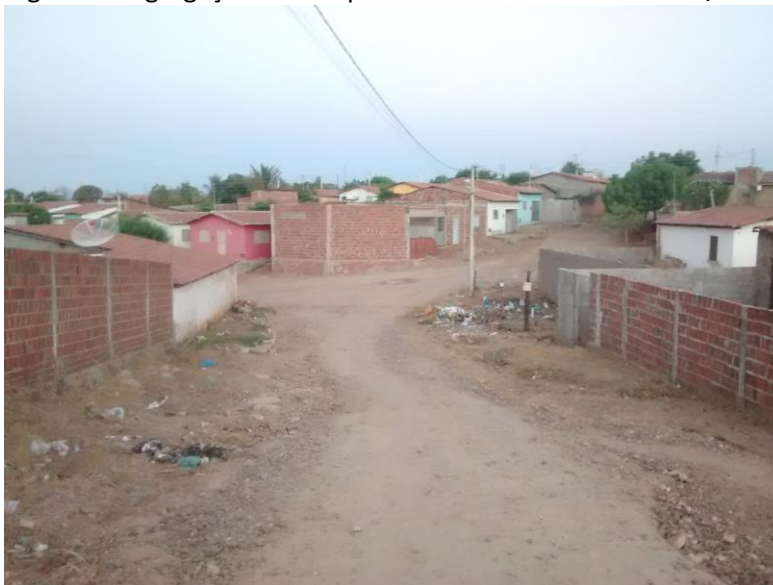
Figura 4: Segregação socioespacial em Pau dos Ferros – RN/Brasil

Desse modo, é possível afirmar que, enquanto esses investimentos como os comerciais e institucionais se concentram em áreas como essas, outras ficam as margens desses investimentos, como o caso do Conjunto Manoel Deodato, configurando-se numa área segregada socioeconomicamente. Assim como na maioria das cidades brasileiras o crescimento da população e da urbanização como consequência são acompanhadas com problemas referentes à habitação, infraestrutura urbana insuficiente. E em Pau dos Ferros, é o Conjunto Manoel Deodato, o maior reflexo dessas desigualdades, embora se perceba investimentos básicos nos últimos sete anos. Muitas ruas ainda se encontram sem pavimentação e a sua paisagem evidencia uma degradação visual latente marcada por esgotos a céu aberto e lixos espalhados pelos logradouros, Figura 4.