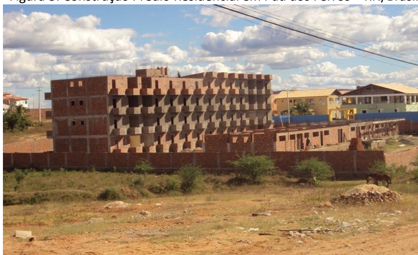
Figura 3: Construção Prédio Residencial em Pau dos Ferros – RN/Brasil