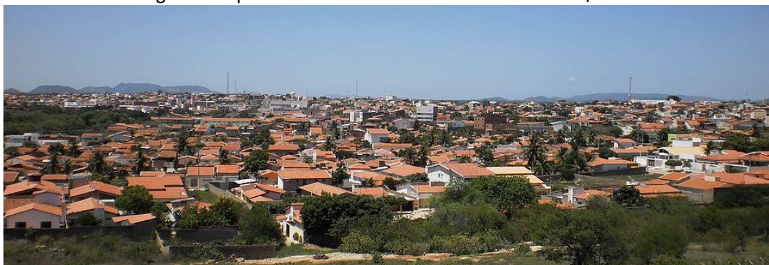
Figura 2: Expansão imobiliária em Pau dos Ferros – RN/Brasil