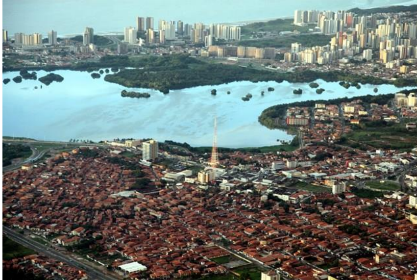
Figura 2: Expansão urbana em São Luís, MA.