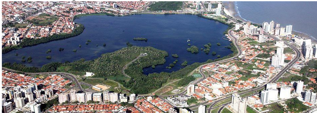
Figura 3: Vista da Lagoa da Jansen em São Luís, MA.