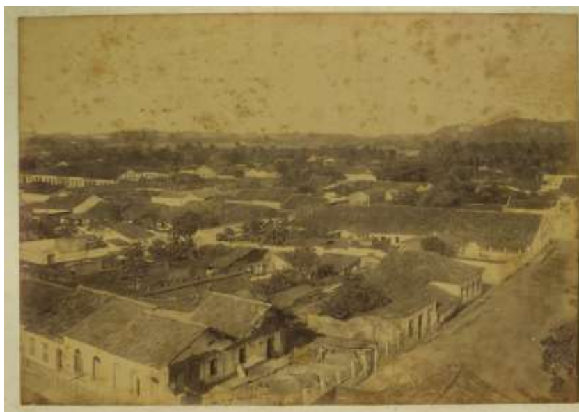
Figura 06 – Cidade Alta, 1904. Ao fundo, vê-se as dunas que circundam a capital, o “Perigo Iminente”, de Manoel Dantas.

Antes de iniciar a apresentação de um novo tempo, convida a plateia a se encontrarem num lugar denominado “Perigo Iminente” (Figura 06). O “Perigo Iminente”, dramatizado e metaforizado, coloca para os ouvintes uma imagem que lhes era familiar e que havia sido construída historicamente: tratava-se das dunas circunvizinhas ao bairro símbolo do moderno, o Cidade Nova, cujas condições de implantação e prescrições urbanísticas foram estabelecidas pela Resolução nº 55 de 30 de dezembro de 1901.