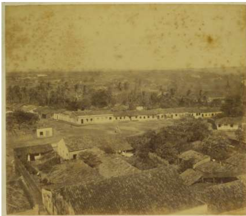
Figura 03 – Natal, 1904. A imagem coaduna com as palavras de Feitosa: “vila pacata de interior”.

Tratava-se do discurso representativo de parcela privilegiada da sociedade potiguar, insatisfeita com as feições urbanas da cidade naquele período (Figura 03). Nela, veem-se as “indesejáveis” casas de aparência colonial, além das “ruas impossíveis” e sem calçamento. Ao rejeitarem este que lhes parecia um cenário desolador, as elites locais, após a adesão republicana, iniciaram ensejos para transformar o que consideravam uma cidade “pacata”. Constituída, principalmente, por famílias não natalenses, a riqueza proveniente da atividade pecuarista (antes predominante) e da, agora, cana-de-açúcar permitiu aos filhos dessas elites estudarem na capital e ingressarem nas faculdades de Direito e de Medicina localizadas em Recife, Salvador e no Rio de Janeiro.