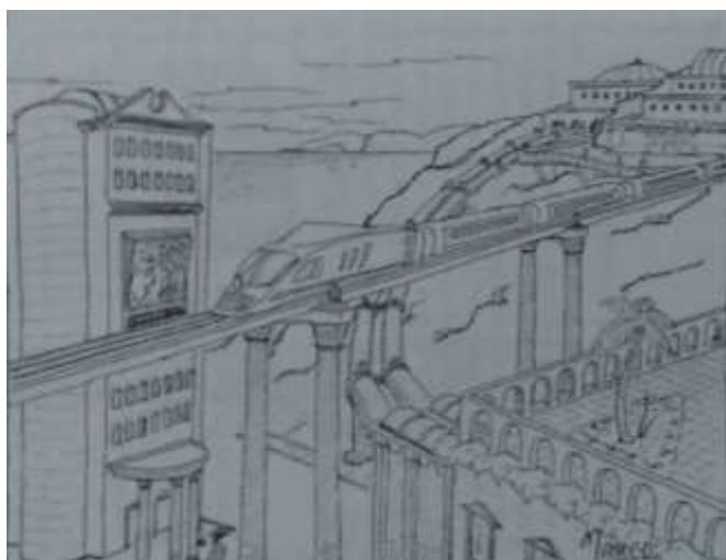
Figura 07 – Natal, 1959, sob o olhar de Dantas, nos traços de Marco Aurélio Duarte Pinheiro da Câmara. A representação futurista possibilita uma meta-representação: o imaginário torna-se imagem.

A construção de um grande porto resolveria definitivamente o tema do funcionamento do ancoradouro existente, ineficaz até aquele momento. No cerne da questão, está a necessidade que se tinha de maior inserção no mercado mundial. Isto porque, até fins do século XIX, a capital não dispunha de porto adequado para o transporte de mercadorias, dificultado em seu acesso pela decorrência dos afloramentos rochosos na entrada da barra do rio, que limitava o calibre das embarcações. Essa questão já era de conhecimento do Poder Público, quando em 1893 se cogitou “[...] melhorar a entrada do porto de Natal, [...], dando-lhe maior profundidade e fazendo desaparecer a grande sinuosidade do canal que [dava] acesso ao ancoradouro interno fronteiriço à cidade”, culminando com a instauração da Comissão de Melhoramentos do Porto no mesmo ano (CASTRICIANO, 1904, p.22). As obras e os serviços se estenderiam por décadas, até a criação do Porto Organizado de Natal, na década de 1930 (SIMONINI, 2014).