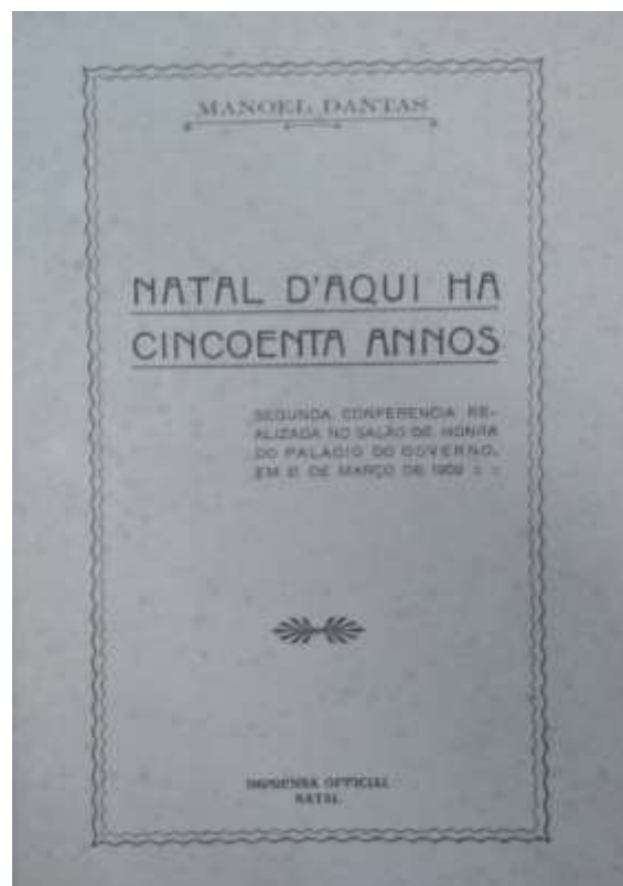
Figura 02 – Frontispício da publicação da conferência

Constitui-se fontes documentais além da mencionada palestra, jornais de circulação local e crônicas memorialísticas do período. Ademais, utilizou-se bibliografia pertinente no sentido de contextualizar o momento socioeconômico, cultural e, sobretudo, político em questão, assim como para auxiliar na compreensão da cidade concreta existente à época. Para apresentar as reflexões geradas a partir da análise pretendida, o trabalho se divide em três itens. O primeiro aborda as