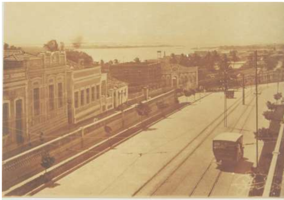
Figura 04 – Avenida Tavares de Lyra, década de 1920. O ideal das elites se transvestiu nas realizações materiais de uma cidade dita moderna.

consequente implantação dos bondes elétricos (ambos em 1911), além da modernização do seu porto, a partir de 1903 e da implantação da Estrada de Ferro Central do Rio Grande do Norte (1906). 6