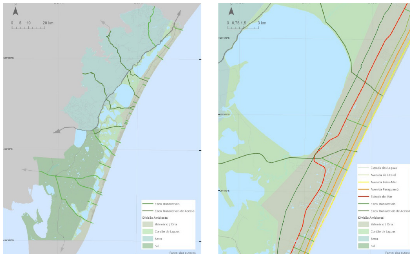
Figura 4 - Macro retícula viária proposta pelo estudo encomendado pela Metroplan.