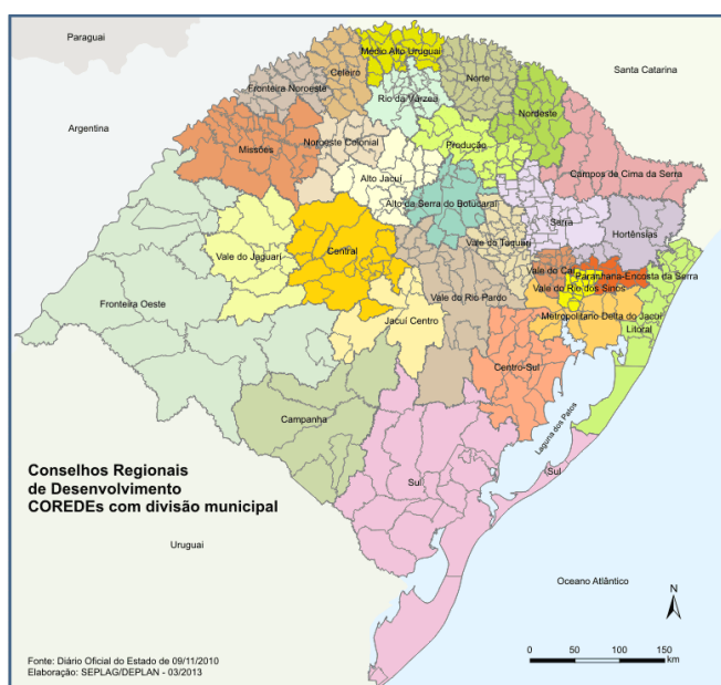
Figura 1 - Divisão do Rio Grande do Sul de acordo com os COREDES (esquerda) e Regiões Funcionais (direita).

Em 2005, a Secretaria Estadual de Coordenação e Planejamento encomendou um estudo, onde o produto foi um plano de desenvolvimento regional com metas e programas relacionados à organização territorial e logística estadual (RIO GRANDE DO SUL, 2006). O estudo determinou a necessidade de uma escala mais ampla para trabalhar temas estratégicos. A partir disso foram estabelecidas as Regiões Funcionais, onde os COREDEs foram agrupados de acordo com suas características socioeconômicas (RIO GRANDE DO SUL, 2006). A Figura 1 mostra as duas divisões regionais.