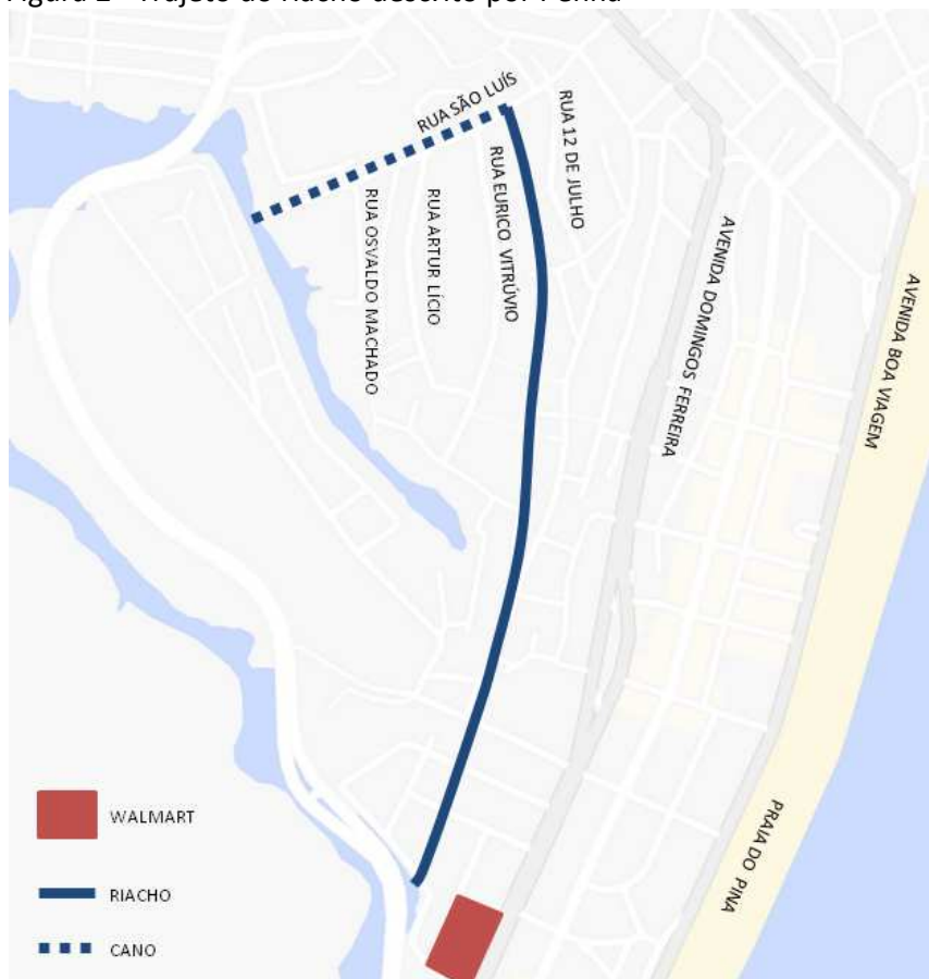
Figura 2 - Trajeto do riacho descrito por Penha