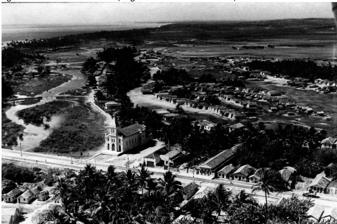
Figura 1 - Comunidade do Bode, região do atual bairro do Pina, década de 1950

Em meados do século XX, áreas da zona sul já se estabeleciam como lugar de primeira moradia das elites na porção litorânea e, paralelamente, outro tipo de população se assentava nos alagados manguezais. Uma das comunidades que se formou se chama Bode (inserida no atual bairro do Pina) àquela época composta especialmente por pescadores, operários, lavadeiras, entre outras ocupações próprias de pessoas muito pobres (ARAÚJO, 2007).