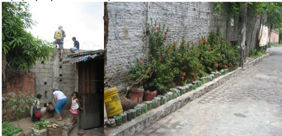
Figura 6: Apropriações junto aos muros que fazem o limite entre a ZPA 05 e a AEIS Vila de Ponta Negra.

Na foto à direita cultivo de mudas por moradores locais e na foto à esquerda, perfurações feitas pelas crianças para criar passagens e pontos de escalada no muro.