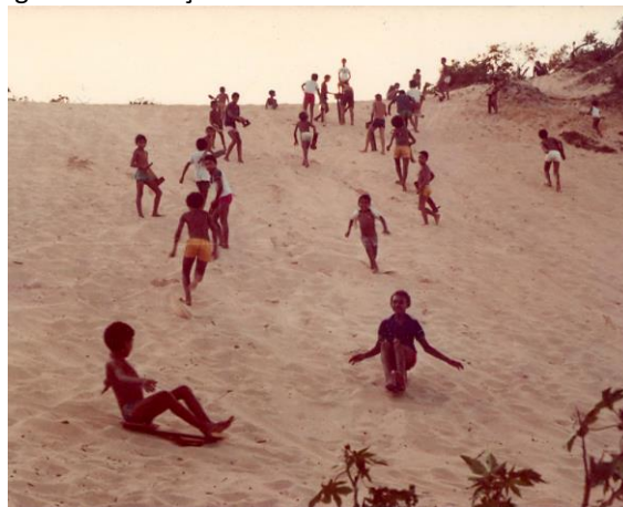
Figura 12: Crianças brincando nas dunas de Mãe Luiza.