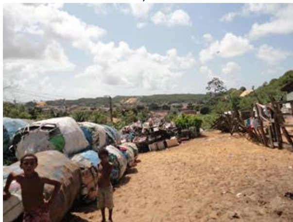
Figura 7: Crianças em área improvisada de depósito e separação de lixo reciclável, próximo ao antigo aterro sanitário, na ZPA 04.