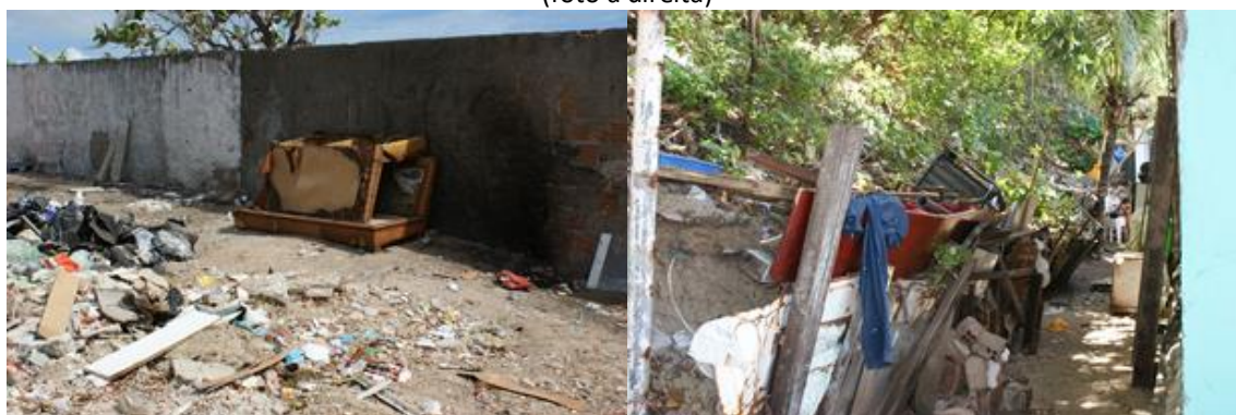
Figura 8: Poluição e risco ambiental nos limites entre a AEIS Mãe Luiza e as ZPA 10(foto à esquerda) e ZPA 02 (foto à direita)