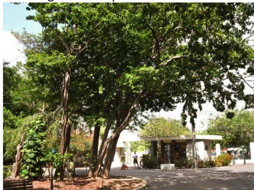
Figura 1: Bosque dos Namorados.

Ademais, em cidades litorâneas, as praias urbanas são os ambientes naturais que concentram maior quantidade de visitantes. Em Natal, nos fins de semanas e feriados a população também é atraída por algumas áreas verdes, sobretudo quando há oferta de programação cultural sustentada por ações dos governos e órgãos afins, como acontece com o Bosque dos Namorados (Figura 1), a Cidade da Criança (Figura 2), o Parque da Cidade (Figura 3), destacando-se, também, o projeto Cidade Viva (Figura 4), que fecha para o tráfego parte da Via Costeira Sen. Dinarte Medeiros Mariz aos domingos e a transforma em um espaço de lazer. A respeito desse último projeto, embora não ocorra dentro de uma área de proteção, a intervenção se apropria da paisagem do entorno, através da percepção visual do parque e da sua relação com a praia.