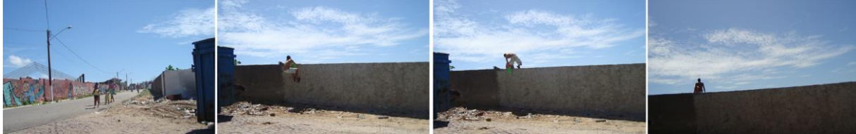
Figura 11: Nos limites murados das dunas do Farol de Mãe Luiza (ZPA 10), a alternativa de percurso do surfista para chegar à praia.

dela extraindo as condições essenciais para a sua sobrevivência, no tempo em que muros e cercas não existiam (Figura 12)