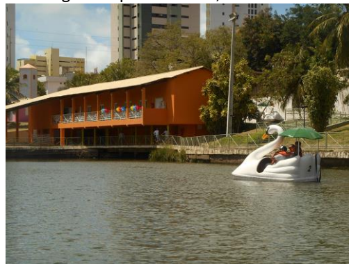
Figura 2: Lagoa Felipe de Freitas, na Cidade da Criança.