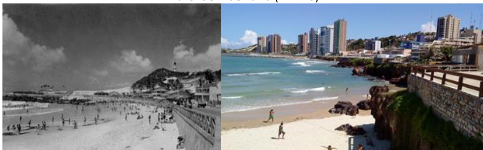
Atrativo visual sendo afetado pela verticalização acentuada da área nos últimos anos.