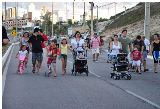
Figura 4: Projeto Cidade Viva transforma a Via Costeira, num espaço de lazer