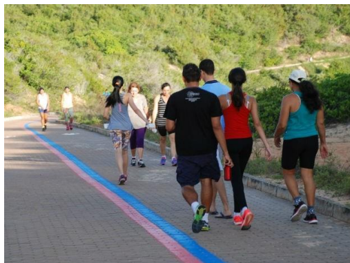
Figura 3: Trilha pavimentada do Parque da Cidade.