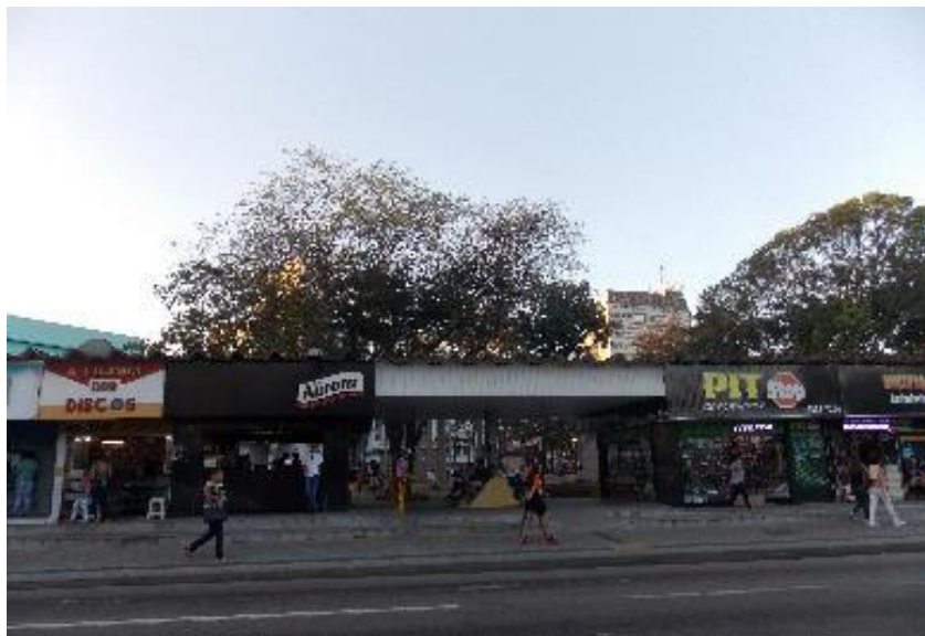
Fig.8a, 8b e 8c. Acessibilidade, visibilidade e sociabilidade na Praça da Bandeira-Campina Grande- Paraíba.