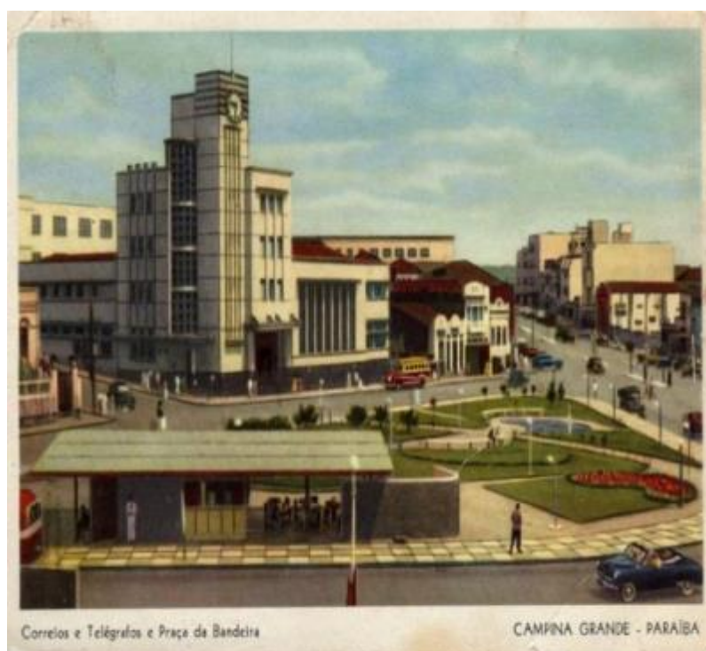
Fig.5: Estilo Art- Decó em Campina Grande

Como a Praça estava localizada nessa importante rua municipal, o presente espaço público devia refletir esse ideal de importância. Prédios institucionais como o dos correios, inaugurado em 1958, traziam o ar de modernidade para a rua, que era acompanhado de mais prédios com mais de um pavimento e com fachadas coloridas e “bem adornadas”, recebendo o estilo art decó. Sendo assim, o lago meia lua, fonte da Samaritana – importante estátua que refletia a arte da época- piso em pedra portuguesa e áreas ajardinadas, traziam o ideal de beleza e estar para o ambiente, distanciando a cidade interiorana dos costumes coloniais.