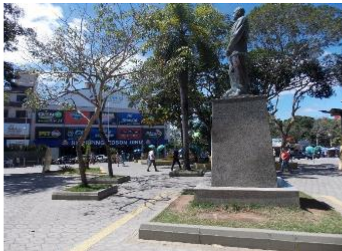
Fig. 7: Elemento central da Praça da Bandeira, monumento Juscelino Kubitschek

com menor e maior frequência de acordo com as influências externas. Nessa perspectiva, cria-se uma permanente produção de desordem no território, em que cada desordem precedente é diferente da desordem seguinte (SANTOS; SILVEIRA, 2001). Colando essas observações na análise da Praça da Bandeira verifica-se que as demandas externas alteraram o lugar e sua dinâmica, e as sucessivas mudanças manifestam uma verdadeira crise de identidade nesse espaço público. A inserção do comércio dentro da praça normatizou ainda mais a vitalidade dentro do ambiente, sendo mais intenso com o seu funcionamento e fraco quando desativado.