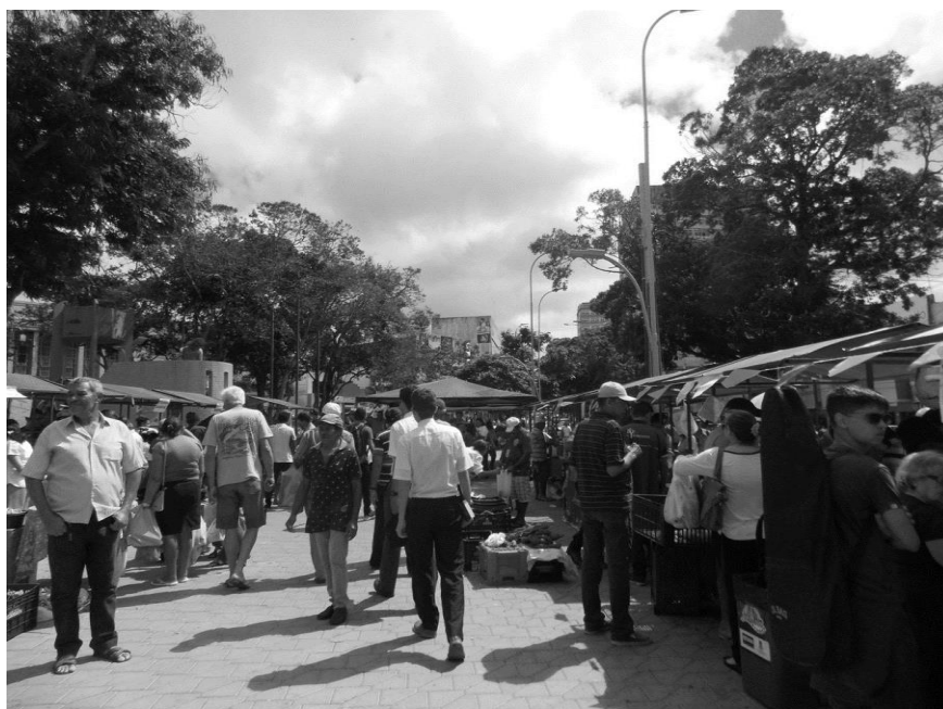
Fig.6: Feira orgânica na Praça da Bandeira- junho 2018