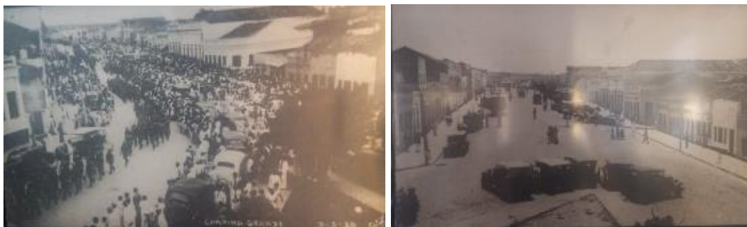
Fig.4a e 4b. Antiga Rua do Armazém, hoje Rua Marquês do Herval.