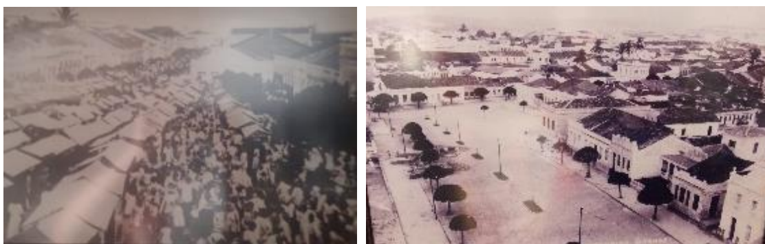
Fig.2a e 2b: Feira de Campina Grande no início do século XX e Largo da matriz em 1932, hoje Avenida Floriano Peixoto

nomes dos logradouros públicos, como mencionado por Queiroz (2008). As ruas, becos e largos deixaram seus nomes populares como largo do comércio velho, comércio novo, da matriz, beco do Açougue, Rua do Armazém e do Rói Couro para nomes de símbolos e figuras conhecidas no Brasil republicano, como Floriano Peixoto, Marques do Herval, Maciel Pinheiro, Epitácio Pessoa, Venâncio Neiva e Praça da Bandeira. A modificação do nome não gerou tanto impacto para os moradores da época que já o tinham enraizado, no entanto, as gerações posteriores desconhecem esses nomes, que eram características existentes naquele espaço e o transformavam em lugar (AUGÉ, 1994). Com a perda desse nome característico, a maioria dessas ruas perderam seu uso anterior, e passaram a serem vítimas das homogeneizações dos grandes centros, recebendo o que Massey (2008) chama de sentido global do lugar; cada lugar é o centro de uma mistura distinta das relações sociais mais amplas com as mais locais.