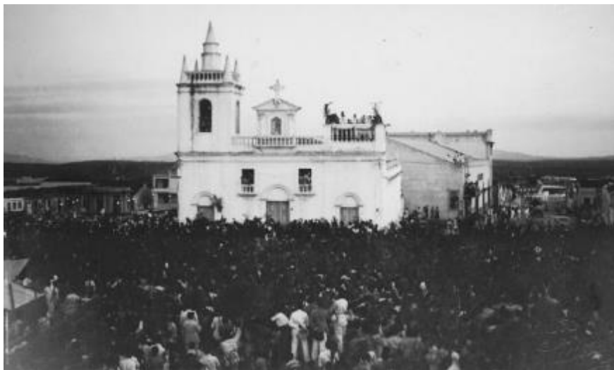
Fig 3: Celebração religiosa na Igreja do Rosário

(Fonte: Retalhos Históricos de Campina Grande, disponível em: http://cgretalhos.blogspot.com/ )