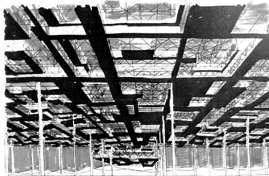
Figura 1 – Estabelecimento tridimensional, Yona Friedman