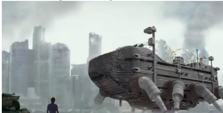
Figura 4 – Walking Cities , Ron Herron