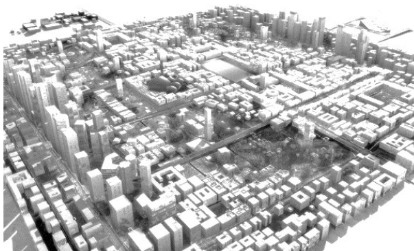
Figura 5 – A cidade no deserto

A nova cidade assinada por Koolhaas para os Emirados Árabes Unidos, foi, segundo Brochon (2014), projetada para ser erguida no estado do Texas – EUA. No Texas, se chamava The Center for Innovation, Texting and Evaluation ou simplesmente The Center 5 . Não se sabe ao certo, mas acreditamos que no momento em que é convidado para desenvolver o plano estrutural para Ras Al Kaimah, Koolhaas, retoma o projeto texano.