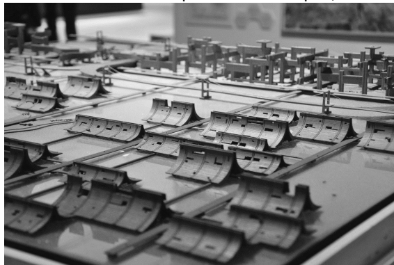
Figura 3 – Plano urbanístico para Baía de Tóquio, Kenzo Tange