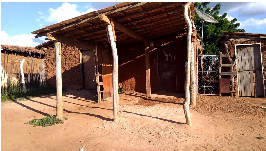
Figura III – Moradia do Rancho de Baixo.