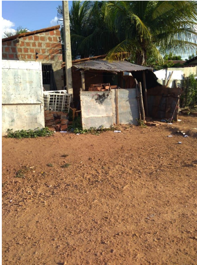
Figura II – Moradia no Rancho de Baixo.