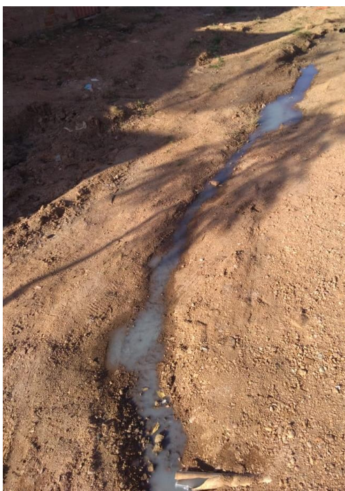
Figura IV – Esgoto a céu aberto no Rancho de Baixo.

Ainda, predomina no Rancho de Baixo a coabitação, em que diversos núcleos familiares dividem o mesmo teto, apesar das casas não possuírem o mínimo de habitabilidade para uma única família se desenvolver de forma digna. Isto porque a grande parcela não apresenta sistema de esgotamento (Figura IV), obrigando a população a eliminar seus excrementos a céu aberto, enquanto que as condições de saneamento são insustentáveis – principalmente nos meses chuvosos, cujas casas são inundadas pela água contaminada por todo tipo de sujeira.