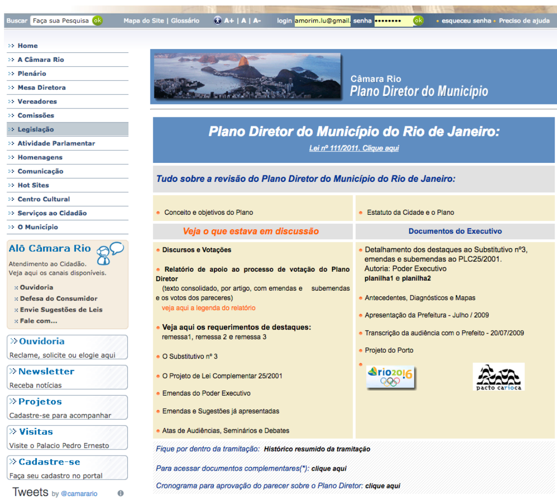
Imagem 01. Página da Câmara Municipal que dá o acesso ao conteúdo da revisão que gerou o Plano Diretor de Desenvolvimento Urbano Sustentável do Município de Rio de Janeiro. No entanto, as atas de audiências, seminários e debates não estão disponíveis nesse site. Disponível em: < http://www.camara.rj.gov.br/controle.php?m1=legislacao&m2=plandircid&url=http://www.camara.rj.gov.br/planodiretor/indexplano.php >. Acesso em: 20 jun. 2017.