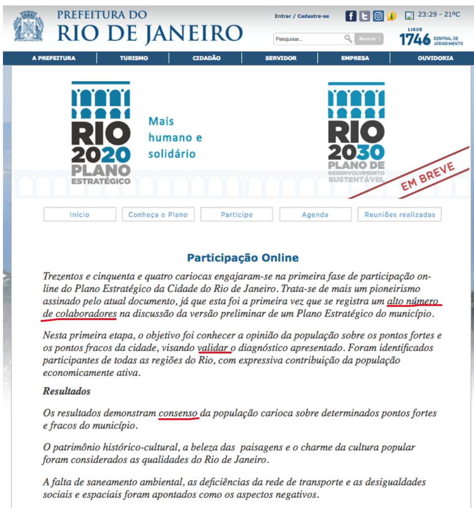
Imagem 05. Participação da sociedade civil a partir da internet para o Plano Estratégico Rio 2020. Fonte: Site da Prefeitura do Rio de Janeiro. Disponível em: < http://prefeitura.rio/web/planejamento/participe_ > Acesso em: 24 de setembro de 2018.