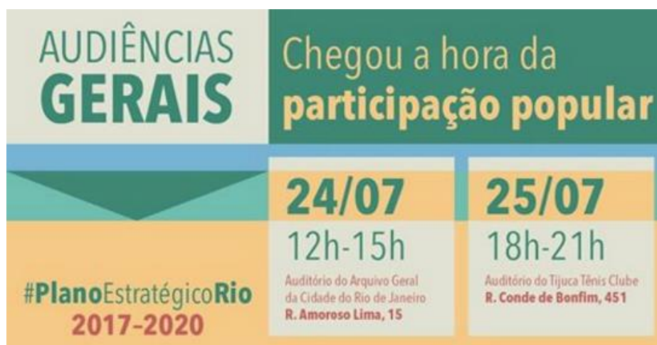
Imagem 02. Convocação, via Facebook, para participação das audiências públicas para o Plano Estratégico do governo do prefeito Marcelo Crivella.

Na ocasião das audiências de junho de 2017, o Plano Estratégico foi apresentado ao público na forma de 101 metas (a partir de dois informes em duas folhas de papel, conforme a imagem acima, e sem o acesso ao volume completo, que só foi disponibilizado na internet após a audiência) divididas em temas como economia, social, urbano ambiental e governança, a serem alcançadas nos quatro anos de mandato.