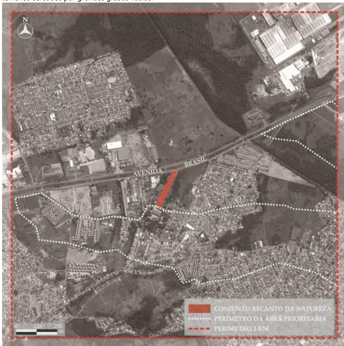
Figura 2: Cartograma exemplificando a implantação do PMCMV às margens de Vias Expressas e em terrenos cercados por grandes glebas vazias.

de matar, o poder de deixar viver e o poder de expor à morte, à violação, ao terror. O recorte racial é fundamental para compreender o funcionamento desse mecanismo.