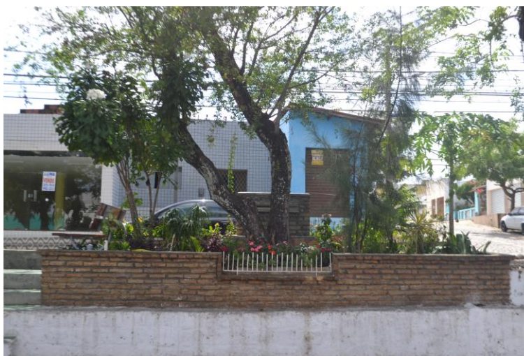
Figura 10 - Canteiro central na Av. 6 com intervenções dos moradores.

Além disso, grupos têm se organizado para realizar intervenções em espaços públicos na cidade de Natal. É o exemplo do Quintal Urbano, laboratório de experiências e urbanismo ligado ao curso de Arquitetura e Urbanismo da Universidade Potiguar (UnP). Em 2017, o grupo organizou uma série de eventos, dentre eles um workshop de intervenção em duas praças no bairro de Ponta Negra (Praça do Bicicross e Praça Desembargador Licurgo Ferreira Nunes), com participação de estudantes e de moradores do entorno. Foram propostas simples, mas de grande valor simbólico, que demonstram a preocupação e o cuidado com o lugar (Figura 11, Figura 12 e Figura 13).