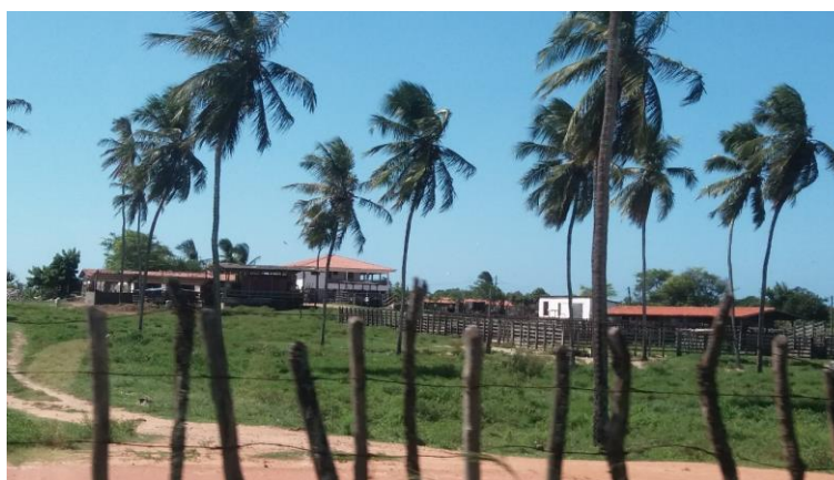
Figura 24 - Vacaria localizada no bairro de Pajuçara.

Contudo, algumas dessas AEIS e ZPAs não se encontram regulamentadas. Tal regulamentação poderia contribuir tanto para a proteção ambiental, quanto para a permanência dos agricultores em seu local de residência, constantemente pressionados pelo