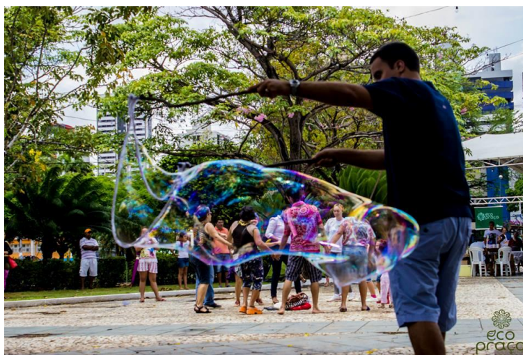
Figura 8 - Ecopraça, evento que ocorre periodicamente em Natal.

Outros eventos também têm adquirido o caráter de festa em Natal, a exemplo do Ecopraça. O Ecopraça é um projeto que ocorre periodicamente em diferentes praças da cidade, com objetivo de resgatar o uso do espaço público. Para isso, realizam uma programação com uma série de atividades e atrações, algumas delas incluindo trabalho voluntário para melhorias físicas permanentes no espaço em que o evento se realiza (Figura 8). Esses momentos simbolizam o encontro, o divertimento e dão sentido à vida na cidade.