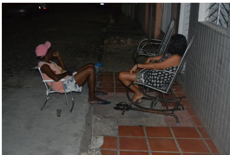
Figura 14 - Mulheres sentadas na calçada no bairro de Nossa Senhora de Nazaré (foto autorizada).