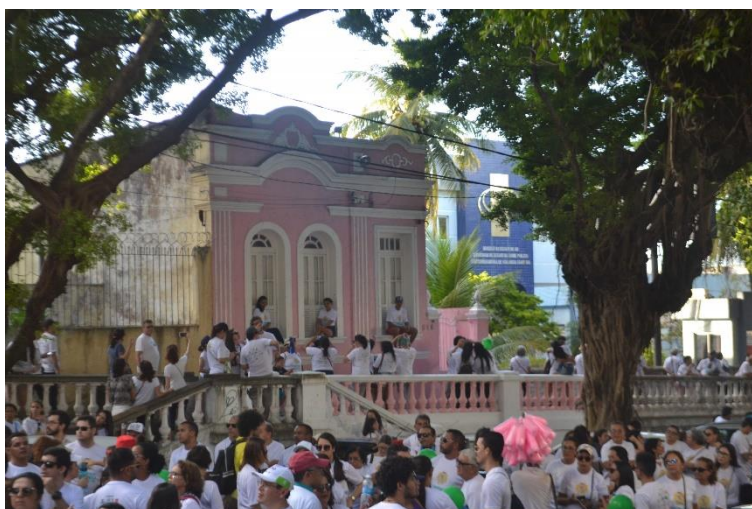
Figura 16 - Caminhada Histórica de Natal (2018).

Esses dois eventos também se relacionam com a festa. O Circuito Ribeira, por exemplo, é um momento de encontro e diversão para as pessoas. Ao final da Caminhada Histórica do ano de 2018 também houve um momento musical, com atrações que cantavam músicas relacionadas a Natal, como parte de um concurso. Unem-se, portanto, nesses casos, o uso improdutivo da cidade com a valorização de sua história (forma escriturária).