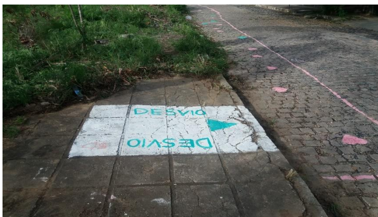
Figura 12 - Intervenção em praça do bairro de Ponta Negra, elaborada em oficina do Quintal Urbano.