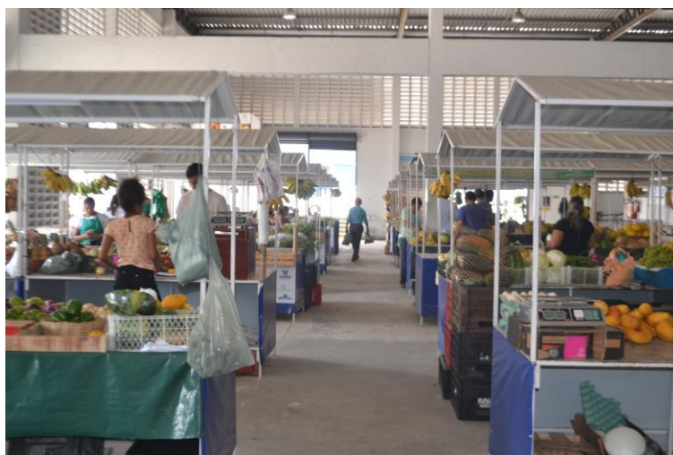
Figura 18 - Central de Comercialização da Agricultura Familiar e Economia Solidária.

A Central de Comercialização da Agricultura Familiar e Economia Solidária foi aberta em 2017 e se situa na esquina da Rua Jaguarari com a Avenida Capitão Mor-Gouveia, funcionando de segunda à sábado. Nela, são vendidos produtos que têm origem na agricultura familiar, como o próprio nome do lugar já afirma. É possível encontrar por lá tanto produtos frescos, como frutas e verduras, quanto industrializados, como geleias e queijos. Além disso, há uma estrutura de restaurantes populares e pequenas lojas de artesanato. Ao permitir a comercialização direta, a Central amplia as possibilidades de ganhos para os produtores.