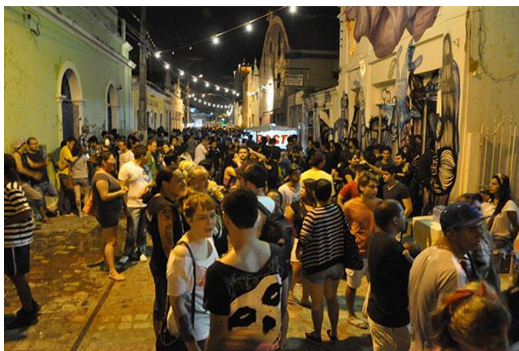
Figura 15 - Circuito Cultural Ribeira.

Apesar disso, há alguns movimentos de resistência que defendem o uso do centro histórico. Além de negócios, com forte apelo cultural, que se localizam em edifícios antigos, contribuindo para sua proteção, há também eventos realizados esporadicamente, como o Circuito Ribeira (Figura 15) e a Caminhada Histórica de Natal (Figura 16). O Circuito é um evento que acontece mensalmente nos fins de semana no bairro da Ribeira, um dos mais antigos da cidade, e nele ocorrem diversas atrações culturais envolvendo música, teatro, dança, poesia, dentre outras manifestações. Já a Caminhada vem ocorrendo anualmente e propõe um circuito guiado pelo centro histórico de Natal, atraindo público significativo.