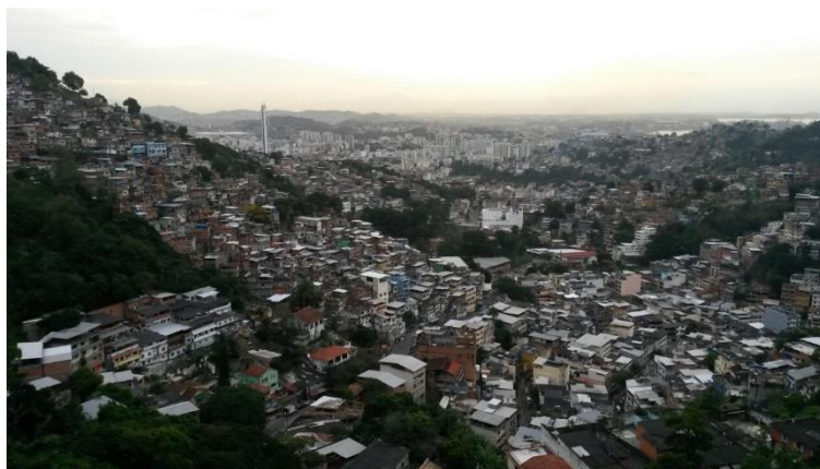
Figura 4 - Comunidade em morro do Rio de Janeiro.

Ao refletir sobre as cidades brasileiras, sua típica segregação se manifesta como uma forma de desequilíbrio, de falta de simetria. Às vezes, coexistem lado a lado favelas e condomínios fechados. De um lado, os ricos, do outro, os pobres. De um lado, automóveis, do outro, o ônibus lotado. De um lado, a água encanada, o chuveiro elétrico, o ar-condicionado. Do outro, o desconforto térmico e o esgoto a céu aberto. São imagens fortes, que rendem fotografias impactantes e que mostram o quanto ainda é preciso avançar em direção ao direito à cidade no Brasil (Figura 4).