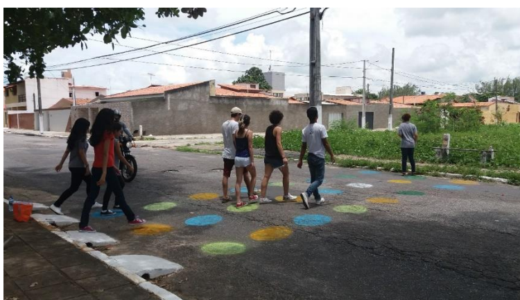
Figura 13 - “Faixa de pedestres” desenhada em workshop realizado pelo Quintal Urbano, no bairro de Ponta Negra.

A simples presença de corpos no espaço também pode significar apropriação. Embora esse não seja um hábito mais tão comum na cidade de Natal, ainda é possível encontrar, especialmente nos bairros mais populares, pessoas que se sentam à frente das suas casas para conversar, especialmente após o horário comercial. Esse hábito é comum, por exemplo, no bairro de Nossa Senhora de Nazaré (Figura 14).