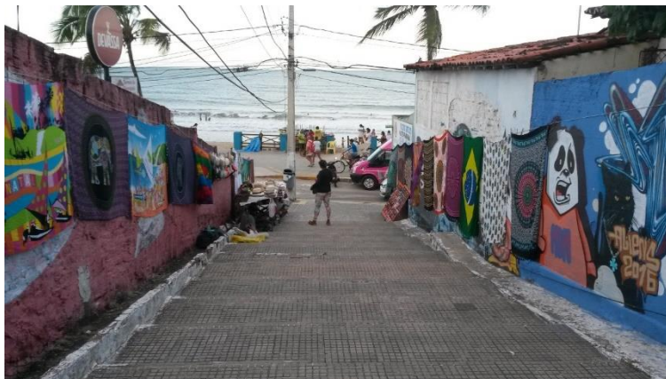
Figura 9 - Escadaria na praia de Ponta Negra, na qual se podem observar grafitis e exposição de produtos para venda.

estética repleta de significados (Figura 9). O comércio de rua expressa a beleza do improvisado, mas também, dialeticamente, um lado muitas vezes perverso do mundo do trabalho no Brasil: a informalidade. O cultivo de plantas em hortas ou canteiros centrais e as intervenções físicas em praças demonstram o desejo de aproximação com a natureza, a busca da beleza, a vontade de estar junto, especialmente quando as ações são feitas por grupos e comunidades (Figura 10).