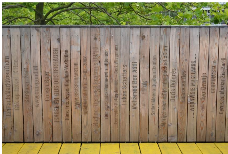
Figura 2 - Trecho de passarela construída por iniciativa e com recursos dos locais em Rotterdam. Nela, estão inscritos os nomes dos colaboradores. Fonte: acervo da autora, 2013.

A forma da linguagem , por sua vez, tem relação com as significações e sentidos. A linguagem é aquilo que permite a comunicação, podendo ser expressa verbalmente ou não-verbalmente. Nas cidades, do ponto de vista simbólico, há muitos elementos que podem representar a efetivação do direito à vida urbana e a apropriação do espaço ou não. Uma horta urbana em espaço público, por exemplo, simboliza a apropriação do espaço pelos indivíduos, assim como qualquer obra realizada diretamente pelas pessoas (Figura 2). Da mesma maneira, quando o poder público pensa em um espaço público de qualidade, significa que ele está preocupado com o bem-estar de sua população.