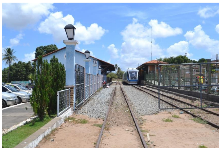
Figura 20 - Trem que parte do bairro da Ribeira, em Natal, na estação de Ceará-Mirim/RN.

Algumas outras iniciativas de mobilidade merecem destaque também. Uma delas é o trem que parte da Ribeira, indo em direção a Extremoz e Ceará-Mirim (Figura 20). O trem passa pela Região Administrativa Oeste de Natal, uma das regiões mais pobres do município, porém apresenta ótima qualidade: além de ter um preço acessível (a passagem custa um real, mas ao que tudo indica, voltará a custar 50 centavos, como antes) e o trem é seguro e climatizado. Recentemente, no que tange à mobilidade, também houve a implantação de ciclofaixas e faixas exclusivas para ônibus em Natal (Figura 21) 4 .