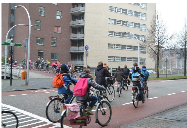
Figura 1 - Diferentes espaços reservados à circulação de pedestres, ciclistas e automóveis em Zwolle, na Holanda.

Em relação à forma matemática , o autor a define como “a identidade e a diferença, a igualdade na diferença. A enumeração (dos elementos de um conjunto etc.). A ordem e a medida” (LEFEBVRE, 2008, p. 92). A forma matemática é de mais fácil apreensão: ela diz respeito às medidas, tanto de espaço quanto de tempo. Pensando do ponto de vista da cidade, é possível utilizar como exemplo o espaço dedicado ao pedestre, ao ciclista e ao automóvel nas cidades. Há cidades que sequer pensam no espaço do ciclista e que negligenciam o do pedestre, com calçadas muito estreitas ou ausência delas. O espaço do veículo, no entanto, é priorizado do ponto de vista matemático, sempre maior. O direito à cidade estaria vinculado, portanto, há um maior equilíbrio espacial para as áreas reservadas aos diferentes modais (Figura 1).