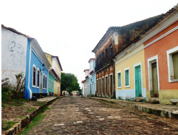
Figura 5 - Cidade de Alcântara, no Maranhão. Proteção ao patrimônio histórico atrelada ao uso popular do espaço (os moradores locais permanecem em suas residências).

Por fim, Lefebvre discute sobre a forma urbana . Para o autor, esta tem relação com a simultaneidade de acontecimentos, com os encontros, com a vizinhança (não só entre indivíduos, mas também a aproximação com produtos, atividades e riquezas). É também no urbano em que se encontram a obra e o produto.