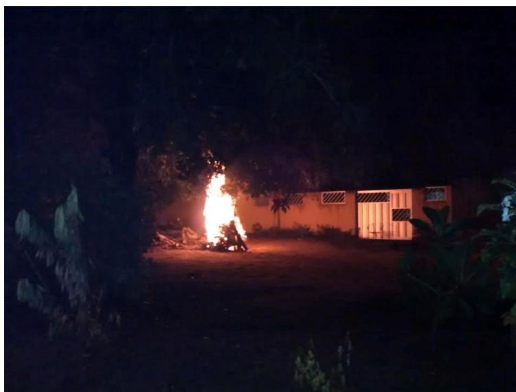
Figura 7 - Fogueira em bairro de Natal, uma tradição da noite de São João.

Outros eventos também têm adquirido o caráter de festa em Natal, a exemplo do Ecopraça. O Ecopraça é um projeto que ocorre periodicamente em diferentes praças da cidade, com objetivo de resgatar o uso do espaço público. Para isso, realizam uma programação com uma série de atividades e atrações, algumas delas incluindo trabalho voluntário para melhorias físicas permanentes no espaço em que o evento se realiza (Figura 8). Esses momentos simbolizam o encontro, o divertimento e dão sentido à vida na cidade.