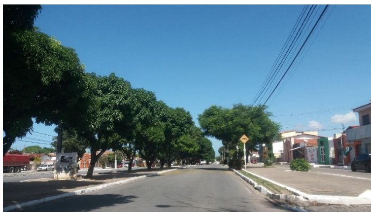
Figura 19 - Avenida Itapetinga em Natal.

Algumas outras iniciativas de mobilidade merecem destaque também. Uma delas é o trem que parte da Ribeira, indo em direção a Extremoz e Ceará-Mirim (Figura 20). O trem passa pela Região Administrativa Oeste de Natal, uma das regiões mais pobres do município, porém apresenta ótima qualidade: além de ter um preço acessível (a passagem custa um real, mas ao que tudo indica, voltará a custar 50 centavos, como antes) e o trem é seguro e climatizado. Recentemente, no que tange à mobilidade, também houve a implantação de ciclofaixas e faixas exclusivas para ônibus em Natal (Figura 21) 4 .