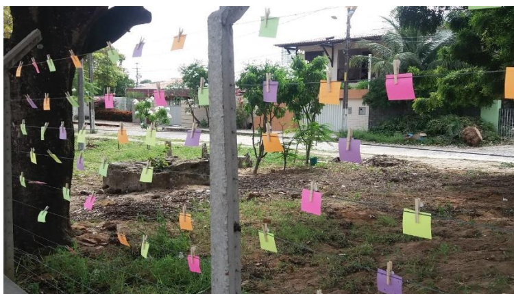
Figura 11 - Mural de recados na “Praça do Bicicross”, em Ponta Negra, elaborado em oficina do Quintal Urbano.