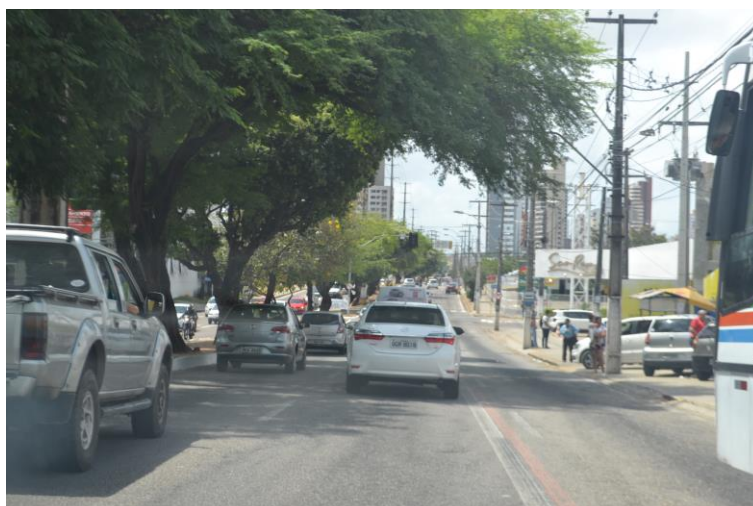
Figura 21 - Faixa para ônibus e ciclistas na Av. Prudente de Moraes.