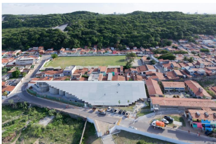
Figura 22 - Ginásio Arena do Morro, em Mãe Luiza. Fonte: Iwaan Baan, 2014.

Um projeto simbólico construído no bairro é o Arena do Morro (Figura 22), realizado pelo escritório Herzog e de Meuron, arquitetos que fazem parte do “star system”. É simbólico pois, tem-se aí, um equipamento esportivo de qualidade construído por um escritório renomado em um bairro “periférico” (não no sentido geográfico, mas social) e que respeita as condições e necessidades locais, devido à pressão dos próprios grupos locais. Tem-se aqui, também, um exemplo do “bom projeto”, dessa vez arquitetônico, mas totalmente vinculado ao contexto urbano.