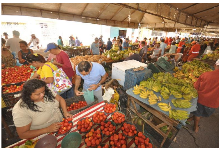
Figura 17 - Tradicional feira do bairro do Alecrim.

Há inúmeros espaços em Natal que podem ser vinculados à forma da troca. Aqui, são apresentados dois deles: a feira do Alecrim (Figura 17) e a Central de Comercialização da Agricultura Familiar e Economia Solidária (Figura 18). A feira do bairro do Alecrim ocorre semanalmente aos sábados de manhã, no cruzamento das Avenidas Coronel Estevam e Presidente Quaresma. Vendem-se frutas, verduras, carnes, mudas de plantas, ervas e temperos, roupas e brinquedos e é possível ouvir música popular e tomar o famoso caldo de cana. Muitas vezes a expressão “feira do Alecrim” é utilizada como sinônimo de “bagunça” em Natal – mas quem dera mais lugares pudessem ser tão diversos e vivos como este.