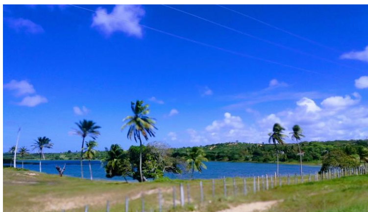
Figura 25 - Lagoa inserida na Zona de Proteção Ambiental 9 (ZPA 9), Região Norte de Natal.

Nesses espaços, é possível perceber uma outra lógica e modo de vida. A rotina se aproxima dos tempos lentos, da lógica da natureza e o cotidiano é marcado pelo contato com a terra, pouco praticado nas cidades. No entanto, a lógica da urbanização influencia também fortemente esses lugares: a internet e os celulares se fazem presentes no cotidiano, além de outras tecnologias como a televisão e alguns produtores possuem trabalhos no setor de serviços para complementar a renda. São lugares em que o rural e o urbano convivem, ora de maneira conflitante, ora harmoniosamente.