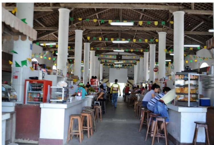
Figura 3 - Mercado público de Ceará-Mirim/RN. Um espaço destinado à alimentação, venda de produtos regionais e onde também ocorrem alguns eventos, como a transmissão de jogos da Copa do Mundo (vide telão ao fundo do local).

Esse tipo de relação se mantém, por exemplo, nas feiras e mercados (Figura 3), que podem, inclusive, ser considerados espaços de resistência, com todas as suas contradições. Apesar de ser um espaço de compra e venda, neles também há um traço importante da cultura, se encontram artigos populares que não são vistos nas prateleiras dos supermercados, há muitas vezes cantadores, literatura de cordel (especialmente no Nordeste) e a possibilidade do contato direto com o produtor da mercadoria. A feira e o mercado reúnem pessoas, permitem o contato com o outro, com o diferente e o diálogo. São, portanto, lugares que transcendem a lógica do capital.