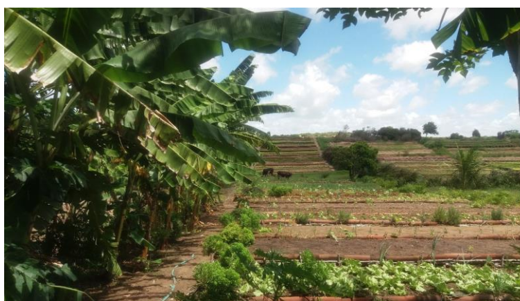
Figura 23 - Horta na comunidade do Gramorezinho, no bairro de Lagoa Azul. Fonte: acervo da autora, 2017.

Apesar de ser considerada como sendo 100% urbana pelo Plano Diretor atual, Natal possui áreas que carregam características rurais. São sítios, vacarias e espaços próximos à natureza que ainda resistem frente ao processo de urbanização (Figura 23, Figura 24 e Figura 25). Do ponto de vista da forma contratual, algumas dessas áreas são consideradas como AEIS de Segurança Alimentar, que tem como objetivo garantir o acesso a alimentos de qualidade para a população de menor renda. Outras dessas áreas são Zonas de Proteção Ambiental (ZPA), delimitadas com objetivo de proteger recursos ambientais importantes para a cidade (NATAL, 2007).