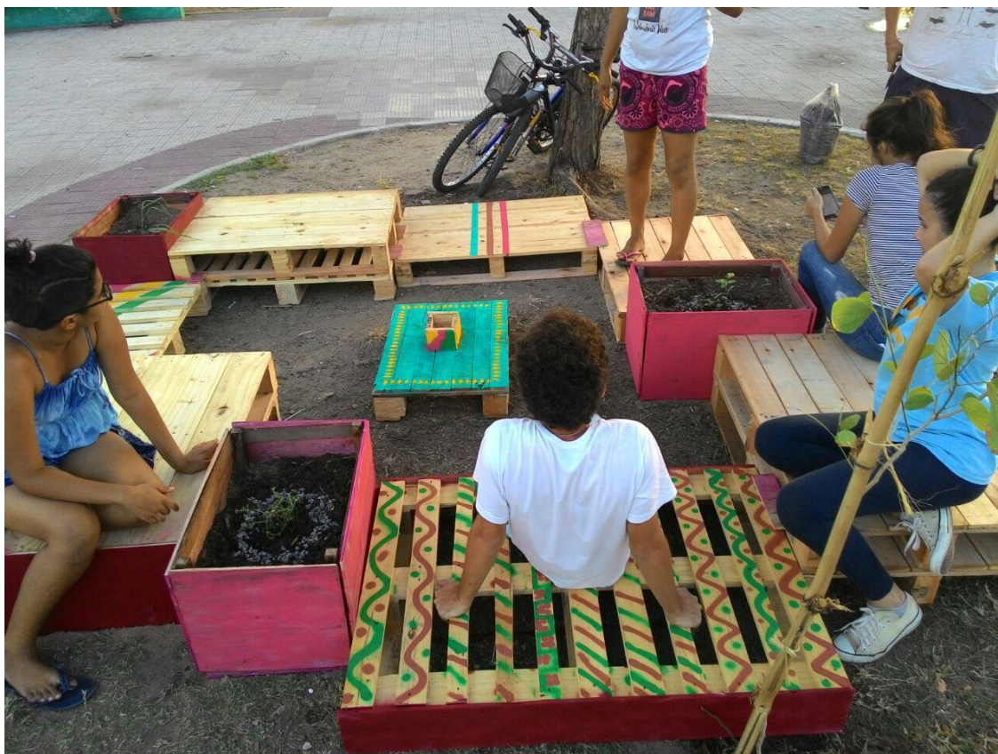
Imagem 03: Ambiente em Movimento I dezembro/2017

Ao final das intervenções conjuntas, o relato dos participantes do JAP em relação aos arquitetos foi muito positivo, permeado por comentários sobre a igualdade dos profissionais junto aos outros participantes no processo de construção dos espaços e da troca de conhecimento que aconteceu de forma horizontal. O pagamento dos membros da Taramela para assessorar esse projeto é o que permite a formalização da entidade como pessoa jurídica sem fins lucrativos em março de 2018.