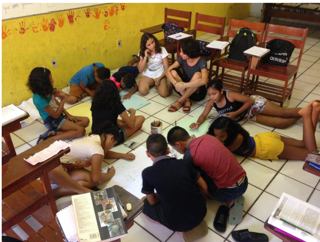
Imagem 04: Oficina com crianças do Lagamar I maio/2018

Nesse contexto, a proposta inicial consistia na reforma e ampliação da sede da Fundação Marcos de Bruin (FMB), uma OSC de referência no trabalho social, que atua há mais de 25 anos na comunidade do Lagamar, desenvolvendo, atualmente, suas atividades a partir de três eixos pertinentes no contexto territorial: criança e adolescente, geração de renda e desenvolvimento local. Contudo, a partir das necessidades e visualização de aspectos socioespaciais maiores, o projeto inicial se expandiu, e passou a incluir outras demandas, como a também reforma e ampliação da sede do grupo Jovens em Busca de Deus (JBD) e o melhoramento dos espaços públicos à margem do canal que divide a comunidade.