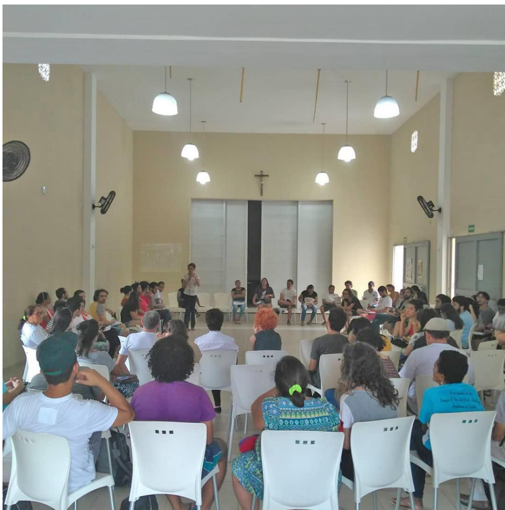
Imagem 02: Assembleia Popular da Cidade I abril/2018

A primeira Assembleia Popular da Cidade aconteceu em junho de 2017 na Vila Vicentina, os encontros, itinerantes e mensais, aconteceram já em outras 8 comunidades de Fortaleza, sequencialmente: Mucuripe, Bom Jardim, Pici, Ocupação Gregório Bezerra, Conjunto Palmeiras, Lagamar, Aldaci Barbosa e Ocupação Raízes da Praia. Além dos encontros nas comunidades, havia assembleias de articulação, formação e planejamento, onde foram definidos três eixos prioritários de ação: vazios urbanos, a carestia e o extermínio da juventude negra. A discussão sobre esses eixos varia de acordo com a demanda de cada comunidade que recebe o evento e surgem relações com outros temas como moradia, segurança pública, saúde, saneamento e cultura.