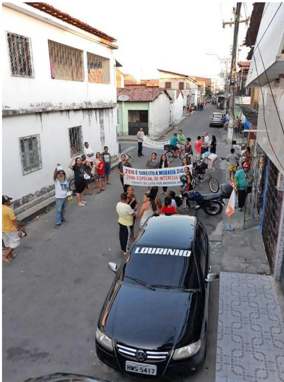
Imagem 01: Campanha para eleição do conselho gestor do Pici I setembro/2018

O objetivo foi, além de mobilizar para as eleições nas comunidades, aproximar os moradores do debate, trazer situações que provoquem um posicionamento crítico em relação ao instrumento e gerar engajamento e participação efetiva ao longo do processo, que envolve outras etapas para além da eleição do Conselho Gestor, como a elaboração dos Planos Integrados de Regularização Fundiária (PIRF).