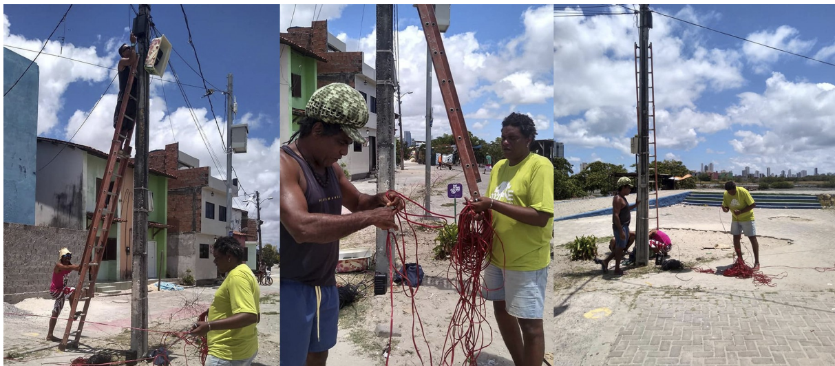
Instalação de caixas de som para a rádio poste em novos pontos da ilha (Caranguejo Uçá, 2018).

Recentemente, começaram a realizar um programa de televisão, chamado “Jornal da Maré”, gravado na própria sede da instituição e veiculado na TV pública universitária de Pernambuco. Também queriam que a cidade visitasse o lugar e o conhecesse de fato, começaram a organizar um evento anual intitulado Brechó Cultural, que reúne apresentações artísticas, feira de gastronomia e artesanato, rodas de diálogo e espaço de formação, atraindo centenas de visitantes à ilha ao longo de um dia inteiro. Neste sentido que vemos na organização um híbrido de lutas sociais por justiça ambiental, direito à cidade e à comunicação – evidenciando a complexidade sociogeográfica e cultural na qual os ilhéus estão imersos.