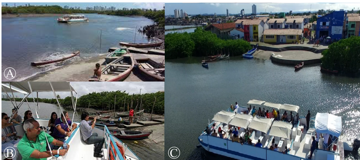
A. Imagem de reportagem da BBC Brasil [2016]; B. Imagem de reportagem Jornal do Commercio [2016]; C. Imagem do site da ONG Saber Viver

Sendo este processo algo que se constitui como um interessante objeto de análise, ao passo que vemos as fronteiras da gentrificação alargando-se sobre os lugares das cidades. Desta forma, o percurso teórico que assumimos ao longo da pesquisa, parte por um importante retorno ao conceito de lugar , a fim de entendermos mais acerca das dimensões abstratas que os ambientes urbanos assumem na vida cotidiana das pessoas. Por agora, buscamos elucidações numa possível fronteira entre a filosofia existencialista e a antropologia simbólica. Onde pretendemos pontuar a plasticidade que o conceito de lugar adquire frente a um olhar filosófico, sem perder de vista a dimensão cultural da vida humana, responsável por constituir a percepção individual e coletiva sobre os lugares.