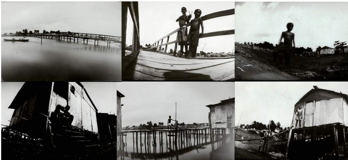
Ensaio fotográfico em técnica pinhole por Brigitte Schuster, fotógrafa estrangeira que visitou a ilha, ano 2005

ameaçada por todo o contexto de desenvolvimento da cidade ao seu redor – onde a poluição ambiental, precariedade do trabalho da pesca artesanal e aumento do emprego informal e das desigualdades urbanas, são apenas algumas das questões. Neste sentido, vemos as práticas criativas de invenção do lugar se configurando enquanto atos de “resistência” (tal como Agier sugeriria) contra um imaginário urbano hegemônico, que reduzia de sentidos e significados as formas e condições de se viver nas periferias. Onde a Ilha de Deus, mediada por suas organizações, vem se constituindo como um interessante laboratório de investigação sobre as disputas de sentidos dos lugares da cidade.