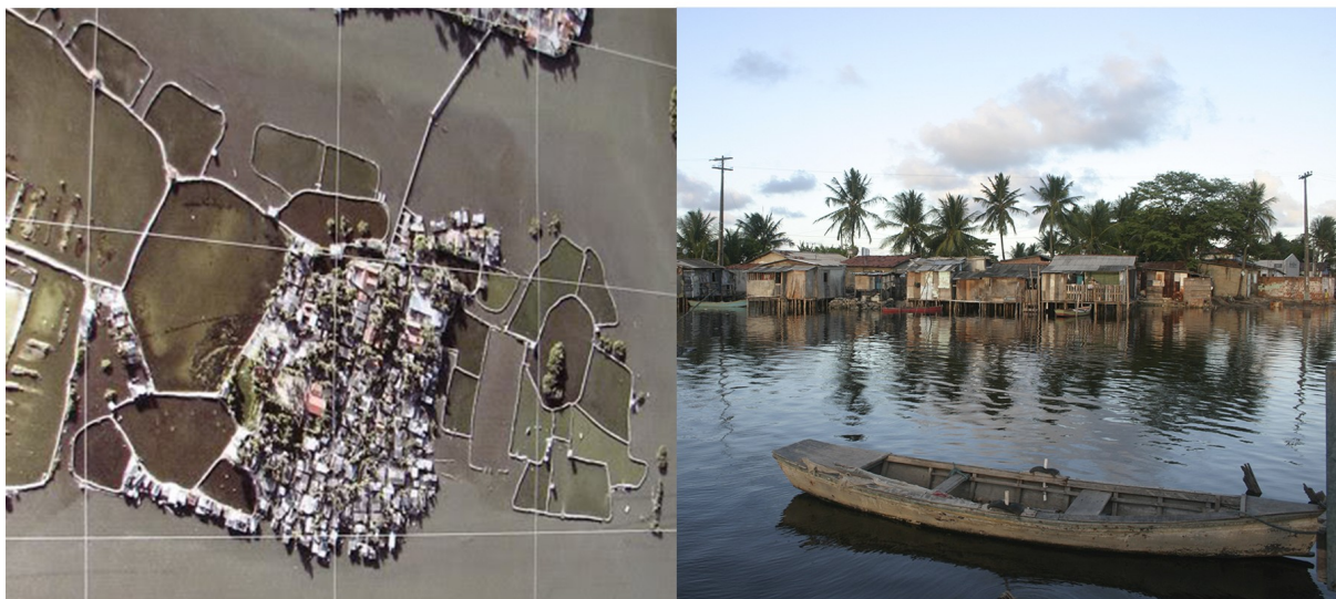
Imagens do acervo da ONG Saber Viver, década de 2000. Disponíveis em seu website

As lutas sociais urbanas entre os ilhéus, assim como em outros assentamentos informais do Recife – a exemplo do Coque 2 (Ferreira, 2011) –, tiveram o seu auge nos anos 1980 com a chegada de movimentos sociais religiosos difundindo valores sociais humanísticos entre as populações pobres. A ONG Saber Viver 3 ilustra bem este fato histórico, a organização social mais antiga em atividade na Ilha, fundada em 1983 com o suporte de entidades da Igreja Católica, através do Frei Beda 4 , um padre alemão que realizou importante trabalho de base comunitária. O padre também foi um dos grandes personagens engajados na luta por transformar a imagem da Ilha diante da cidade. Moradores relatam que a década de 1990 foi um período de grande engajamento coletivo em prol da conquista de direitos sociais básicos para a comunidade.