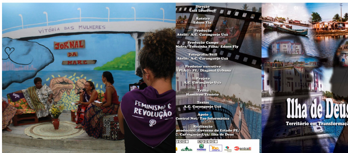
Esq.: Filmagem da primeira temporada do “Jornal da Maré” / Dir.: Capa dvd do documentário “Ilha de Deus - território em transformação”. Imagens disponíveis nas redes sociais da Caranguejo Uçá

enquanto comunidade pesqueira urbana politizada e engajada na luta por visibilidade e direitos dos pescadores e pescadoras da cidade.