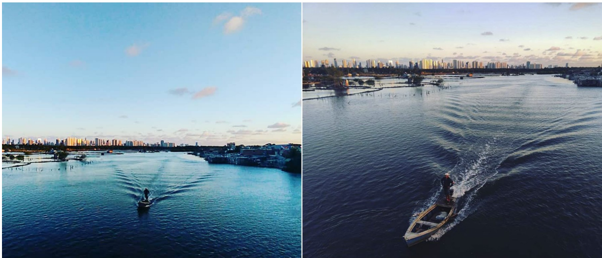
Imagem capturada da ponte que dá acesso à Ilha de Deus. Fotografias de um dos membros da Caranguejo Uçá [Ano 2018]

"A gente tá aqui há muito tempo e nossa discussão é urbanizar isso da forma que a gente quer viver, porque a cidade é urbana, mas é pesqueira e é mangue" (fala de morador da Ilha em evento da Caranguejo Uçá)