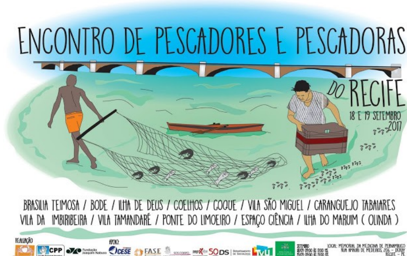
Arte diagramada por membros da Caranguejo Uçá. No cartaz é possível ver os nomes de tantas outras Zeis cujos membros se identificam enquanto comunidade pesqueira.

Ao passo que foi possível observar mais de perto o trabalho da organização, também pudemos perceber a contundente complexidade de redes e escalas que envolvem as suas práticas. Ao mesmo tempo em que a Caranguejo Uçá defende, à nível metropolitano, a pesca artesanal enquanto expressão tradicional da cultura recifense, também disputa internamente, ao nível local, a cotidiana construção desta identidade pesqueira na própria comunidade – onde suas atividades com radiodifusão exercem um importante trabalho de coesão social interna na ilha. Ao mesmo tempo, rompem com antigas lideranças locais e suas estruturas clientelistas de acesso ao poder, construindo redes de solidariedade com outras organizações sociais da cidade e comunidades pesqueiras do Recife.