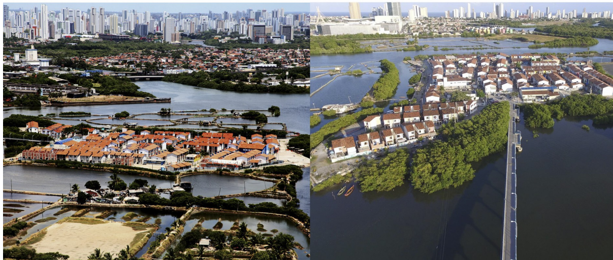
Esq.: Ilha de Deus, com últimas habitações em construção, acervo ONG Saber Viver, ano 2011 / Dir.: Imagem capturada com drone da Caranguejo Uçá, ao fundo zona sul da cidade, ano 2015

então bastante inovador (Moraes, 2017), defendido como política pelo então governador de centro-esquerda Eduardo Campos 5 .