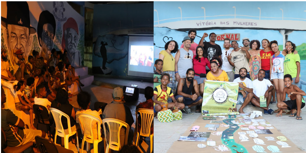
Esq.: Anfiteatro da Caranguejo Uçá (Ilha de Deus), exibição de cineclube, agosto 2018. Dir.: Registro de dinâmica de grupo em encontro da Ong com outras organizações da cidade, 2018

Percebem a importância da regularização de um território pesqueiro na cidade, para frear o avanço especulativo sobre as margens dos rios recifenses e também a sua degradação ambiental. Movimento político em curso na cidade, do qual são principais protagonistas. Para eles, a existência de tal território ameaça interesses econômicos de gente poderosa, se tornando imprescindível a necessidade de fortalecer redes nacionais e internacionais de cooperação cada vez maiores. Ainda, o atual cenário político e econômico nacional acena para uma redução significativa de apoio e financiamento à organizações não-governamentais, demandando ao grupo novas estratégias para a captação de recursos internacionais, caso contrário, sob o forte risco de não haver possibilidades de continuação de seus trabalhos.