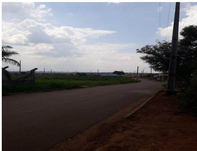
imagem abaixo é da avenida que conduz ao bairro, sendo esta a entrada que permite o acesso mais rápido, pois a outra está localizada atrás do setor Barros, tornando-se necessário contornar este setor. Por esta via é que se tem o acesso ao ponto de ônibus e a BR 153 por ser o percurso principal para ir aos bairros centrais e comerciais de Araguaína.