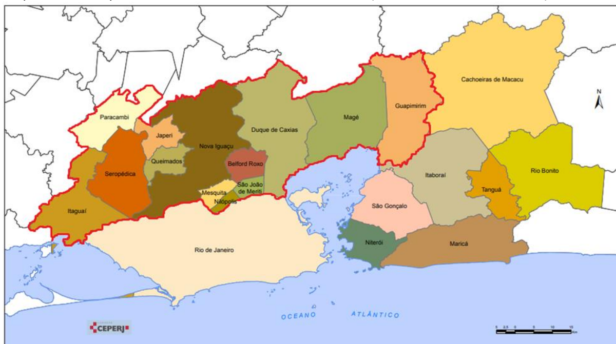
Mapa1 – Municípios da RMRJ e da Baixada Fluminense (contornada em vermelho)