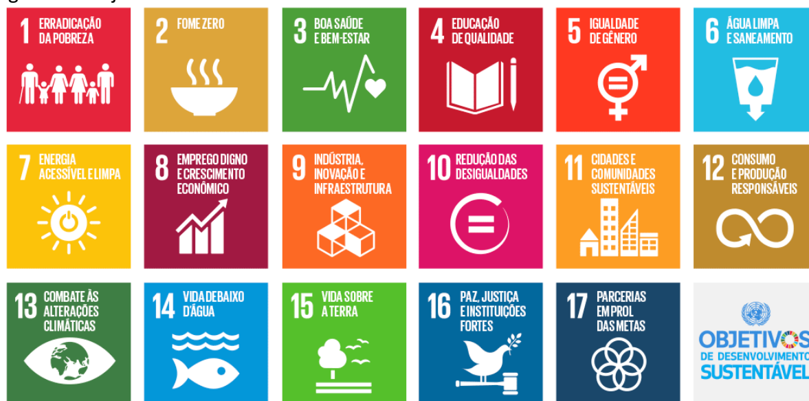
Figura 1 – Objetivos de Desenvolvimento Sustentável – ODS