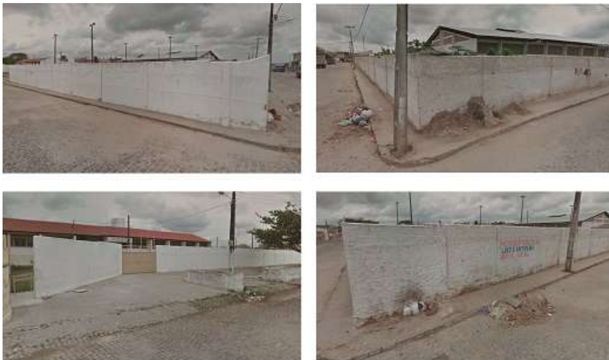
Figura 02,03,04 e 05 - Centro Social Urbano antes da reforma.