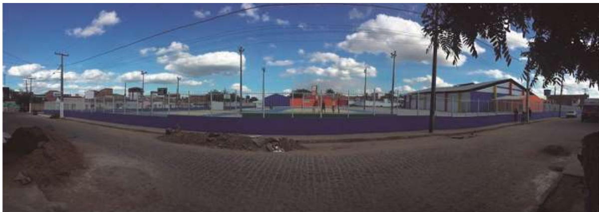
Figura 06, 07 e 08 - Centro Social Urbano após a reforma.