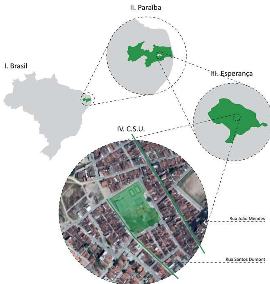
Figura 01: Mapa de localização.