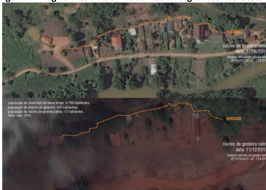
Figura 1 – Página interna dos “cadernos cartográficos” de Gesteira

Os “cadernos do reassentamento” produzidos para as pessoas atingidas em Gesteira (Fig. 1) tiveram como objetivo documentar o que foi perdido em decorrência do desastre de Fundão, podendo ser utilizado, inclusive, como documento probatório em juízo, se for o caso. Para isso, os “cadernos” contêm informações e imagens sobre o território afetado e as edificações destruídas (incluindo o levantamento arquitetônico da casa das pessoas atingidas, transformadas em ruínas pelo desastre), dados sobre as pessoas integrantes do respectivo núcleo familiar e sobre a produção de autoconsumo, que é típica daquela comunidade. Além dessas informações, os cadernos representam graficamente as relações de parentesco, vizinhança e amizade que existiam na comunidade de Gesteira e que caracterizam, juntamente com a produção de autoconsumo, um modo de vida que também foi perdido e que deve ser objeto de reparação.