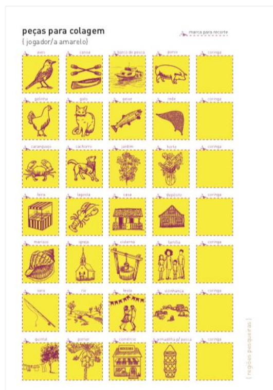
Figura 6 – Pictogramas do jogo [r]existir: regiões pesqueiras/populações ribeirinhas