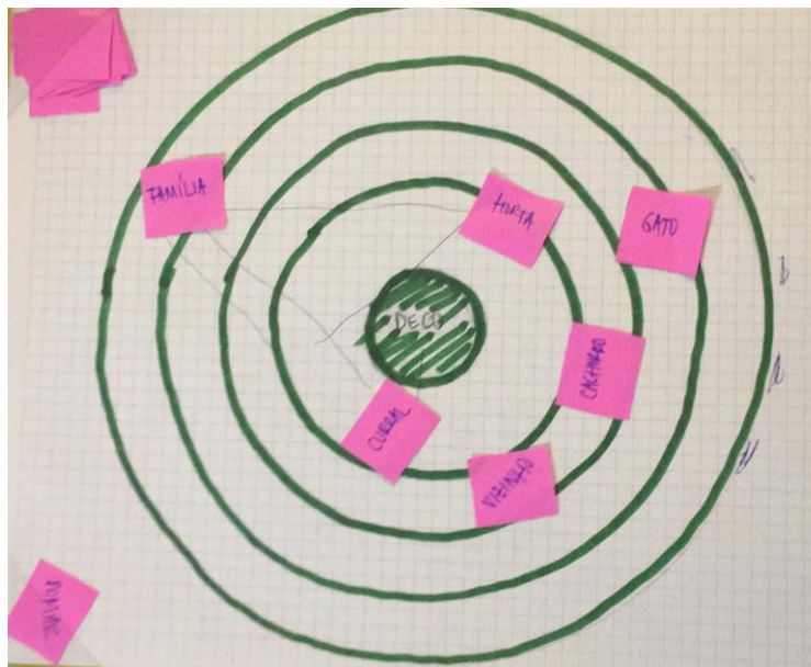
Figura 2 – Esboço apresentado na primeira reunião geral de equipe, que deu origem ao tabuleiro

um tabuleiro com círculos concêntricos, tendo o círculo como a representação do núcleo familiar, e receberiam uma cartela contendo peças (pictogramas) com desenhos relacionados à vida no campo. A dinâmica do jogo consistia em que cada jogador/a, na sua vez, escolheria um pictograma e o posicionaria mais próximo ou mais distante do centro do tabuleiro, conforme o grau de importância que a imagem representava para aquele/a jogador/a.